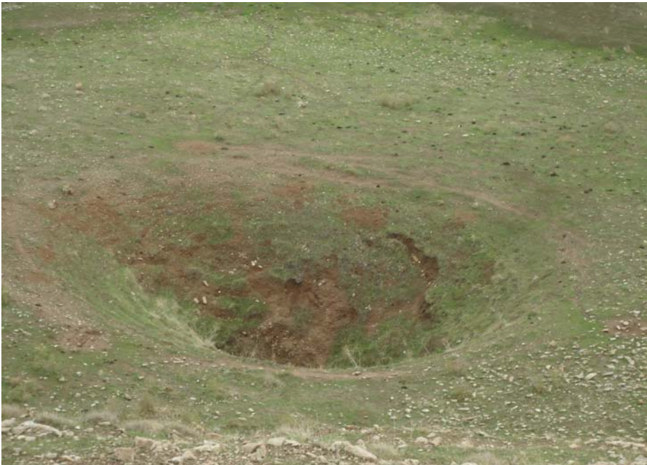
ئەشكەوتى چالە بروسكە