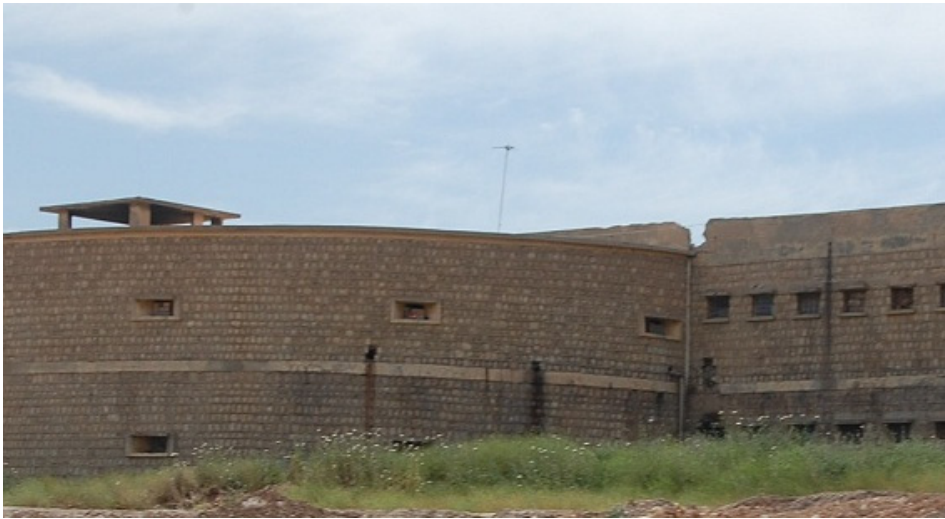
ويته ي قه لاي نزاركي له دهوك