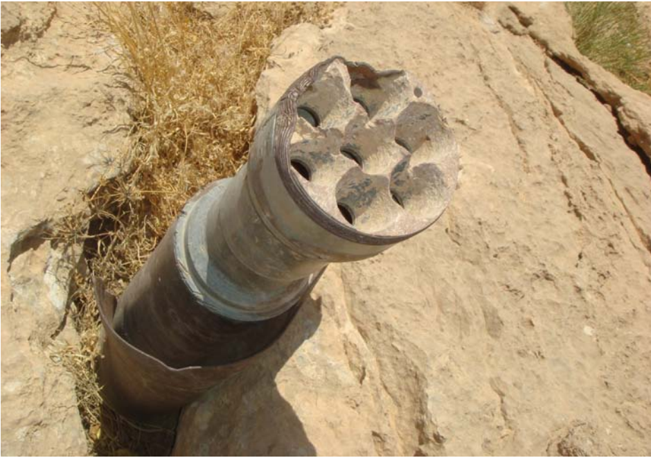
گولله‌یه‌کی کاتویشا له چبای دابان - ناوچه‌ی ئه‌نفالی یه‌ک