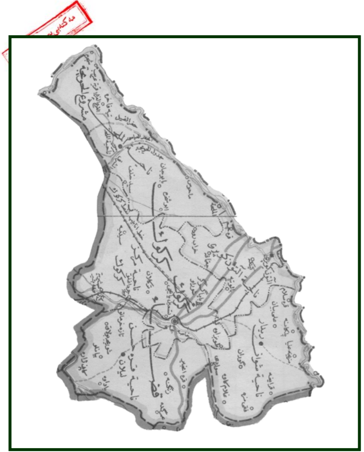
خریطة قضاء كركوك