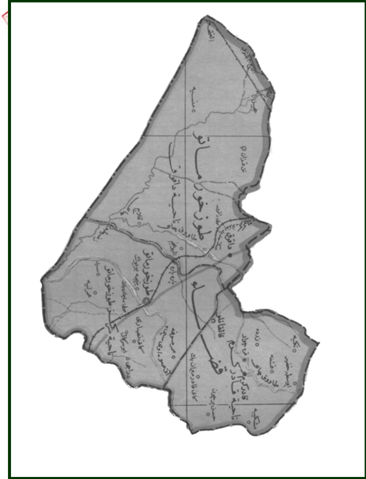
قضاء طوز خورماتو