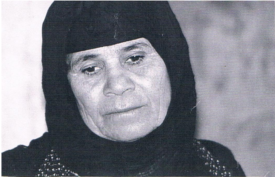
دایكی كه سوکار ئه نفالکراو / ئه و ده موچاوه ی هه موو تراژیدیاكانی تیدا ده بینرین ( وینه / نوسه ) ( ئۆردوگای رزگاری )

به ستونه ته وه بۆ ئه وه ی نه ك هه ر به ته نیا ئازاری مندا له كانیان بدری ، به لكو ئازاری رۆحی و گیانی دایك و باوكیشیان بدهن. ئایا جگه له خۆیان كی ده توانییت له ناخه وه له م ئازاره یان تیگیات ، له وه ی كه به شیک له رۆح و له جهسته ت به ئازاره وه لیكه نه وه. هه موو ساتیكیان ئه نفال كردنیكه. دلنیام ته نیا له مردنی كۆتایاندا له وانه یه بتوانن پشوی رۆح بدهن. ئیسته ئه وانه ی كه زیندون، زیندویه کی مردون.