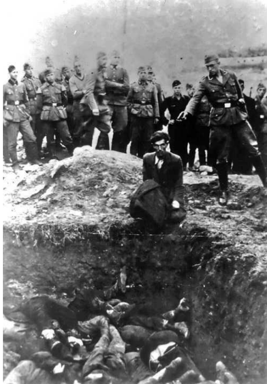
کۆمه ل کوژی کورد له شاری ناگری له لایه ن رژیمی تورکه وه