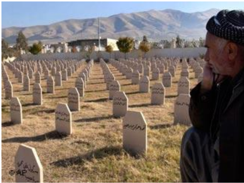
هه له بجه / گوړی قوربانیانی کیمیا باران

(زینف) و چهکی تری کیمیاوی ده توانری به کار بهینری. ئه و کارگانه بو ئه و مه واده کیمیاویانه ی که ئیسته بیکیشه و گروگرفت ده توانریت بنیردرینه دهره وه داوی مۆلهت بکری و ریگا به ناردنه دهره وه یان نه درئ. به لام ناوی جوړی مه واده کان نه هینرابوون. به پیی شاره زایان پینج ، یان شه ش مادده ن که ئاسایی مه ترسیدار نین ، به لام له په یوه ندی و تیکه لاو کردنیان و به کار هینانی هاوکیشهی خو ی ده بنه چه کیکی مه ترسیداری کیمیاوی کوژهر.