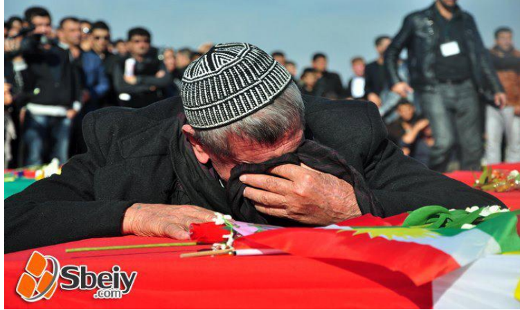
ئەو وینە یه ی خۆی بۆ خۆی دەدوێ

ئەنفال دەرکەوت. کەچی وەزیری ئەنفال و مافی مەرۆڤ و ئاوارەو کوردە فەیلیه کان و... تاد. ئەو کاتە ی حکومەتە کە ی سلیمانی سەردانی شوینە کە ی نە کردو لە سەر ئاستی فەرمیی بە دۆکیومێنت نە کراو وینە کان بۆ رای گشتی نە گوازانە وه.