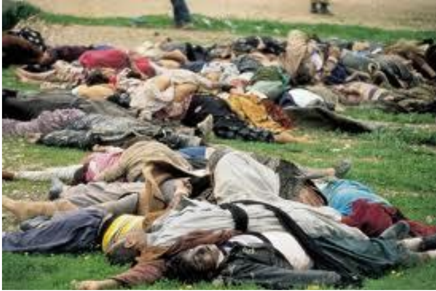
کۆمهل کۆژیه که ی هه له بجه له لایه ن رژیمی به عس