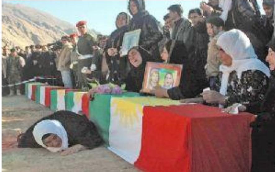
کۆ ده توانی له نازاری ئەم مۆفانه تیپگات جگه له خۆیان