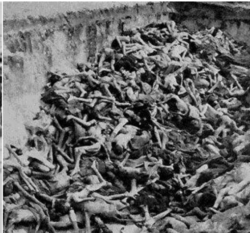
Corpses in mass grave at Auschwitz