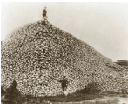
( که له سه ری کزکراوه ی هنده سوره کان دوا ی جینۆساید کردن و به کۆمه ل کوشتنیان )