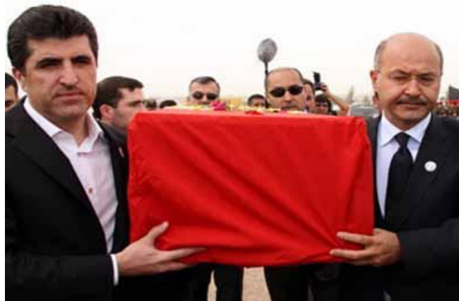
له بهر ئه وه ی شوینی هه لگرتنی روفاته کانی ئه نفال له کوردستان نیه ، ئه وانه ی له و ناوچه یه دۆزرانه وه له که ره به لا دانران. به هۆی شوۆرتی کاره باوه زیاتر له 27 که سیان سوتان / 2012

ئوه وایه تاوانباره نازیه كان له سه رده می رژیمی هیتلهدا یه هودیه كان جینۆساید بکه ن به لام دواى روخانى رژیمه که ی هیتلهر حکومه تی دواى ئه و چاو له تاوانباره نازیه كان دابخات و لیپرسینه وه یان له گهل نه کریت و دالدهش بدرین. بیهه لویستی و بیده نگی ره زامه ندی ده به خشیت. ئه م بیده نگیه باکراوندی خو ی هیه. ژماره ی دۆسیه کانی که یسی ئه نفال له لایه ن دادگای بالای تاوانه كان له به غدا بریتیه له 43 دۆسیه و له 8500 لاپه ره پیکهاتوه. به هه مان شیوه ده سه لاتی سیاسی به غداش به ر ره خنه که وتوه چونکه ئه م یس هه نگاوی نه ناوه بۆ ده ستگیرکردن و دادگایی کردنی تاوانبارانی جینۆساید به پیی بریاری دادگای بالای تاوانه کانی عیراق.