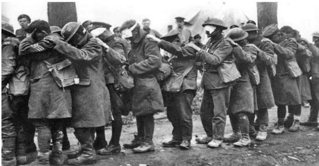
British 55th Division gas casualties 10 April 1918

ئه لمانه كان له بهردهم حكومهتی ئیسرائیلدا خۆیان زۆر به شهرمه زار و قهرزبار نیشان ئه ده ن كه دهشبیت و ابیت ، به وهی كه به رامبهر به و گه له كراوه . فرۆشتنی چه کی كیمیاوی له لایه ن ئه لمانیاوه به عیراق كه پێش داگیرکردنه كه ی كویت هه ره شه ی له ئیسرائیل پێده كرد كه نیوه ی ولاته كه به چه کی كیمیاوی ده سوتینێ شوینه واری خۆی له سیاست و له میژودا بۆ زۆر لایه ن به رامبهر به ئه لمان جیدیلێت . هۆكه یشی ئه وه یه چونكه ئیسرائیل حكومه ته ، خاوه ن كیان و قه واره و ده سه لات و لۆبیه . خاوه ن جالیه یه له دونیادا ، له ئه وروپاوه له ئه مریكادا ، هه روه ها له سه ر ئاستی دبلۆماسیدا . له بهر ئه وه ی كورد خاوه ن ئه م ده سه لات و ده زگایه نیه و بێ كیان و بێ ده ولت و بێ پارێزه ره و خۆشی كه مه رخه مه هه تا ئه مرۆكه نه ك قه ره بوو نه كراوه به لكو داوای لیبوردنیشی لینه كراوه . به لام ئیسرائیل له قه ره بووی به گاز كوژراوه كانیان به كوشتنی به كۆمه لی یه هودییه كان جگه له ده سته كه وتی سیاسی به ملیارد ماركیان داواكردوه و سه ندوه . كاربه ده ستانی حكومی و حیزیبی گه وره ی ئه لمانیا ده چنه ئیسرائیل و له وی كاوه بچوكه یه هودییه كه یان ده كه نه سه رو به ره و شوینی یاد كردنه وه كانیان ده بن و له بهر ده میاندا ده یانچه میننه وه . ئه مه یه هیشتا واقعی دنیا ی ئه مرۆكه . به ته نیا بوونی ده وله تیکی كوردی به س نیه ئه گه ر ده سه لاته كه ی وه ك یه هوده كان نه ته وه یی ره فتار نه كات .