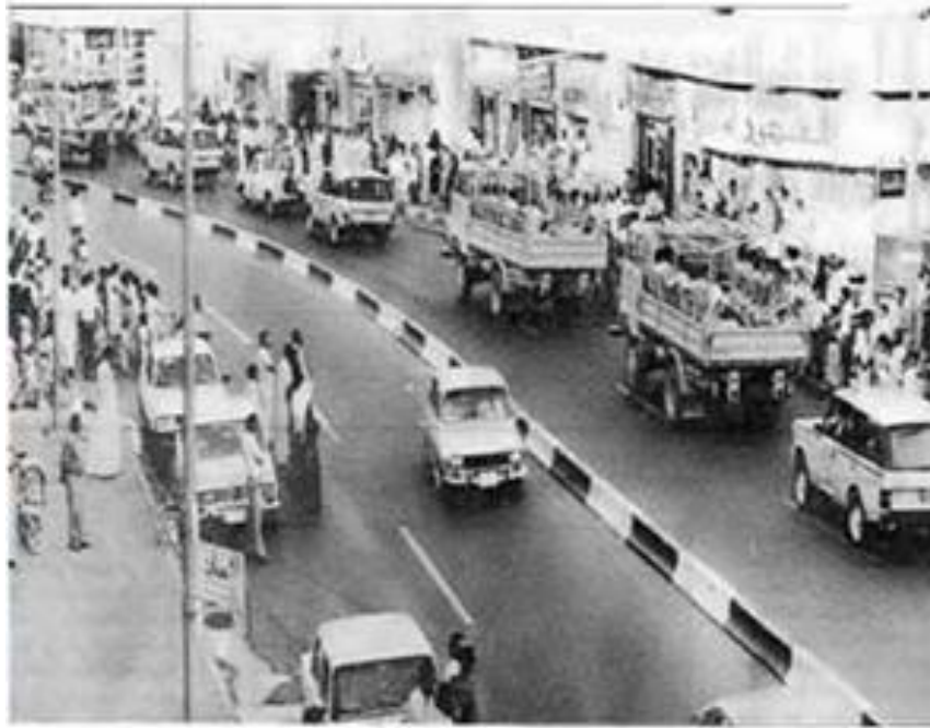
گواستنه وه ی خه لکی سه ئیلی کورد بۆ ئه نفال کردن

یه عنی که ی سه رژمی ریه کی راسته قینه کرا به ریکوپیه کی ئه و کاته مرۆف ئه توانی بلی ئه م 182 هه زاره که می هه یه یان زیادی هه یه .