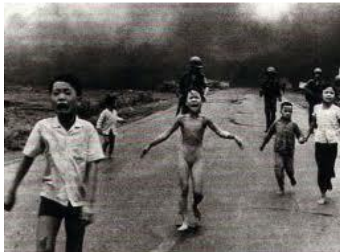
سوتانی مندالانی گوندیکی قیتنام به چه کی نیوده وه له تی قه ده غه کراو له لایه ن حکومه تی ئه مریکا له جهنگی قیتنامدا

سالی 1974 خرایه به رده م و له راپۆرته که دا هاتوه: "بۆ ده یان و بگره زیاتر له سه د سال ده خایه نیت هه تا شوینه وارو ئه نجامی خراپی ئه م مه واده کیمیاویانه نامینن. ئه نجامی خراپی ئه م مه وادانه بۆ سه ر مرۆڤ و له دایک بوونی مندالی سه قهت نه ک هه ر به ته نیا له قیتنام به لکو له ئه مریکاش له مندالانی سه ربازیکی زۆر ده رکه وتن که له به کار هینانی ئه م مه واده کیمیاویانه له و ولاتانه وه ک قیتنام تیکه ل بوون پیی. دوا ی ماوه یه کی دریز ئه نجامه که ی به هۆی چه ند ده رکه وته یه کی چاوه روان نه کراو ده رده که وی. جهنگی قیتنام دورودریژترین و گرانترین جهنگ بوو له میژوی یه کیته ویلایه ته یه کگرتوه کانی ئه مریکا. بۆ یه که مجار له میژوی جهنگدا به هۆی ئه مریکاوه ریژه یه کی زۆر له ماده ی (هیربیتسید) چه کیکی کیمیاوی دژ به روه ک به کار هینرا. ئه نجامه کانی بریتین له ویرانکردنیکی مه ودا ی دور له زه وی کشتوکالی و ناوچه ی سه وزایی. له 90٪ ی به رنامه ی ویرانکردنه که به ئامانجی وشکردن و ویرانکردنی دارستانه کانی قیتنام بوو. ئامانجه که ی تری بۆ ویرانکردنی به روبومه کشتوکالیه کانیان بوو. کۆچی دانیشتون له ناوچه کشتوکالیه کانه وه بۆ شاره کانی ژیر کۆنترۆلکراوی ئه مریکيه کان ده گه ریته وه بۆ ئه نجامی هیژشی ماده ی (هیربیتسیت). له وانه شه ئه مریکيه کان ئه م دیارده یه یان مه به ست بوییت 6 . شتیکی نهینی نیه که رژی می عیراقیش له کوردستان / عیراق هه مان ستراتجیه تی په یه وه ده کرد. به لام به هۆی سه رقالی رژی می به عس خۆی به کیشه کانیه وه به هۆی راپه ری نی کورده وه هاتنه پیشی بارودۆخیکی نوێ حکومه تی به عس چیتر نه یه توانی دریزه به و ستراتجیه ی بدات له کوردستان.