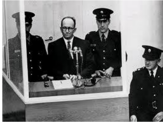
ئەدۆلف ئایشمان کاتی دادگایی کردنی