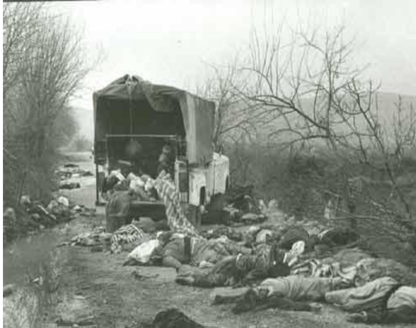
کوشتنی به کۆمه لی خه لکی سفیل به گازی ژه هراوی / هه له بجه