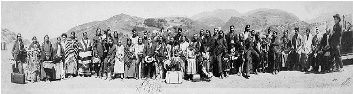
هنده سوره کانی کیشوره ی ئەمریکا

به روونی ده رده که ویت نه و راستیه به که هنده سوره کانی خه لکی ئەسلی ئەم ولاته له لایه ن ده سه لاتی که وه به میتۆدی هه مه چه شنه و نه خشه کیشراو، و عه مدی ریگای جینۆساید کردنیان گیرایه به ر. هه ولی له ناو بردن و کۆمه ل کوژیان و گۆرینی که لتورو زمان و فره هه نگ و نه ریت و به ها کانیان درا. له سه ر زه وی و نیشتیمانی خۆیان هه لکه ندران و له شوینه زۆره مله بیه کان نیشته جی ده کران و شیوه به کی تری ژیانیان به سه ردا سه پیندراو ریگا له زاوژی کردنیان پیاده ده کرا. نازاری رۆحی و جه سه تی و گۆرینی ناسنامه یان بووه. ئەوه ی به رامبه ر هنده سوره کان ئەنجام درا هۆلۆکۆستی ئەمریکی بوو. ئەو هۆلۆکۆسته ی له سالی 1492 به دواوه له لایه ن کۆلۆنیالیسته ئەوروپیه کانه وه بووه هۆی ویران کردنی نزیکه ی 100 ملیۆن ژیان. ژماره به کی زۆری هنده سوره کان به ته رو شمشیر پارچه پارچه کران. به زیندویی ده سوتینران ، له ژیر قاچی ئەسپدا پان و پلیش ده کرانه وه. بۆ یاریکردن راویان ده کردن، ده کرانه خواردنی سه گ ، ئەشکه نجه ئەدران و سه ریان لیده کرانه وه و به سه ر داردا هه لده واسران. به زیندویی به سنگی قه سا بخانه دا هه لده واسران ، له پایۆره وه فری ئەدرانه نیۆ ده ریاوه. وه ک کۆیله کاری مردنیان پیده کردن ، به عه مده ن له به ندیخانه دا به سنگی داره وه برسی ده کران هه تا مردن ، یان له به ر سه رمادا ره ق ده کرانه وه ، تووشی نه خوشی سارییان ده کردن. ئەمانه هه مووی مرۆف بوون ویران کران. ئەوانه ش ئەم تاوانه یان ئەنجام ئەدا هه ر مرۆف بوون. ئەگه ر بروانینه زه مه نی ئەم کۆمه ل کوژیانه ئەوا ده بیته بوتری که ئەم ژماره به به راورد به ژماره ی دانیشتوانی ئەو کاته ی جیهان پێژه و ژماره به به کی زۆره له مرۆف.