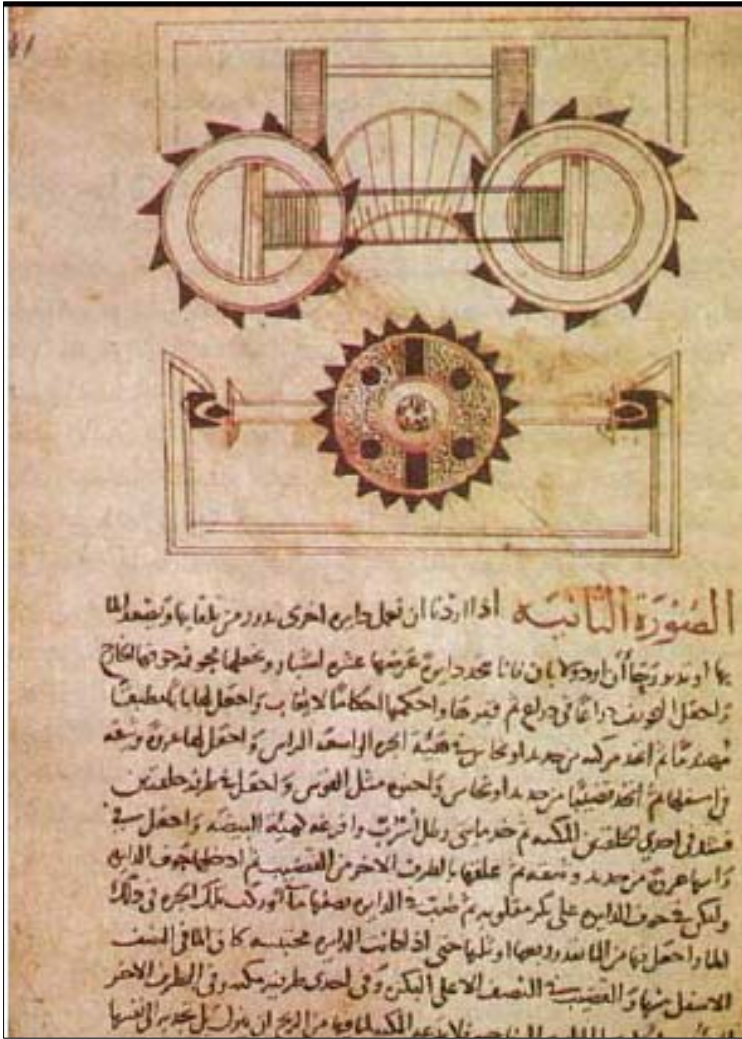
پاشکوی ژماره (۳)

یه کتیک له کتیبه وه رگتیردراوه کان (فیلون الأسکندری) بؤ زمانی عه ره بیی که باس له ئامیژیکی به رزکردنه وهی ئاو دهکات