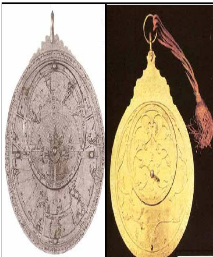
پاشکوی ژماره (۸)

چهند ویننه یه کی دیکه ی نامیری (الأسطرلاب) که له موزه خانه کاندای پاریژراون