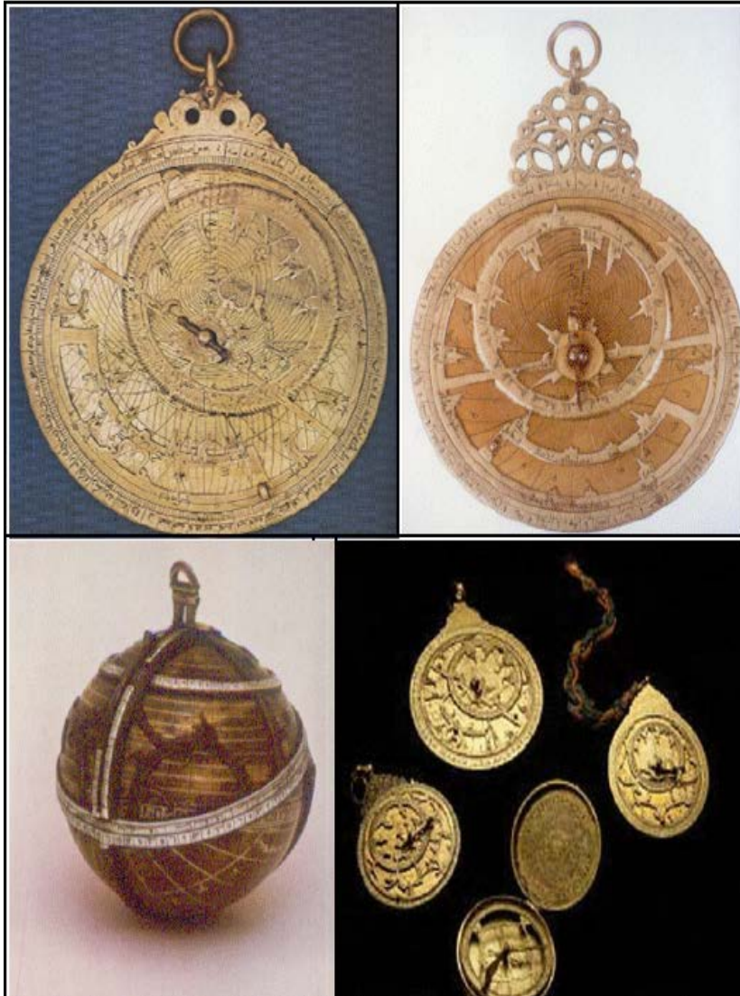
پاشکوی ژماره (۷)

چند وینہیہ کی دیکھی ٹامیری (الأسطرلاب) کہ له مؤزه خانہ کاندہ پاریزراون