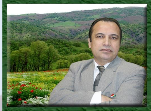
هەر سه‌رکه‌وتوو بن.

خویندەری هیژا! پیش هه‌موو شتیکی به پیوستی ده‌زانم سیاس و پینزانیی خۆم ناراستەدی هه‌موو ئەم بە‌ریز و نازیزانه بکه‌م که به وه‌لام دانه‌وه‌دی نهرینی په‌یام، و وه‌لام دانه‌وه‌دی پرسیاره‌کان که به‌مه‌به‌ستی نامه‌ده کردنی ئەم نامینکه‌یه که بو‌ریزگرتن له‌ای ماریس روژی نیونه‌ته‌وه‌یی ژنان ره‌وانه کرابوون.