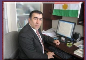
۹- بەرىز برايم جەھانگىرى