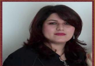
۱۳- خاتوو كوستان نىستانى