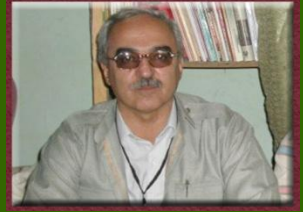
۵- بەرىز كەمان كەرىمى