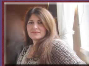
۱۰- خاتوو كوستان گادانى