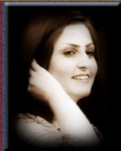
۱۵- خاتوو شەونەم ھەمزىبى