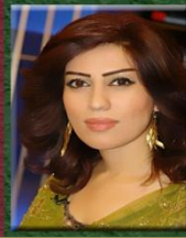
۲- خاتوو شلىر باپىرى