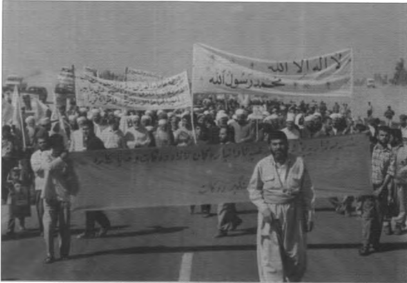
المسيرة الجماهيرية في مدينة اربيل في ٢٠٠٣/٧/٢١