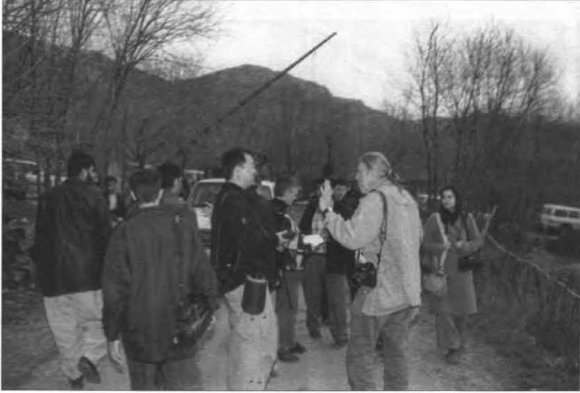
الصحفيون الاجانب لدى زيارتهم الى مقرات الجماعة في أحمدآوا وخورمال بعد خطاب كولن باول، ٢٠٠٣/٢/٨