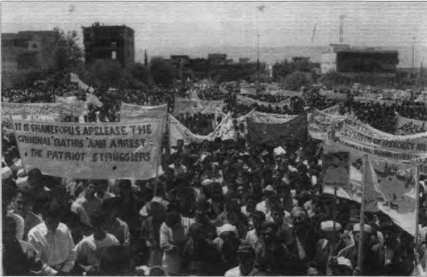
المسيرة الجماهيرية في مدينة السلمانية وضواحيها في ٢/٨/٢٠٠٣.