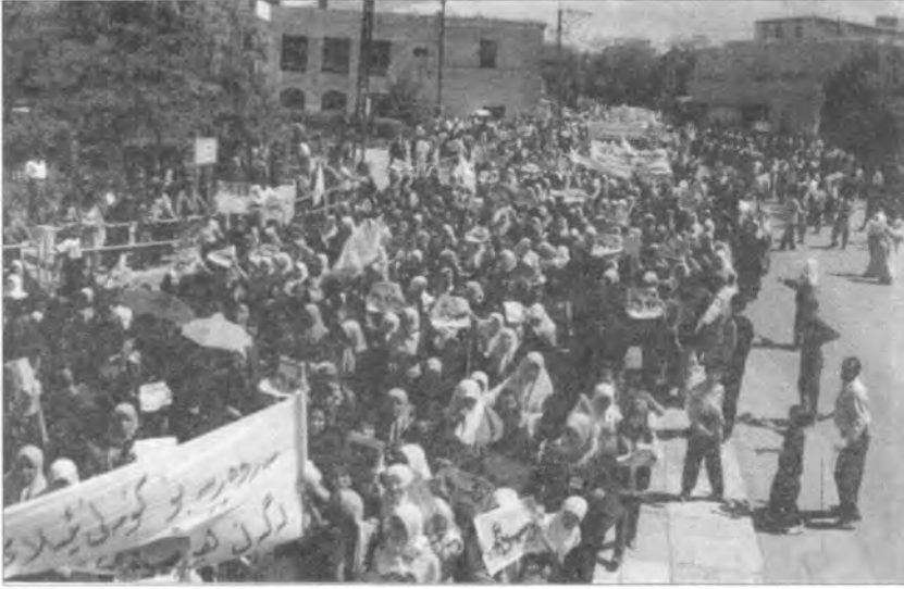
المسيرة الجماهيرية في مدينة السليمانية وضواحيها في ٢٠٠٣/٨/٢