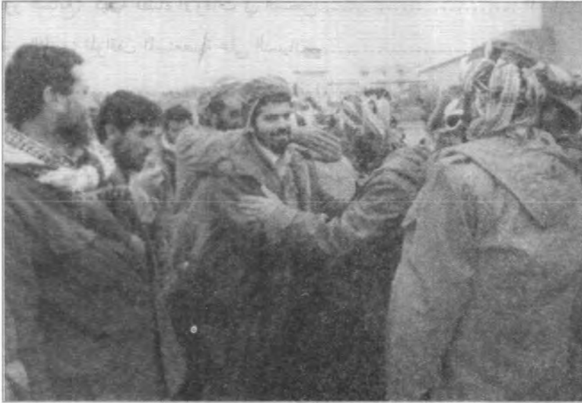
الشيخ علي باير لدى نزوله الى المدن بعد إنتفاضة آذار ١٩٩١ وتحرير كردستان.