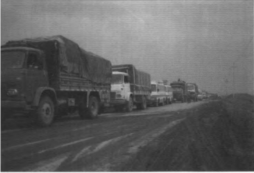
نقل مقرات الجماعة الإسلامية إلى منطقة (دارشمانة) بعد القصف الصاروخي، ٢٧/٣/٢٠٠٣.