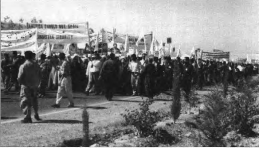
المسيرة الجماهيرية في مدينة اربيل في ٢١/٧/٢٠٠٣.