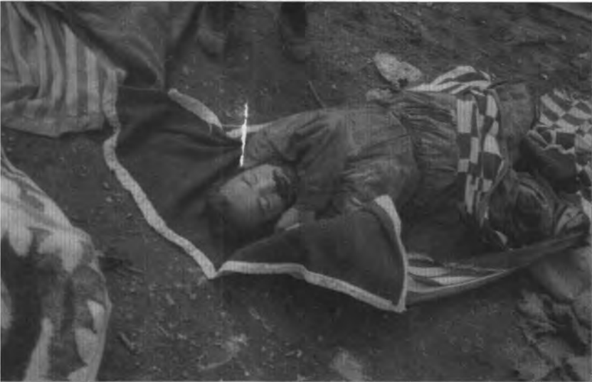
أحد شهداء القصف الصاروخي الذي تعرض له مقرات الجماعة الإسلامية — أحمدآوا ٢٢/٣/٢٠٠٣.