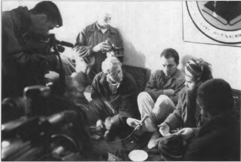
الشيخ علي باير يتحدث الى الصحفيين الاجانب في مكتبه - أحمد آوا، ٢٠٠٣/٢/٨.