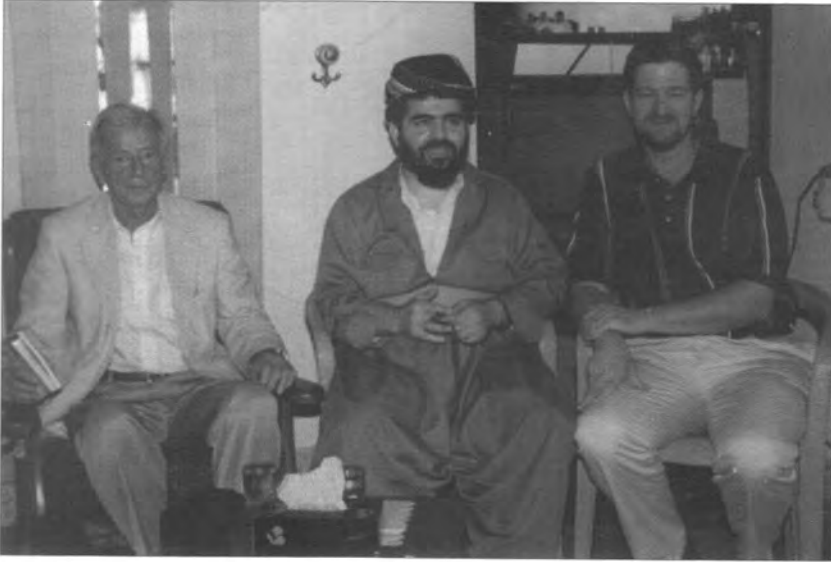
بل ستيوارت، الاستاذ على باير، السفير وليام إيغلتن، ٢٠٠٣/٦/٢٣