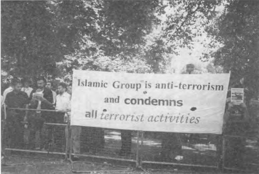
مسيرة الجالية الكردية وأعضاء الجماعة الإسلامية في مدينة لندن في ٢٠٠٣/٨/٧