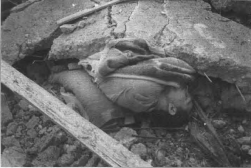
مشاهد من آثار القصف الصاروخي الذي تعرض له مقرات الجماعة الإسلامية — أحمدآوا ٢٢/٣/٢٠٠٣.