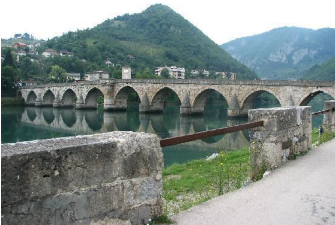
دیمه‌نی ئیستای پرده‌که‌ی سه‌ر رووباری درینا - فیشیگراد