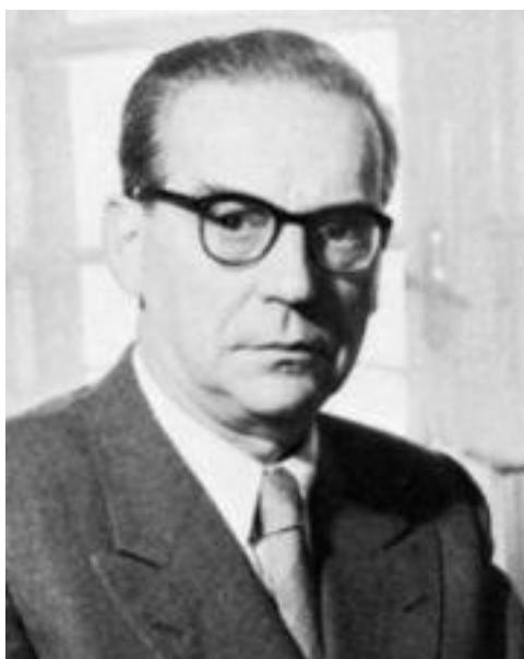
نوسەر ئیقۆ ئاندریچ 1892 - 1975