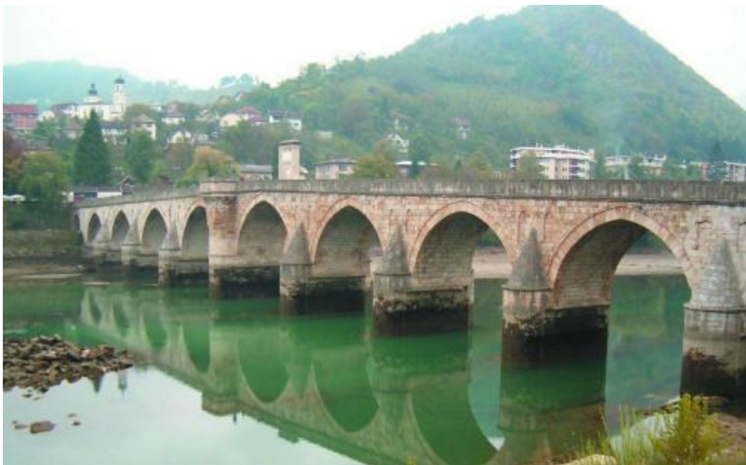
پرده‌کھی سهر رووباری درینا