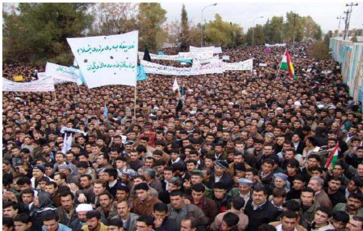
راهپیمایی روز دوشنبه 2006/2/14 شهر هولیر

علیه این کتاب بلوا راه انداختند. به خیابان ها ریخته و نویسنده‌ی کتاب را تهدید به مرگ کردند.