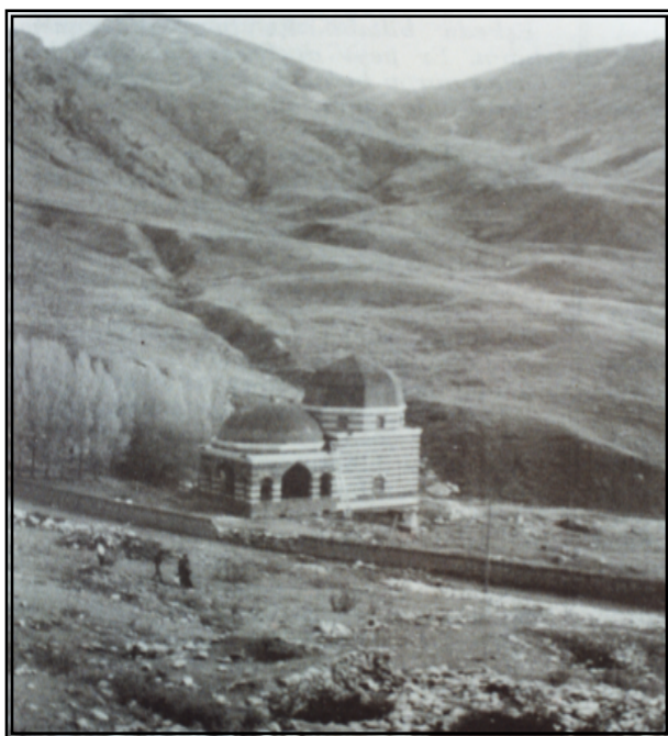
ئەو گونبەدا ژ نوی ل سەر گۆرا خانی هاتیە ئافاکرن

ول دویف حسیبا ئەبجەدی یا فئی عیبارەتی ( ۳۱ ) سالیڤ دی ل سەر دیرۆکا مرنا خانی زیڤە دین ، و دیرۆک دبتە ۱۱۵۰ ک ( بەرانبەر ۱۷۳۶-۱۷۳۷ ز ) ، ومەعنا ژیی وی دەمی مری دی ( ۹۱ ) سالین . وەسا دیارە کو مرنا خانی هەر ل بایەزیدی بوویە ، و گۆرا وی نوکە ل ویری ئاشکەرایە ل نیزیکی شوینوارین مزگەفتا وی ب خو .