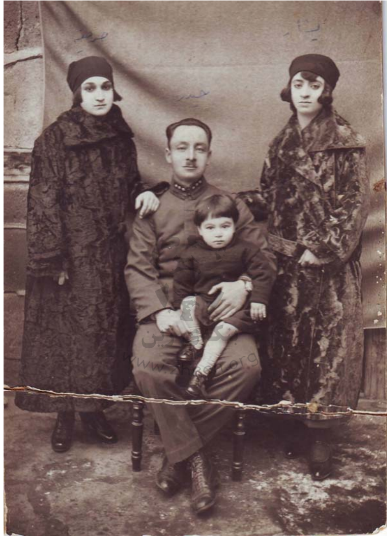
له چه پوهه: یه شار خانم، هیدر بهگ و منداله کهی، خانم سه دیکه ژنی هیدر