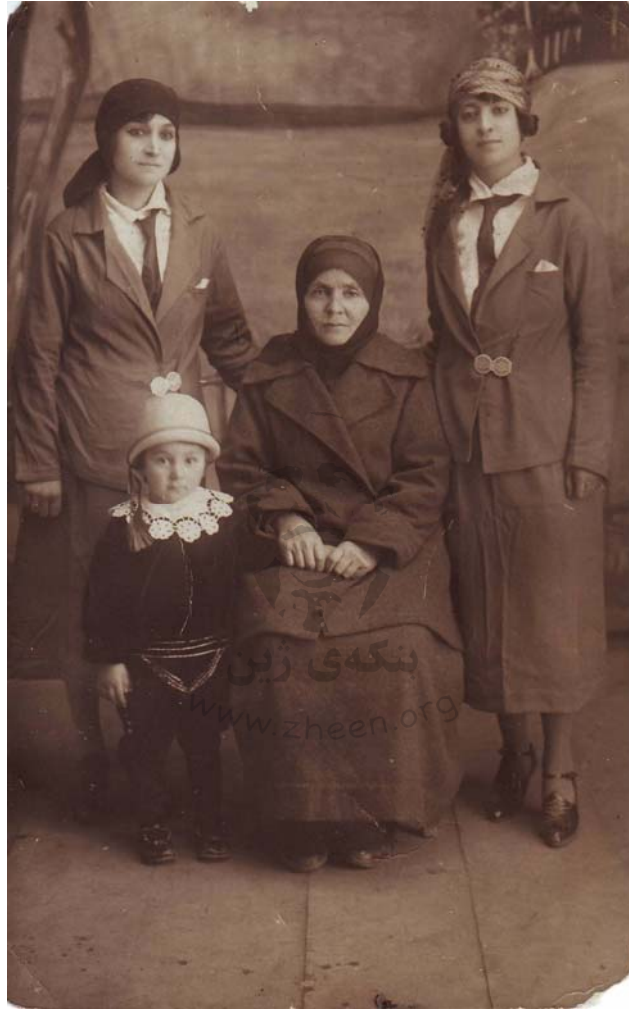
له راسته وه: یه شار خانم، عیفته خانمی دایکی یه شار، خانم سدیقه براژنی یه شار و منداله که ی- نیسانی ۱۹۲۶، ئه رزپووم