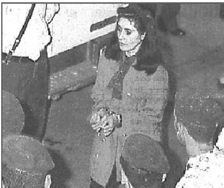
ل بەر دادگەها پاراستنا دەولەتی ۵. ۸. ۱۹۹۴

دادقانيا پۆلیتیکی ل تورکیئی خودی ترادتۆنەكە درێژە. پشتی ھەر ناکۆکیەکی ژ یین لەشکەرین دەولەتی، پۆلیتیقفان و ھەر وەھا شالیار و ئەندامین پەرلەمانی ژى، تین گرتن و دەرباسی گرتیگەھی دبن. لی تەقی قی یەکی ژى، پرۆسەسا ل دژی من و ھەقالین من یین کورد یین ئەندامین پەرلەمانی دوّم دکە، تشتەکی نوو یە د دیرۆکا دەولەتی دە. یەکەمین جارە کۆ نووینەریین مللەت یین ھلبژارتی و د بن سیا خوەدیگرافی حکومەتەكە سیفیل دە تینە گرتن و ژ بەر نەرینین خوە جزایی مرنی