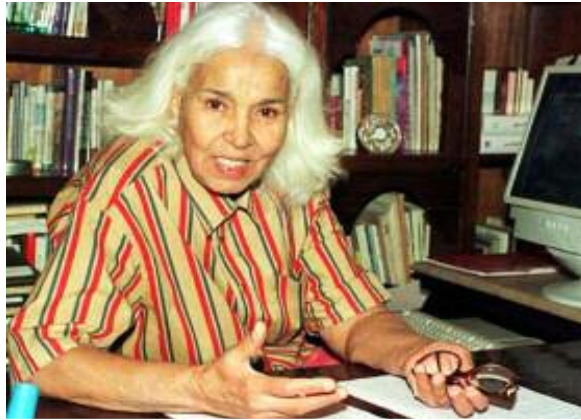
دكتوره نوال السعداوي

كۆقارئين ژنان وهشاندينه يهك ب عهريبي يا دن ب فهره نسي. ژ ئاليهك دنقه بير و باوهريين وي بانووور ل ههموو ژنيين جيهانا عهريبي كر. لي ژ سؤمبولين ژنيين عهريبي يين ژ ئهورؤيا يان رؤؤئاقا ب بانووور ژ بو بزاقا رزگاريوخوزيا ژني دكتوره (نوال السعداوي) يه ئهوتا نها بهردهوام بانگا وهكههقيي د ناقبهرا ميژ و ژنان دكهت د ههموو واران دا، ئه و ناخوازيت كو دهستههلاتا ميژي ل سهر جفاكي ههبيت وي هژمارهك پهرتووك وهشاندينه و وهرگيراندينه سهر چهند زمانين بياني، ديسان وي پر سنووورين جفاكي قوت كرينه، وهكه پهرتوكا وي يا بناقي (ألرجل و آلجنس) د گهل هند بابهتين دن وهكه تشتهكي پر دژوار ل جهم وهلاتين عهريبي تي ديتن ب واتهيا كو ئه و ب ئاشكهرا بهرخوهداني ل ههمبهر ههموو رهوشت و كهفنه شوپييين جفاكي دكهت، ههروهها سازيهك بناقي (تضامن المرأة العربية) ئافاكريه كو ژ ههموو رهكخستين ژنيين وهلاتين عهريبي ناقدارتره (1) .