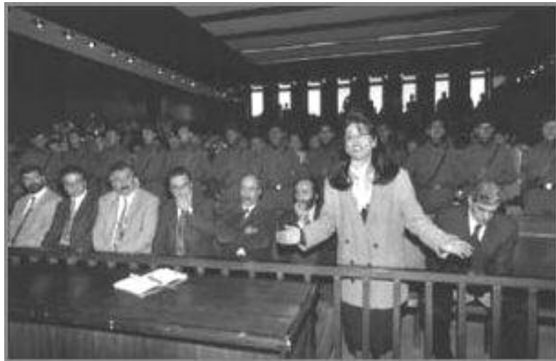
گۆتتا له یلا زانا یا داوی ل په رله مانئ ترکی

پۆژئاقا چارهکه دی ژ بهر بهرژهوهندیین خوه یین بازرگانی ب تورکیی په بی دهنگ دمینن، مینا کۆ ئه و بهری نهال هه مبهر عیراقی ژی و ژ بهر هه مان سه ده مان بی دهنگ مان ده ما کورد ل ور دهاتن قرکرن. . لی ئه ز ل هیڤیا پشتگریا هه فالین خوه یین په رله مانته رم، پاسفانین مافی ده برینئ و یا خویشکین خوه د ته فگه را ژنین جیهانی ده. (۱)