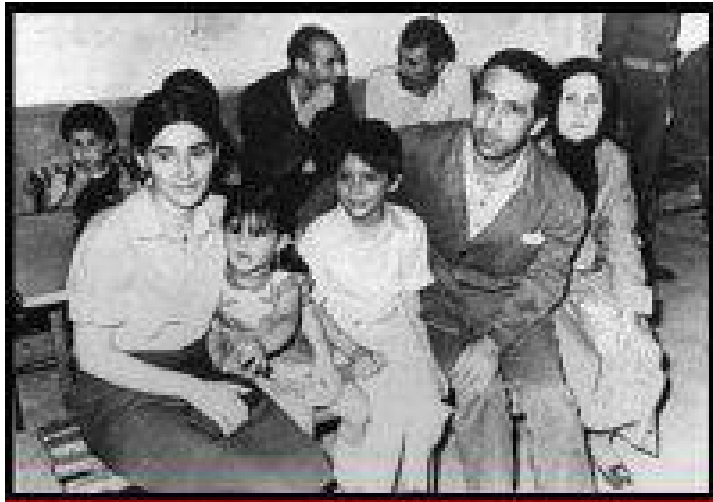
لهيلا، کهچا وي پوکهن، لوي وي پوناي، مهدي زانا نو ديبا وي

د پوژدهکي مينا ښي پوژي، د ۱۴ . ۰۵ . ۱۹۸۱ ښان تو هاتي سهر پوي دونيايي. تو د وهختهکي ده هاتي کو تي ده گهلهک پرؤبليميمن من ههبوون و ته من ژ نيشي من دوورخست. نهزي تو جاري ژ بيرنهکم بي چاوا ته چاښين خوه فهدکرن و چاوا نهز پيره دگريام، چمکي نهز ب تهنا خوه بووم د نهخوهشخانا زابووني ل نهقهري. من ژ خوه پرسى چما دښي بوو کو نهز کيلين ههري دژوار د ښانا خوه ده ب تهني دهرباسبکم. ل فر نهز بيست سالي بووم، ب دوو زاروکان و بيبي کهسهکي کو گوهداني ل من بکه. پشتي چهند دهقان من دهف ژ گري بهردا و من ژ بهر خوه شهرمکر. نهزا تو جاري نههيلم کو نهز بشکيم، سهري خوه پاکري