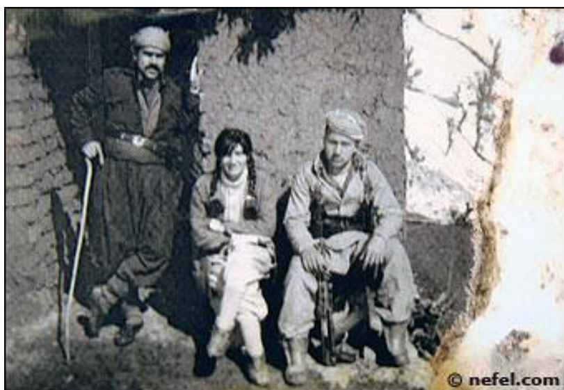
هېرو خان د دهما پېشمه رگاتېڼې دال نيښې دايه