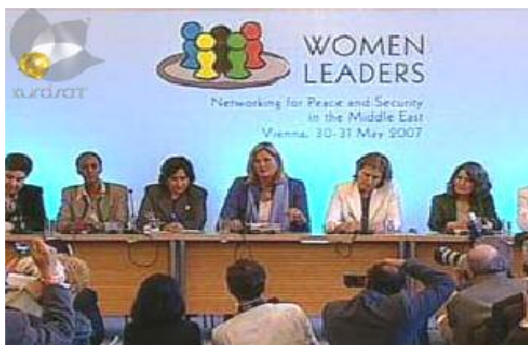
هېرو خان کونفهرانسې ژنيڼ سهروک ل څيهنا ۲۰۰۷