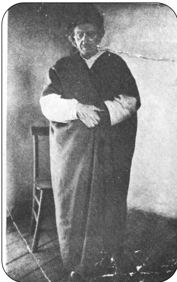
سهیدا د گرتیخانہیی دا دہمی کرنا نقیڑی