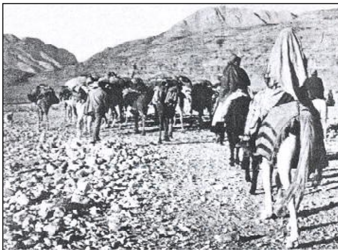
نمونه‌ک ژ کۆچریا کرمانجا ل بجنورد

ژبلی ڤان چه‌ندیڼ خیلین دی تر ژی یین هه‌ین کو هه‌ر ئیک دبیته چه‌ندیڼ تیره بو نموونه (ره‌شوانلو - روودکانلو - زهیدانلو - سیفکانلو - سیل - سپرانلو - شه‌رانلو - شیخکانلو - قاچکانلو - قاسمانلو - قارده‌مانلو - کاوانلو - گوران - که‌یکانلو - میانلو - کیوانلو - وه‌رانلو - هودانلو - مژدکانلو - میلانلو - نامنلو.... هتد).