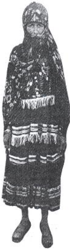
نمونهك ژ جلكين كوردى ل وى دمفهري تدارمكىن دمفهره بجنورد

كوردین فی دمفهري دوركى گهلهك گرنگ ههبو تا بهرى رژيما پههلهوى بيته سهر حوكمى، زمانى كوردى رهواجا خو ههبو دناف تورك و فارسا دا ، لى هه ر ل هاتنا (رزا شاهى) بزاف كرن بو پاش ئيخستن و ژناف برنا زمان و كهلتورى كوردى، بو نموننه جلكين كوردى ل خواندنگهها قهدهغه كرن و زمانى فارسى كره زمانهكى رسمى و ئاخستن ب كوردى قهدهغه كرن و... ههر وهسا ل سهر حوكمى كورى وى (محهمد رزاي) ژى ههر ئه و بيكول دكرن و ئهف بازيين پترى يا وان كورد بزاف كر كو ب هنده مللهتين دى ب گوهوريت و چ پويته پى نهكر ژلايى ئابورى و رهوشهنبيري و ساخلمه ميب قه كو بو ئهگهرا كوچ كرنا گهلهك كوردا و گهلهك ژى چوونه سيستان و بلوشستان و تا