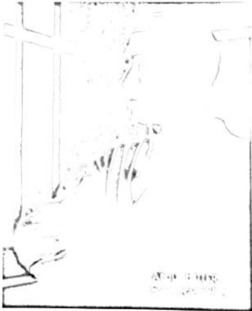
هتەر لەکاتی بێکردنەوهدا

ئیمە داواى دەولەتێكى ناوەند خوازی وەها دەکەین کەتەواوکاری ئەنجامدراوەکانى بسمارک بێت. گرنگی بەهەموو ولات بەدات بەبى زانکردنى چەشنە کلتورێک بەسەر هەموواندا نەمەش لەرێگەى یەكخستنى سوپا و پێدانی ماف بەهاوڵاتیان و ڕینگەدان بە نازادى رادەبەرىن لەبۆ خزمەتکردنى نەتەوێکەیانەوه دەبێت. ئەم چەشنە رامیارى و لەهەرنەمانیا دەکات بەبى هیچ کێشەىەك دەست لەمافى خۆبەریوەبردن هەلبگر و لەچوارچێوەى یەك دەستەلاتى یەکرتوودا یەكبگرەوه.