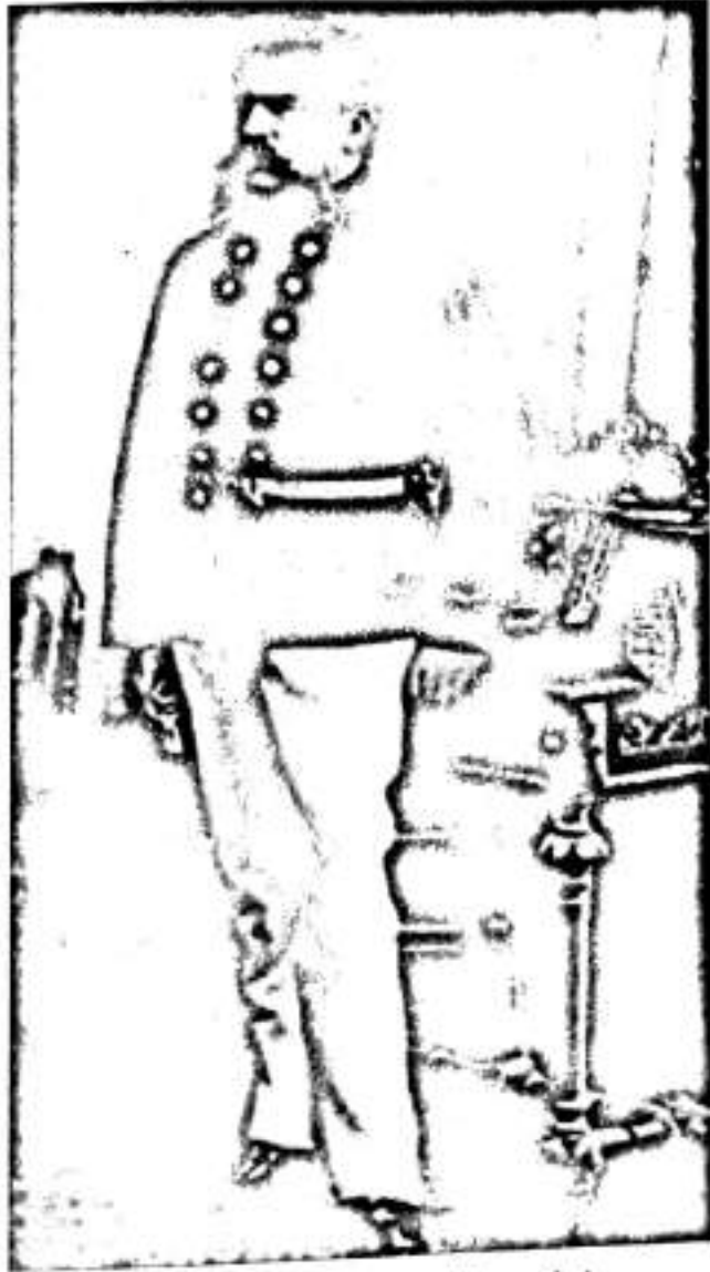
باوكى ھتلەر بەجلكى فەرمیەووە

پلانم بۇ دارشتبوو، من لەسەر بۆچوونەكەى خۆم مامەووە ئەویش لەسەر بۆچوونی خۆى. باوكم لە پەیمانگای هونەر دەریکردم و گنیرامیەووە بۇ خویندنگەى ئاسایی، سەرکەوتن بۆ ئەو بوو، بەلام من ھەرگیز دەستم ھەلنەگرت لەم بەھرەییەم و بگرە برەویشم پیندا و وانەکانى دیکەم پشت گوی خست جگە لە جیۆگرافیا و میژووری سەرچەم بۆچوون و بریارەکانم لەم دوو زانستەووە ھەلقولاون.