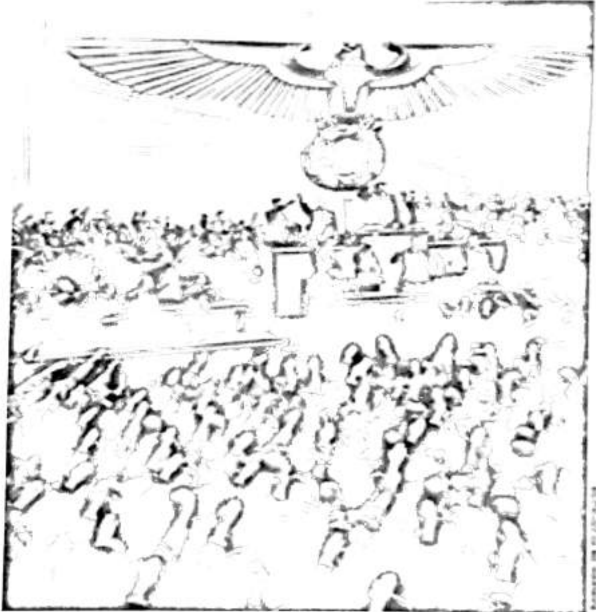
هتەر، لەهۆلى وتارداندا

دەگەرتەو بۆتەو دەى جارنىك گونبىستى ھاوپرېئەكم بوو كەبۇ ھاوپرېئەكى دىكەى قسەى دەكرد و دەىگوت: جارنىكىان بەپۇژ شانۇگەرى (گەلى نازادبوو)ى كردووە جارنىكىش بەشەو، بەلام تام و چىژ و كارىگەرى ئەوەى شەو زۇر لەوەى پۇژ قوتتر و بەهيزتر بوو.