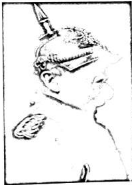
بسمارك، يەكخارەوہی ئەلمانیا

نہم قہشہ له وتہکانیدا باسی له خانہی خاوہن یان مالی پاشا کرد و تینیدا نامارہی بهہموو کار و چاکہکانی بنہمالہی ھوہونزولرن بۇ میرانیا و پروسیا و نیشتمانی نہلمانی بهگشتی کرد. پیاوہ پیرہکہ گریان قوڧگی داگرتبوو. نہمہش وای کرد ھہموو نامادہبوانی نیو ھۆلہکہ بهدویدا لهپرمہی گریان بدہن و دەست بکہن بهشین و واوہیلی. نہودہمہی کہشیشہکہ راڧہی ناچاری نہلمانہکانی دەکرد لهبۇ چہک دانان پینی راگہیانندنین کہ ولاتہکہمان، نہلمانیا، لهجہنگدا دۇڧرا، نیستاش لہژنر سیبہری بهزہیی دوژمنی سہرکہوتومانداين و دەبیئت بهہموو رینککہوتنیک قایل بین کہ نہوان پیشکہشمانی دہکن و دەبیئت به دەستبلأوی دابننن، نہوکاتہی قہشہکہ بہم ناستی قسہکردنہ گہیشت نہم جہانہم لهپیش چاو بووہ تاریکستان و گویم ہیچی نہدہبیست و چاوہکانیشم چتینکی نہدہبینی، وەکو سہرخۆش ھۆلہکہم بهجی ھنشت و بہرہو نوینہکہم بہرینکہوتم، سہری گڧگرتووم خستہژنر بالیفہکہمہوہو نہم دەویست بڧروا بہم راستیہ تالہ بینم.