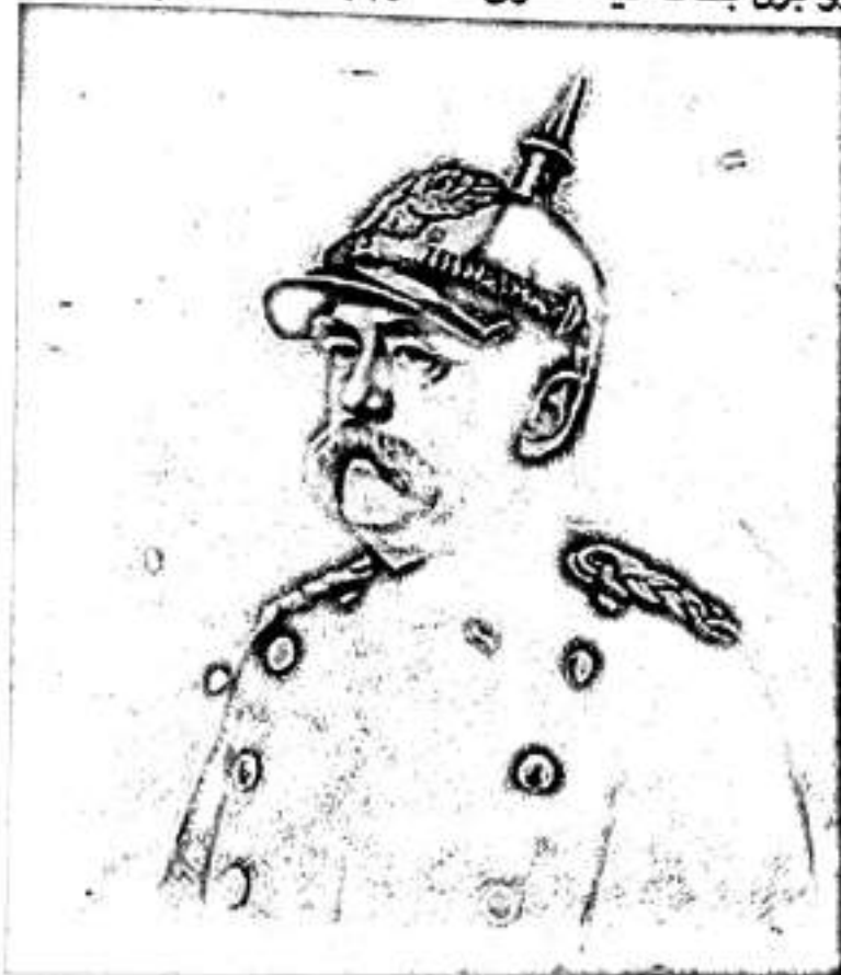
بسمارك، سەركردهى دەست ئاسنن

بسمارك زور به توندى دژى ماركس خوازەكان وەستايەو، بەلام ئەنجامەكەى پووچ بوو؟ چونكە بېرواى تەواوى بەكارەكەى خوى نەبوو، ياخوود بەمانايەكى دى تەنھا مەبەستى لاوازكردننەيان بوو، نەوەك قېركردنى تەواويان، بۆيە لەئەنجامدا بەناچارى بسمارك پەناى بە بورجوازيەتى ديمۆكراتى گرت، بەلام ئەو كاتەى سۆسياليسىتە توندەپرەوەكان هيزيان پەيداكرد ئەو كات بەرەو ماركسيەت پوويان وەرچەرخا. ئەمەش وەكو ئەو وەها بوو بزن بكنە ئيشكگرى كەلەرم بەمەبەستى پاراستنى.