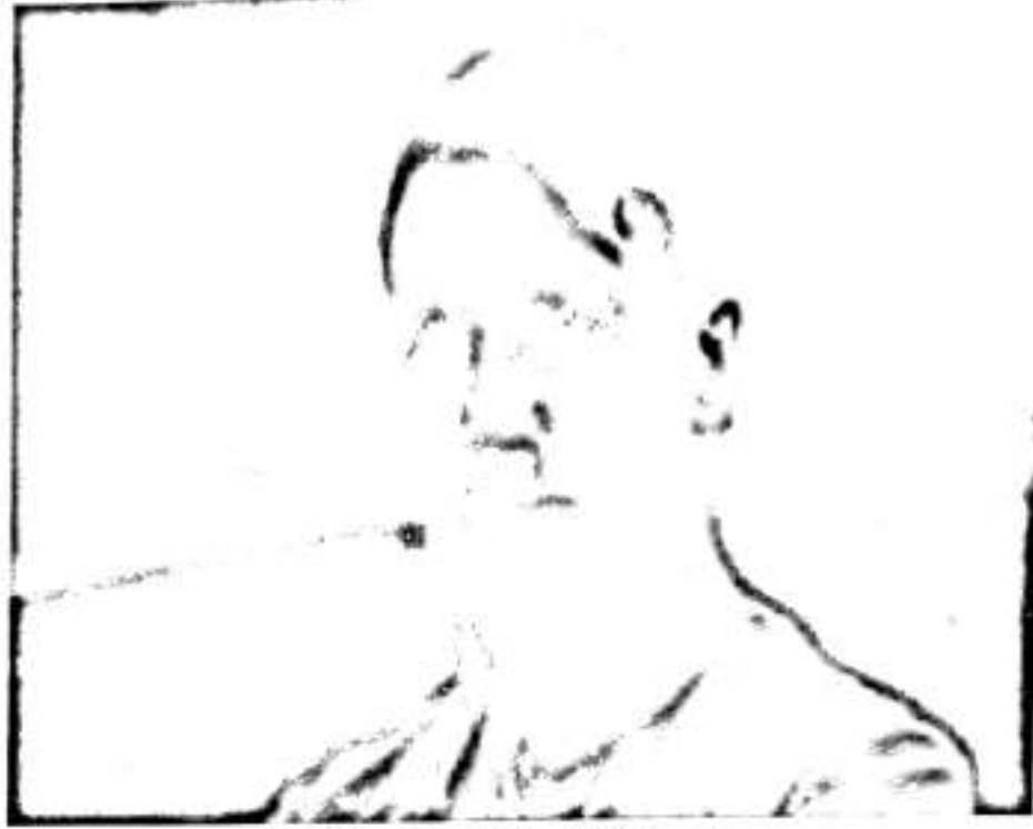
ھتلەر لەكاتى تىڭكرىنى ئالۇزدا

خۇكشانەوہ دەست ھەلگرتن لە ئەنجامدانى كارىك باشتر نىيە لەشكست بەھۆى نەبوونى كەسانى شياوہوہ ؟