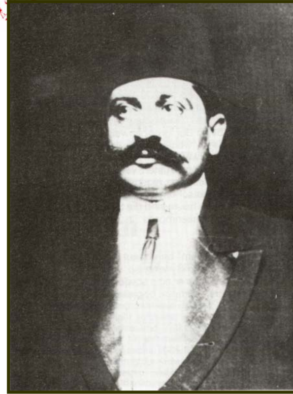
الضحية : طلعت باشا