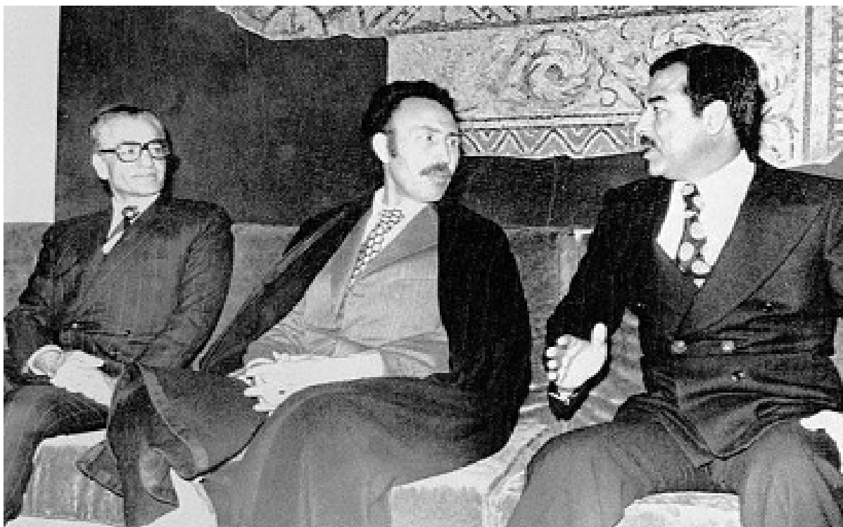
پەیماننامەى جەزایر ریکەوتى (6)ى مارچى 1975 کە بەھۆیەو ھەوێشە شۆرشى گەورەى ئەیلوول ھەرەسى پێھینرا!

شەروشۆرى بەردەوام لەنیوان ھیزەکانى حکومەتى عێراق و ھیزی پێشمەرگەى کوردستان و، پشتیوانیی لۆجستیکى رژيمى شا لە شۆرشى کورد، رژيمى بەعسى عێراقى ناچارکرد، بەنھینى بکەویتە دانوستانى سیاسى لەگەل رژيمى ئێران و، دواى چەند دیدارىکى نھینى کە سئ مانگى خایاند، سەرەنجام ھەردوو رژيمى ئێران و عێراق لەولاتی جەزایر، بەنۆبەژىوانى سەرۆکى ئوکاتى جەزایر بەناوى ھوارى بومدین، لەرۆژى 6ى مارچى 1975 بەرامبەر بە 15ى رەشەممەى 1353ى ھەتاویى، پەیماننامەيەکیان مۆرکرد کە بریتىبوو لە (7) مادە و (5) تیبينى. ھەر لەوسالەدا ریککەوتننامەکە بەشيوەى ھەرمى بەناوى گریبەستەکانى نیوان عێراق و ئێران