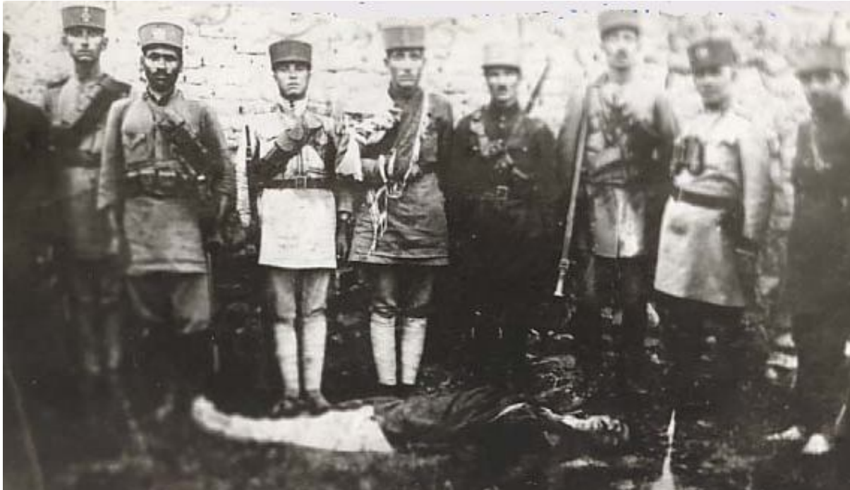
ھىزەكانى رژیى رەزاشا، دوای گوللەبارانکردنى سەركردەى نەتەوہىيى سەكۆى شكاک، وینەى یادگارىيى دەگرن

(شۆرشى نوڭخوۋازى)، كە بەخوڭنى ھەزاران ئازادىخوۋاز بەدەستەيىنرابوون، زىندانەكان پىكران لە ئازادىخوۋازان و رۆژنامەنووسان و، ھەرچىيەك رۆژنامەى سەربەخۆ ھەبوون، داخران. ترس و شەوہزەنگ، جىي سالاڭى ئازاد و دىمۆكراتى سەردەمى ھەوتسالەى شۆرشى نوڭخوۋازىيان گرتەوہ.