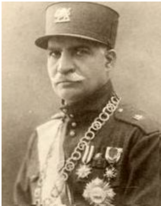
ره‌زاشا دامه‌زیننه‌ری رژیمی په‌هله‌وی

ئەم حەشاماتە زۆرە کاتیک گەرانەوہ بۆ ئێران، ئەو بیروبواوەرپە نوێیە وافی فیری ببوون، بۆ خەلکی شاروگەند و زیدی خویان گێراپەوہ. کاتیکیش یەکەمین ریکخراوەی کۆمۆنیستی بەناوی "حیزی کۆمۆنیستی ئێران" لەمانگی جۆزەردانی سالی 1299ی هەتاوی بەرامبەر بە مانگی جۆنی 1920ی زانیی، لەپاریژگە گیلان کە هاوسنورە لەگەڵ یەکییتی سوڤیت، لەلایەن کەسایەتی سیاسی و رۆشنییری ئەو سەردەمە ئێران بەنیوی حەیدەر عەموونوڤلی یەوہ دامەزیندرا، ئەکادیمیەکی ناوداری وەک دۆکتۆر تەقی ئەرانی بوو بە ئەندامی حیزیەکە، ئەم حیزیە توانی لەماوەیەکی کەمدا لەنیو کۆرپوکۆمەلە رۆشنییری و کریکاری لەئێراندا بەخیری گی شەبکات.