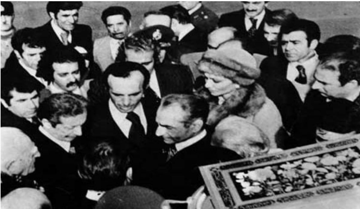
حه مه ره زاشا له کاتی مانئاوایی له هاوڕێیان و، کاربه ده ستانی رژێمه که ی، بۆ هه میشه ئێران به جیده هیئت

مانگی رێبه ندان، خۆپیشاندان له سه ر شه قام و جاده کانه وه، گوێزایه وه بۆ ته قه و لیکدانی چه کداری و هێرشبردن بۆ سه ربازگه و بنکه کانی پۆلیس و ژاندارم و مالی ئه ندامانی ساواک و دایره کانی ساواک و،