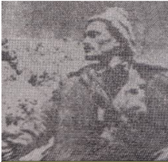
شاعیر و نیشتمانیپەرۆر ھەلا ناوارە

سەر شۆرشگێڕان و جەماوەری کورد لە رۆژھەڵات دانەنێ و، ھەستی ھاوخەباتی و ھاوچارەنووسی لەنیوان کوردی رۆژھەڵات و باشووردا پێک نەیت! لەبەر ئەوە سێ بەندی ریککەوتننامەکە، جەخت لەسەر ئەوە دەکات کە بزوتنەوێ گەلی کورد لە کوردستانی ئێران، بەشیکە لە بزوتنەوێ سەرتاسەری گەلانی ئێران!