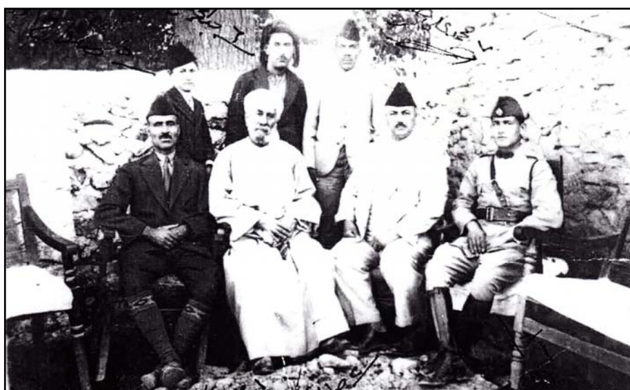
دانشتووه‌کان نه‌راسته‌وه: دووهم سالیح زه‌کی صاحب قران قائم‌قامی قه‌زای کویه، مه‌لای گه‌وره