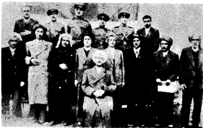
Pişewa Qazi Muhammed bı hınek Serokwezirên Komara Kurdistan re.