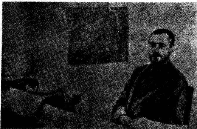
Qazi Muhammed, dı İlon a sala 1946 an de, dı meqamê xwe ya Serokomariyê de