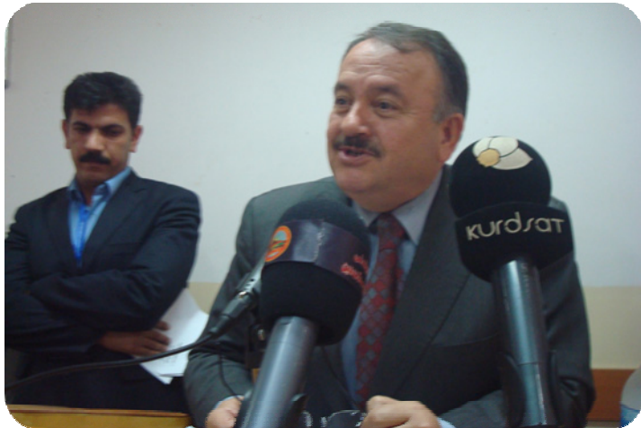
دکتور ته حمه د دزه بی له کاتی ووتارخویندنه وه به یاوه ری ئاراس ئیلنجاغی پیشکه شکاری برگه کانی مه راسیمه که