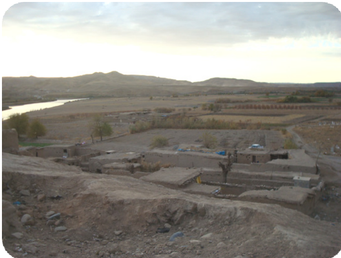
له سه ر شوینیه واری گردی ساتوقه لاهه خۆزئاوای گرده که گیراوه