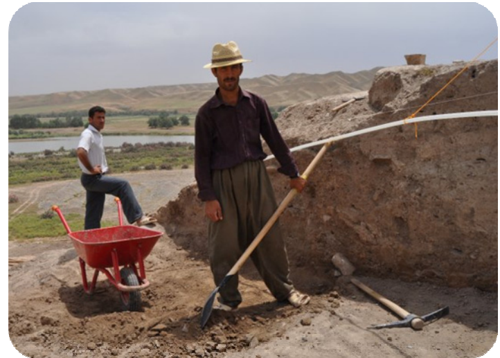
کریکاریکی گوندی ساتوقه لاهه کاتی کاردن له یه کینک له چاله کانی کنه وپشکنین