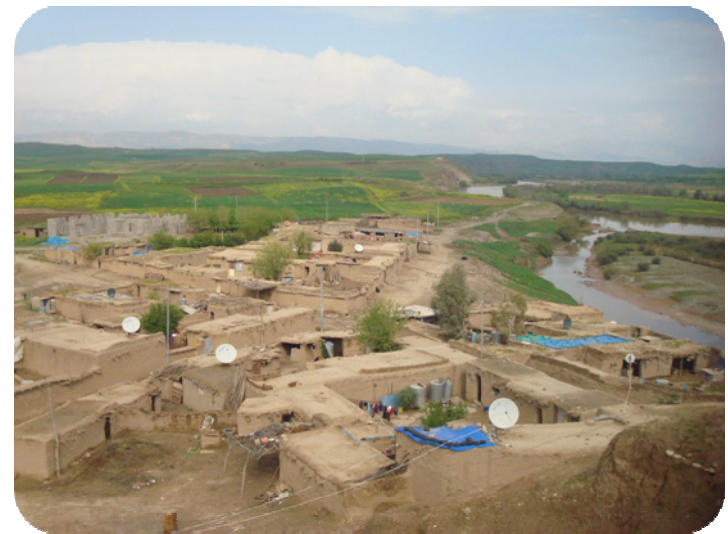
لە رۆژی ۳-۵-۲۰۱۰ گوندی ساتوقەلا لەسەر قەلاکەوێ گێراوە