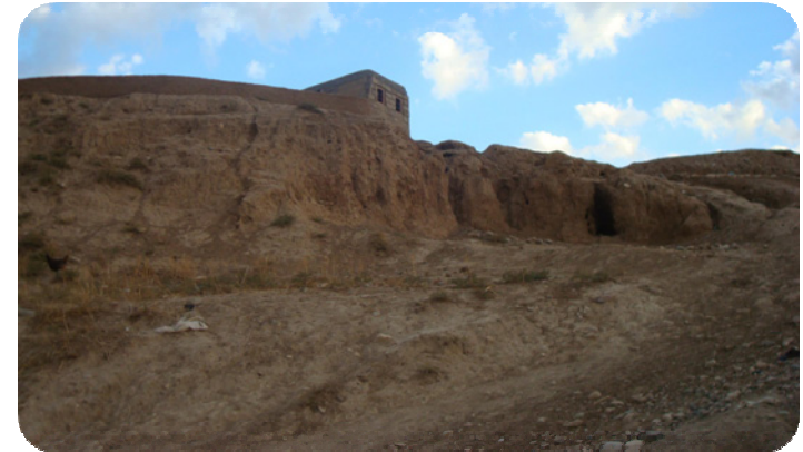
شوینه واری گردی ساتوقه لاهه، لاپالی رۆژتاواییه تی که دوو چاری پامالپان هاتووه