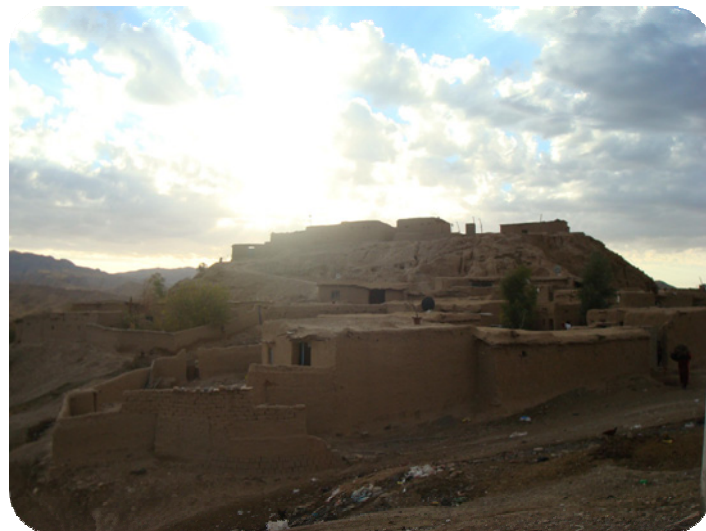
گردی شوینه واری ساتوقه لاهه، له باکوریه وه گیراه