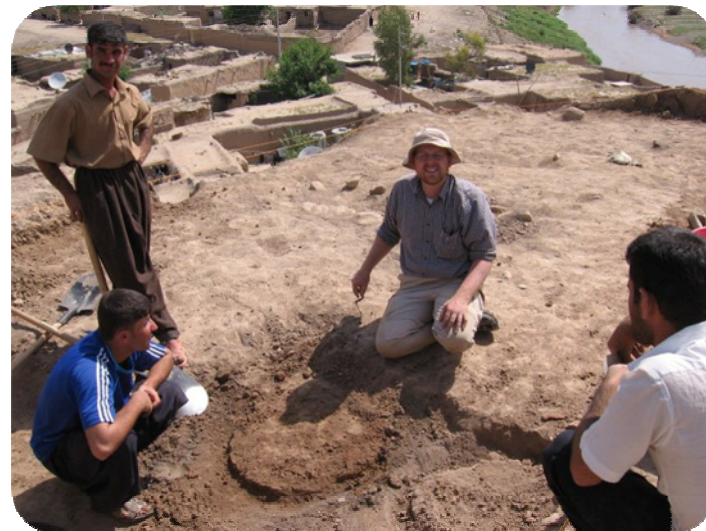
كنه وپشكنين له سەر قەلا كە