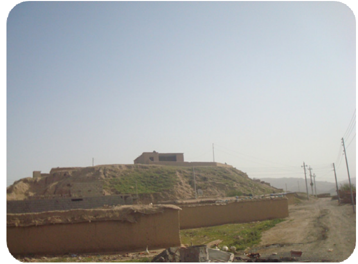
مزگهوتی ساتوقه لاهه، كهوتوته سهه گرده شوینه واری ساتوقه لاهه