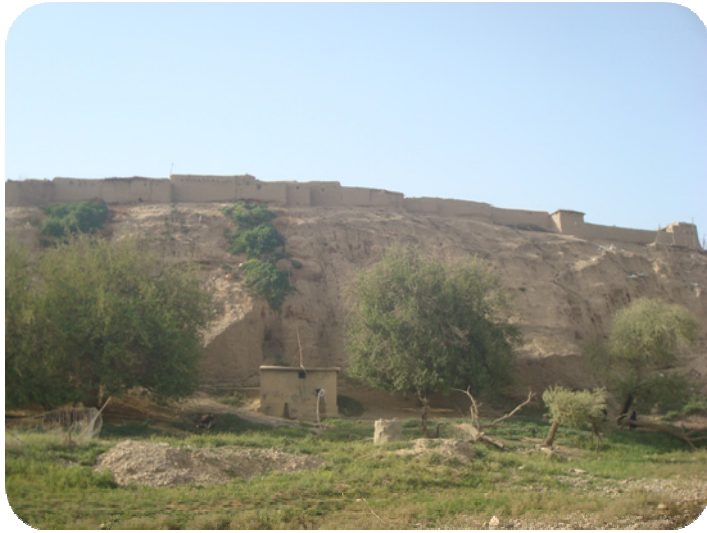
له که ناری رووباره که وه شوینه واری گردی ساتوقه لاهه گپراهه