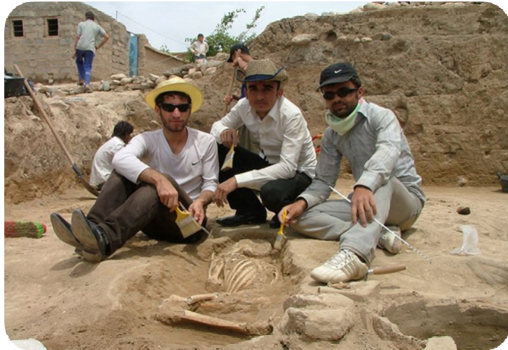
له کاتی کنه وپشکنیندا ئه و کریکارانه رووفاتیکی مروفا ده دۆزنه وه له سه ر قه لاکه