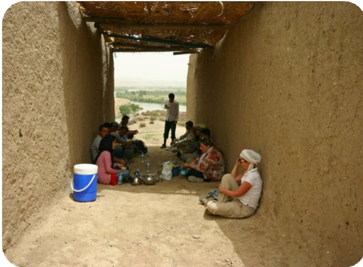
پشوى تيمه كه و كاتى خواردنه وهى چايه