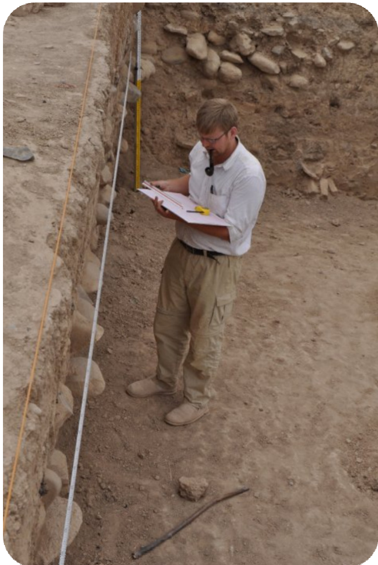
خاليكى كنه وپشكنين كه تييدا چەندىن چىنى نىشتهنى دەر كه وتوه