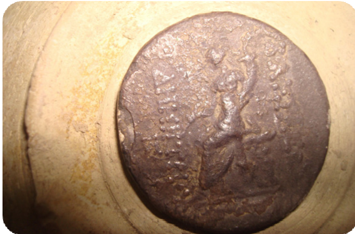
دراویکی دزراوهی شوینه واری ساتوقه لاهه، که له ورووه پیدا وینهی ژنیکه به تپروکه وانه وه