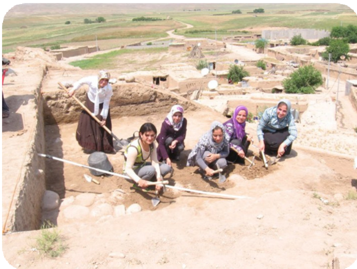
کچە خویندکارانی بەشی شوینەوار لە کاتی کەنەویشکنین