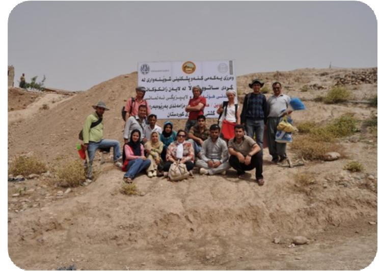
لە كاتى دەست لە كارھە لىگرتنى تىمە كە لە كارى رۆژانە لە لاپالى گردى ساتوقە لاھەرەن