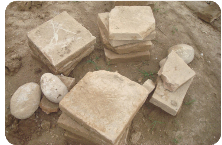
وینهی خشته له قوردروستکراوه کانی شوینیه واری ساتوقه لاهه، که له پارچه زهوی (جوجه ره) به دووری ۵۰۰مه تر له سه روی خۆزه لاتی ساتوقه لاهه دۆزراوه ته وه