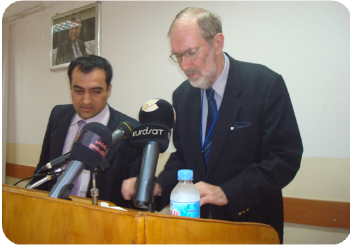
بروفیسور قان سۆلد له کاتی ووتارخویندنه وه به یاوه ری ماموستا کۆزاد له مه راسیمی راگه یاندنی یه که م وه رزی کنه وپشکنینی ساتوقه لا له هوئی شه هید عه بدولره زاق له ته قته ق