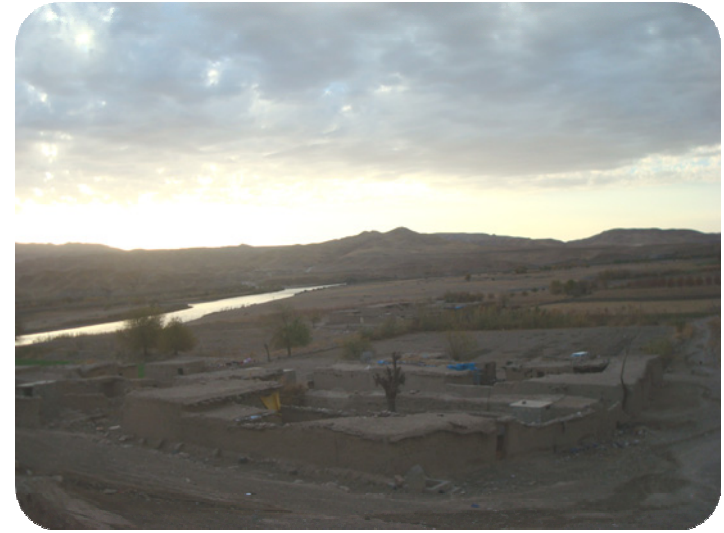
له سهه شوینه واری گردی ساتوقه لاهه خوژئاوای گرده که گیراه