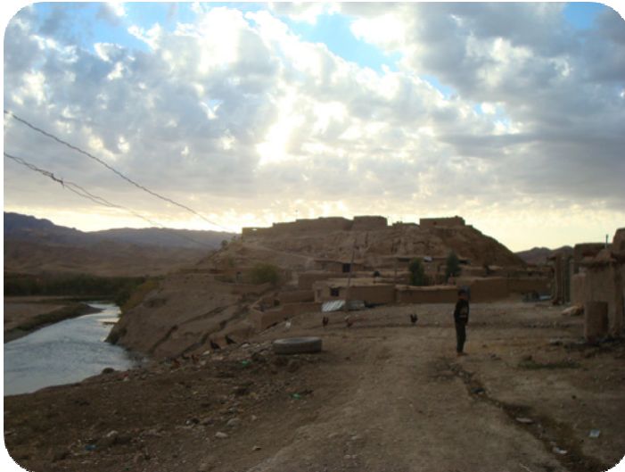
شوینه واری ساتوقه لاهه، له باکوری گونده که وه گپراوه