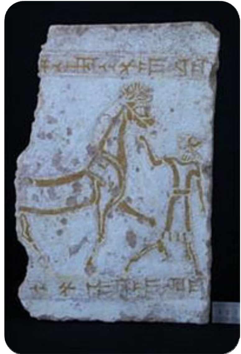
وینهی دول دل له کاتی کنه ویشکنین دۆزراوه ته وه