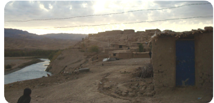
دیمەنیکی ساتوقە لاھەباکورییەوہ گیاروہ