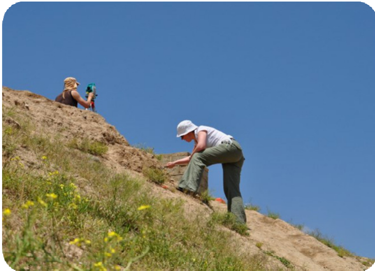
پسپوزانی تیمه که له کاتی کنه وپشکنیندا