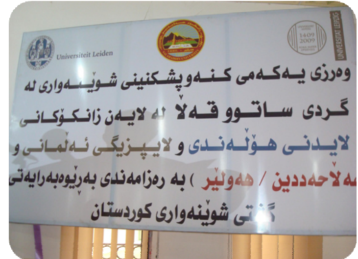
لافیته ی مه راسیمه ی كنه و پشكنینه كه له هو ئی شه هید عه بدول ره زاق