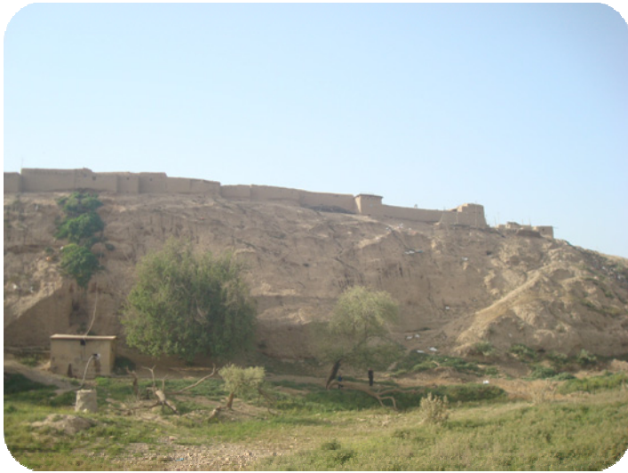
له پوژه لاتتی شوینه واری ساتوقه لاهه گپراهه