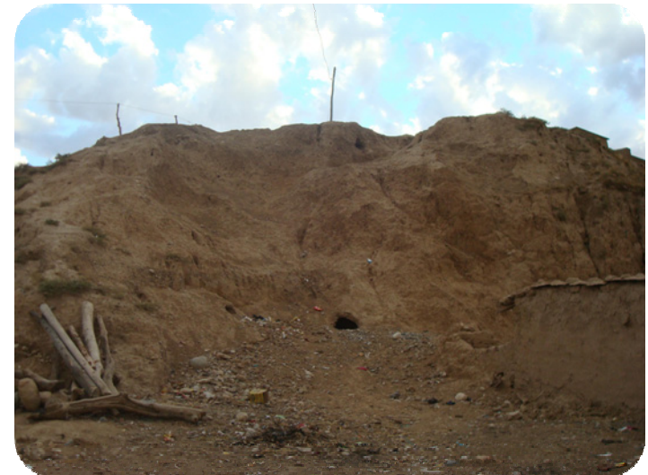
لاپالی سه رووی قه لاکه که دوو چاری پامالپان و بردنی خاکه که ی بووه له لایهن گوند نشینانی ساتوقه لاهه دوی راپه رینی ۱۹۹۱ و تاوه دانکردنه وهی گونده که