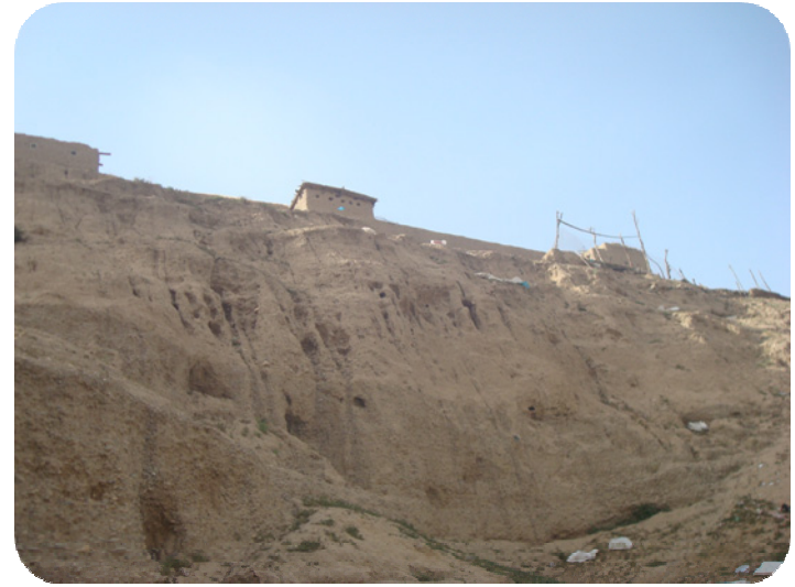
پوژه لاتتی گردی ساتوقه لاهه، رامالان چون کاریگه ری خوی به سه رجی هیش تووه