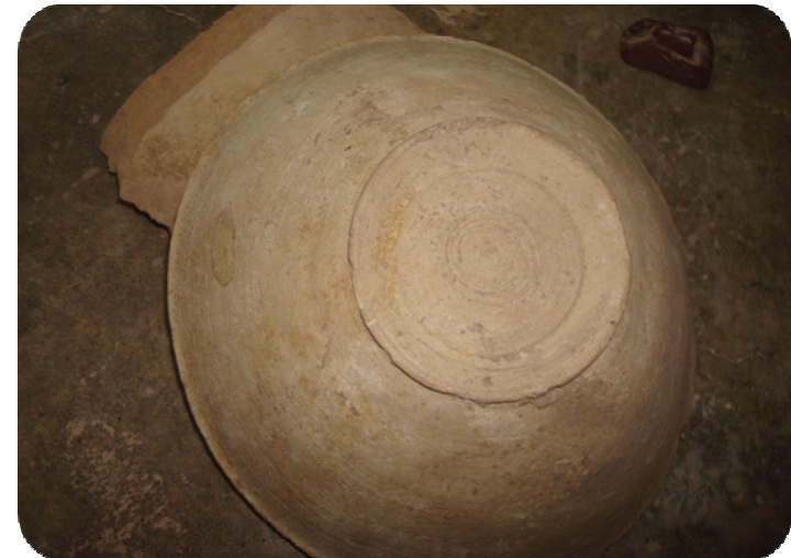
قاپیکی له قور دروستکرای دزراوهی شوینه واری ساتوقه لاهه یه کیک له ماله کانی تهو گونده پاریزراو بوو