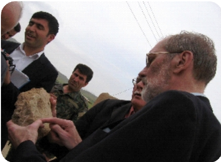
پروفيسور فان سولڊ تاماژه به نوسينى ميئخى سه ر پارچه دۆزراه كه دهدات