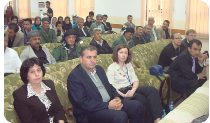
ته م وینه یه له مه راسیمی راگه یاندنی قوتاغی یه که می کنه وپشکنینی گردی ساتوقه لا له هوئی شه هید عه بدولره زاق له شاروچکه ی ته قته ق له ۳-۵-۲۰۱۰ گه راوه له ریزی پشه وه ماموستا کۆزاد و دکتور جینی زیا و ماموستا نه روۆز لیپرسرای شوینه واری کوپه