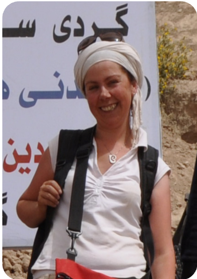
دکتوره جینیزیا پاپی به خه نده وه وینه یه کی له ته نیش تابلوی کنه ویشکنینه که وه له گوندی ساتوقه لا گپراوه