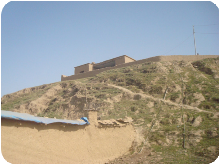
دیواری قوری هاوالتیان چوه به ناره لاکه وه