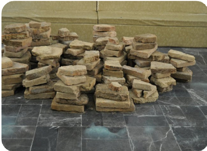
ئەۋ خىشتە بىنراۋ و دۆزراوانە ئەنجامى كەنەپىشكىنە لە مىواخانە تەقتەق وپنەيان گېراۋە