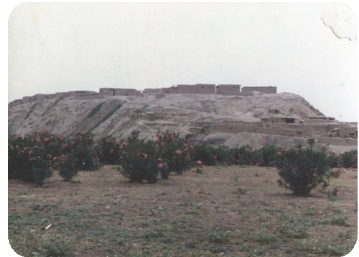
له سالی ۱۹۹۳هه له که ناری زیی بچوکه وه گردی ساتوقه لاهه گیراه