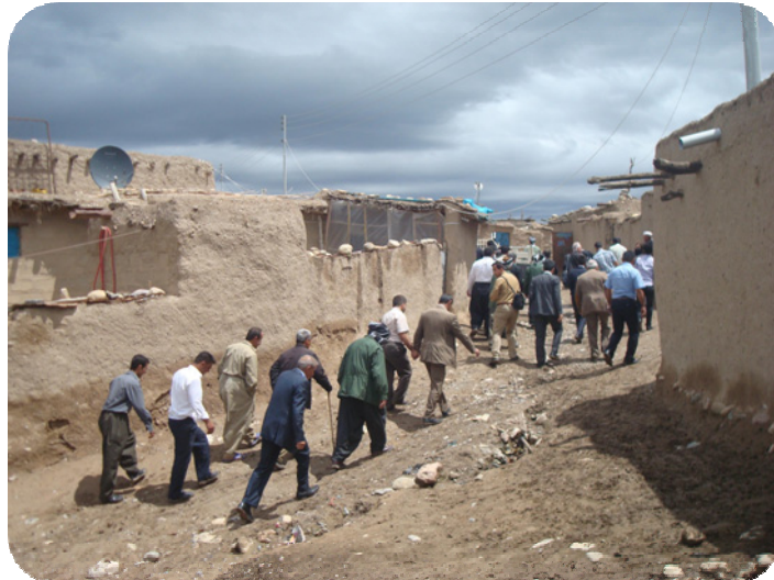
دوای مه راسیمه كه ی ته قته ق هه مان رۆژ ۳-۵-۲۰۱۰ سهر دانی كردن بو شوینه واری گردی ساتوقه لا