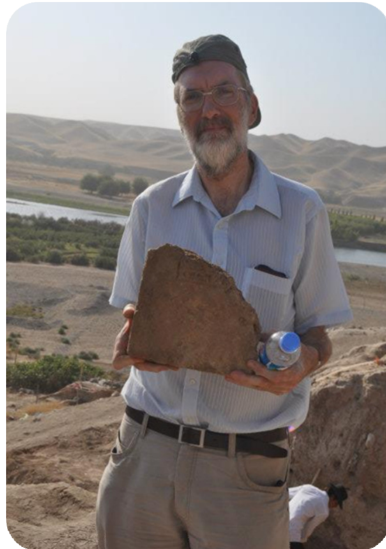
پروفیسور فان سولڈ سه روکی تیمه که وینه ی له گه ل خشتیکی به ره می کنه ویشکنین گرتووه که نویسی میخی له سه ره به شیکی که می پارچه خشته که ماوه