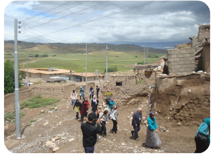
خویند کاروقوتاییانی بەشی شوینەوار دوای مەراسیمە کە سەردانی گەردی ساتوقەلا