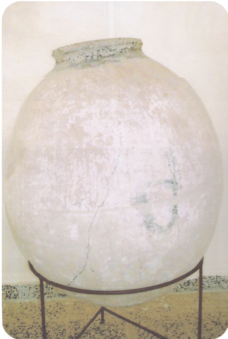
گۆزه یه کی دۆزراوه ی ساتوقه لآ ئیستا له موزه خانه ی هه ولییره، له ماموستا (نیازعه زیز ئومه ر) وه رگپراوه.