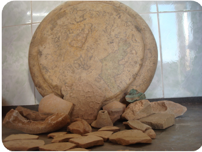
پاشماوهی کهل وپه لی له بهرد دروستکراو که له گوندی باغه جنیتر دۆزراوه ته وه