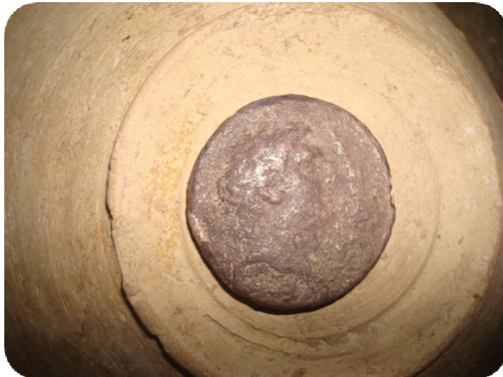
دراویکی دزراوهی شوینه واری ساتوقه لاهه، که له ورووه پیدا وینهی سه ری مروژیکه