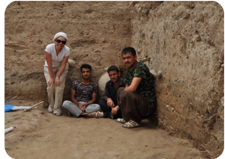
دكتورە جينيزيا و زانا سه باح جه وههر و دوو كرئكار له ويته يه كى يادگاريدا