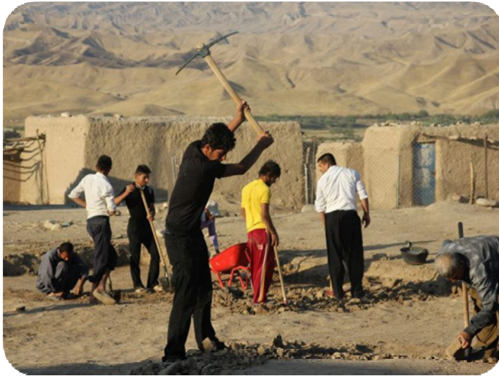
کریکاران لە کاتی وەشانندی یە کەم قازمە ی کەنەویشکنین لەسەر قەلاکە