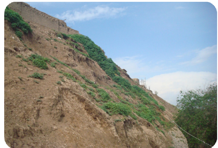
لاپالی خۆزه لاتی شوینیه واری ساتوقه لاهه، به لای که ناری رووباری زبی بچوکه وه