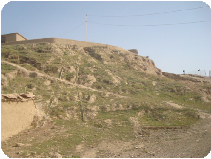
لاپالی ساتوقه لاهه لای خورتاوا قه لاکه