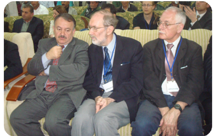
له هه مان روۆژ و مه راسیمدا بروفیسور قان سۆلد سه روکی تیمه که و دکتور ته حمه د دزه بی سه روکی زانکوپی سه لاهه دین