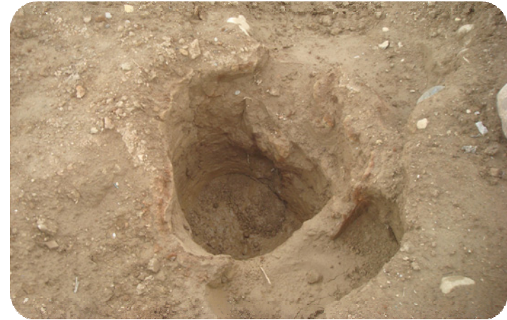
وینهی گوژیک که رووفاته کهی خراوته نیو گوژیه کهوه، که ئیسک وپوسکی تیداد و زراوتهوه له پارچه زهوی (جوجه ره) به دوری ۵۰۰ متر له سه روی گردی ساتوقه لاهه