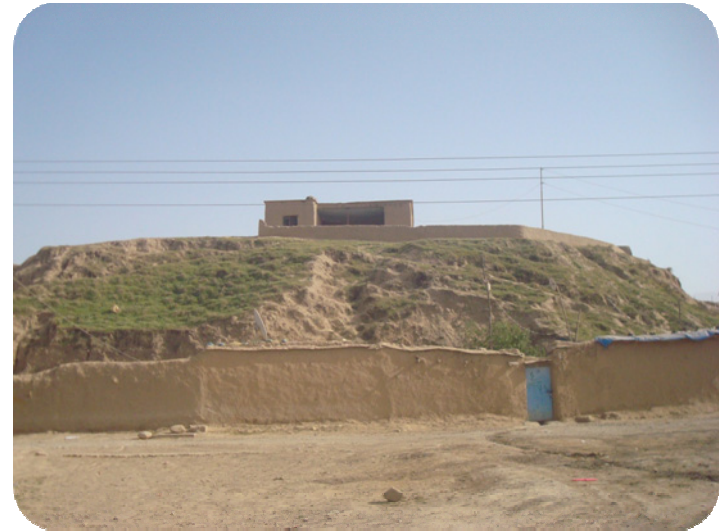
له دوای راپه رینی ۱۹۹۱ خه لکی ساتوقه لاهه، له دامین ولایالی قه لاکه خانویان دروست کردوته وه