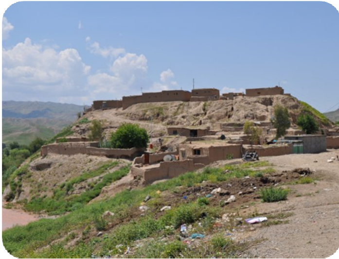
قه لای ساتوقه لاهه، له باکوریه وه گیراوه