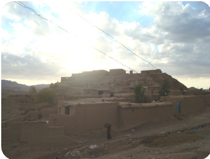
دیعه نیکی گوندی ساتوقه لاهه