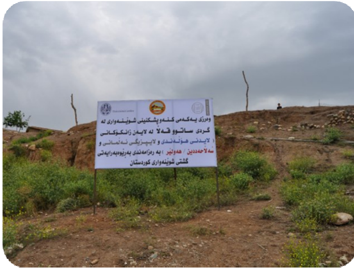
له وحه ی كنه و پشكنینه كه له لایالی گردی ساتوقه لا