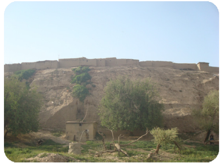
له که ناری رووباره که وه شوینه واری گردی ساتوقه لاهه گپراهه