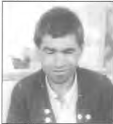
بهروز که شیت

گیرفانه کانی خۆی هه‌لی ده‌گرت، نه‌گه‌ر زیادیش بوايه له‌ناو جوړکه‌کی داده‌نا و به‌یانیان نه‌و گوشت و خوارده‌مه‌نییه‌ی به‌سه‌ر پشيله و سه‌گی گۆرستانه‌کانی هه‌ولیتیر به‌یه‌کسانی دابه‌ش ده‌کرد، له‌ گۆرستانی ئیمام محمه‌د، له‌ گۆرستانی گه‌وره، گۆرستانی چراغ، خۆشیه‌که‌شی له‌وه‌دابوو، هه‌ر سه‌گ و پشيله‌به‌ک ناوه‌کی تایبه‌تی هه‌بوو، نه‌م گیانله‌به‌رانه، به‌ریتزه‌وه به‌رامبه‌ری وه‌رده‌که‌وتن، تاوه‌کو هه‌ریه‌که‌وه به‌شه‌ نازوقه‌ی خۆی وه‌رده‌گرت، زۆرجار وارێک ده‌که‌وت، پشيله‌به‌ک که به‌شه‌ نازووقه‌ی خۆی وه‌رگرتبوو، دووباره‌ ده‌هاته به‌رامبه‌ری له‌لای خۆیه‌وه هه‌ستی پێ ده‌کرد.