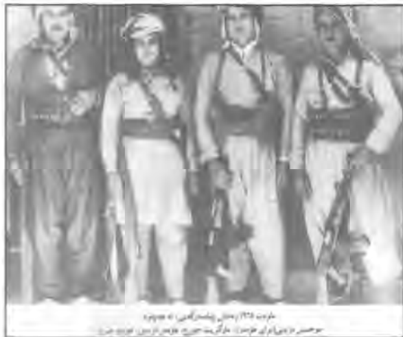
خولاسە كە دەلتىن چەند ھەيرانىتكمان بۆ بىلتى ئەو دەيارە مەبەستى لە چەند بەندە ھەيرانىتكمى بەكار دى، جا لەويدا مەبەستى يان كۆرە يان كچە. ھەر چۆنىتكمى يىن لەوانە يە ھەيران لە سەردەمىتكمى زۆر زووتردا ناوتكمى كوردى ھەبووبى لەباتى ئەم ناو ەەرەبىيە، بەلام تا ئىستا ھىچ بەلگە يەكى مېژووبى بەدەستەو ەبىيە، كە ناوتكمى دىكەى ھەبوو. لىردا بۆ دلدانەو ى گوتگر و ھى خۆشەم ەزەدەكەم ئەو ەشى بەخەمە سەر كە ھەيران تاكە ناوازی كوردى نىيە لىقەوما يىن و ناوى خۆى لەبىر چووبىتەو. لەبىر مە جارەن و ەشى گۆرانى ھىستا ئەو ەندە باو نەبوو باب و باپىرانمان لەباتى گۆرانى و ەشى شرقى و مقامىان بەكار دەھىتا كە ھەردووكمىان ەردەبىن، بەلام يەكەمىان زىاتر لە زەمانى عوسمانلى بەكار دەھات. لەپاشان و ەشى شىعر و شاعىر، تا ئەم دوايە كە و ەشى كوردى ھۆنراو ە و ەلەبەست پەيدا بوون خۆ پىشتىرئ ھەر شىعر و شاعىر بەكار دەھاتن. راستە و ەشى ەلەبەست لە كۆندا ھەر ھەبوو ەك كە دەلتىن بەندىتكم بۆ ەلەبەستەم، بەلام ھۆنراو كە لە ھۆناندەو ە ھاتوو ە مەيان جارەن تەنيا بۆ پرچى ژنان و ھۆناندەو ى موو و بەن و شتى وا بەكار دەھات نەك بۆ شىعر. بەلام نەبوونى و ەبەكى رەسەنى كوردى كۆن بۆ شىعر. يان بۆ گۆرانى يان ھەيران ئەو ناگە يەتكم د شىعر و گۆرانى و ھەيران لە كۆنەو ە لە كوردىدا نەبوون. بەلتى ھەبوون بەلام ديارە ناو ە كوردىيەكانىان گوم بوون. ئەمەش ھەر بەسەر كورددا نەھاتوو ە بگرە فارس كە جوانترىن شىعرى كۆنىان ھەبە كەچى و ە فارسيەكەيان بۆ شىعر و شاعىر نەماو ە و ھەر ەردەبىيەكەى بەكار دىن. بەھەر حال، كە ناوى ھەيرانى كوردى رەسەنىش نەبى خۆ ناو ەرۆكەكەى سەت جار كوردىيە.

سوارچاك و راوكەر و نىشان شكتىن و شايكەرتكمى زۆر لىھاتووش بوو. ھوسىتى عەلياغاي سەت ھەزار مخابن تەمەنى ھىشتا لە (۵۲-۵۳) سالاندا بوو، كە لە سالى (۱۹۷۲) سەرى نايەو ە.