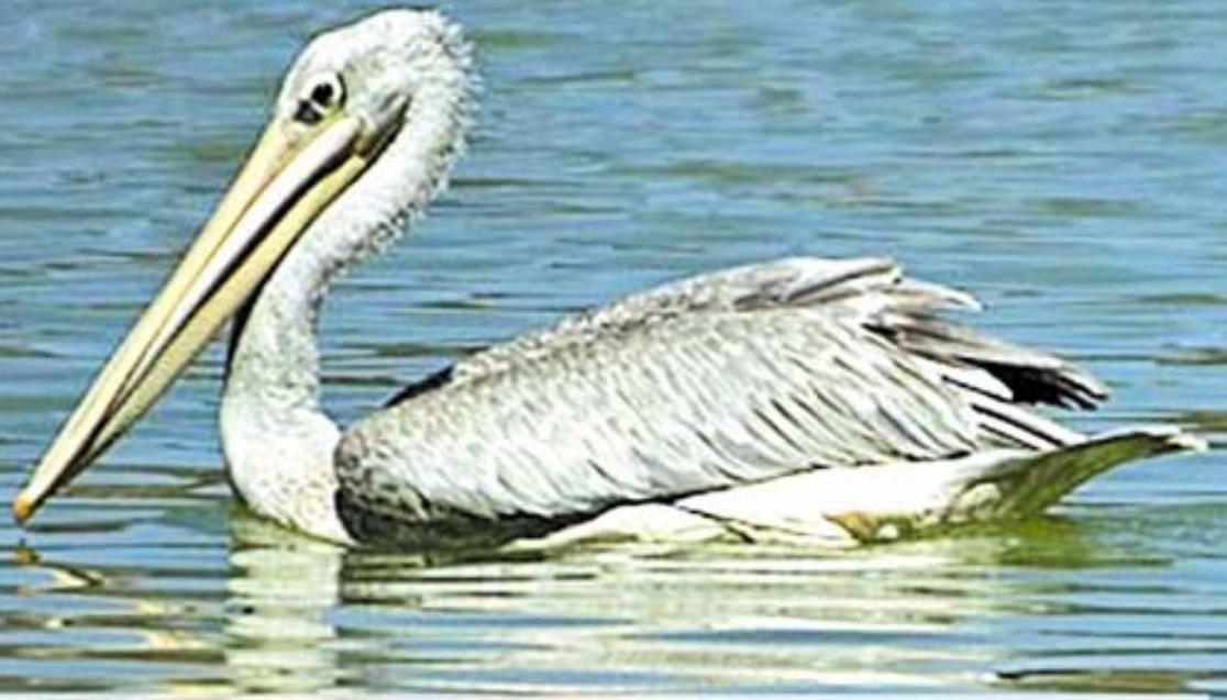
كھرافي ( يئ سپي ) ( س ) كھلڪھسپي، سھفاقوش ( ع ) البجع الابيض Pelecanus onocrotalus ( L )

( ۱۷۵۱-۱۷۵۰ ) سم دريژھ . بارا پتر سپييه ، نكلي وي دريژ و زهر و پانه توورهكي چهرميني زهر ب بن نكلي ويقهيه ، كوفيكهكا بيخير هيه ، سنگي وي پنييهكا زمرا پيتي لييه ، سهرچھنگ و سهرچھنگھشيئر رھشن ، كوري تامخره . پي ب پھردھنه ، دھمي ريفھچونئي شھدھهژت و دھرھنگ دھفرت ( قھدھرھكي ب پييان دھت ژ نوو دھفرت ) . بالندھيهكي مشھخته ، زفستانان دئييت ، د نابقھرا تھباخ و نيسانيدھ دئيته ديتن ، د گولين نافيده و ل سھر رؤباران دژيت ، هيلينا خوه ل سھر داران و د گھرانده چي دكت و ژ ( ۲.۲ ) هيكان دكت و هيكين وي سپينه . خوارنا وي ماسينه .