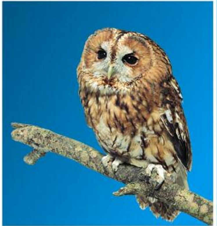
( ۵ ) گویین؛ تهیرکی ریلان؛ گوهین؛ گویینا ریلان (س) کونده زیوه (ع) الخبل؛ بومه سمراء Strix aluco (L)

۳۶ - ۴۰ سم درېزه. کونده کی که لواش ناقنجییه، سه ری وی مه زن وخر و بی شاخکه. چاقین وی رهش، چهنگ پان وخرکن. کونده کی هله و و پته. ژ ملی پشتیغه بنده هییه کی پنیینی و گیخداره ب گیخین هه واییین تاری. هنده ک پنییین سپی ل ملان و چهنگفه شیرانه. کورسی دیمی هه واییه کی ب سهر رساسیغه یه، هنده ک گیخین رهشین هوورک لی وهرهاتینه. شابه پان گیخ و تیشاریزین سپی و هه واییی لینه. کوری گیخداره ب گیخین هه واییین پان. ژ بنیغه گه وره کی ب سهر هه واییه کی هه کریغه یه، گیخ و راقین پانین پی تییین هه واییی و هه کری لینه. سپیلکا چاقان رهه کی ب سهر شینیغه یه و خولیقک هه وایینه. نکل زهره کی ب سهر که سکیغه یه. ل ناف دارستان و ریله وارن (ل نهدی نزار) هه یه و ب روژ خوه د ناف چه قانره هه دشیرت، و ب شهف پشتی روژنا قابوونی ده می دنیا دگیولت دهرده گهفت و دهست ب خواندن دکت. خوارنا وی مشک و جورده و بالنده و میس و مؤر وکیزکن و هنده ک جارن ماسی و بهقان زی دگرت. ل دهف مه زفستانان هه یه. ل روژنافا و ژیرییا روژنافا یا شیرانی تیژکان دنینه دهری.