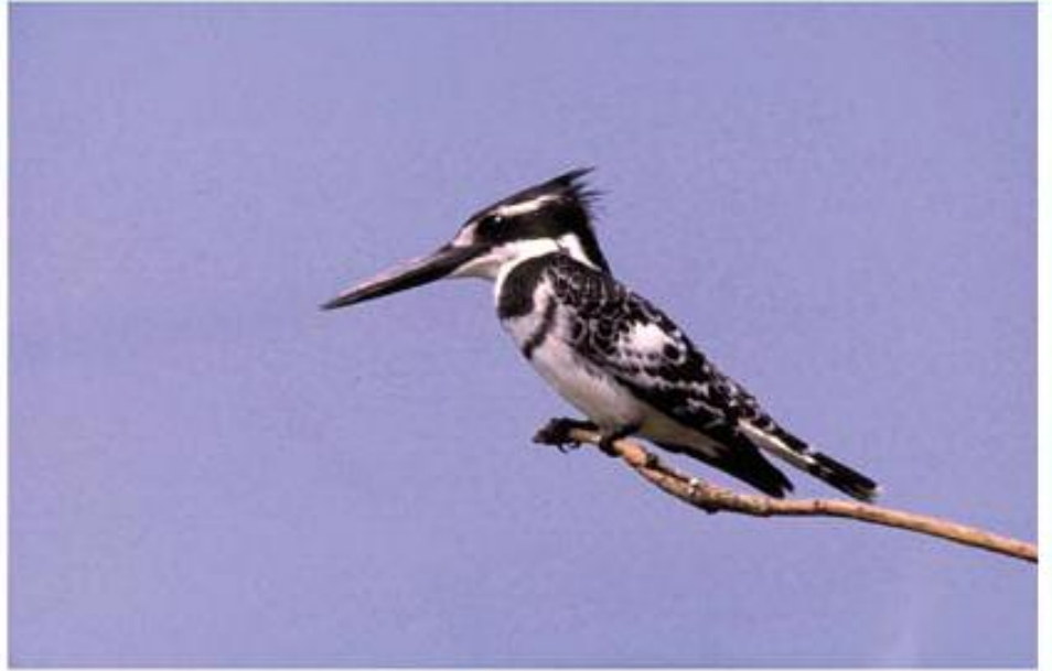
( ۲ ) ماسیخوهری بهلهك (س) قوله شینهی بهلهك (ع) السماك الابقع Ceryle rudis (L)