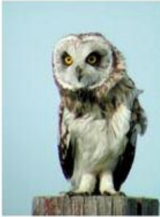
( ۷ ) كوندى گۆران (س) كوندەقوتە (ع) البومة الصمعاء Asio flammeus (L)