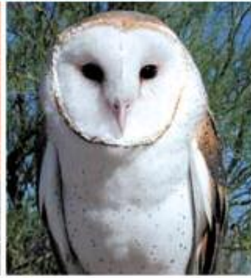
(۱) کوندی سپی