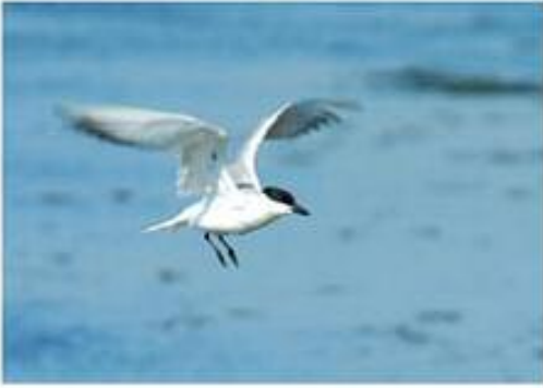
(۵) مهقه سوکا دهریاییا نکل شهنگ (س) ماسیخورکهی دهنووک نهستور (ع) خطاف البحر نورسي المنقار Gelochelidon nilotica (L)