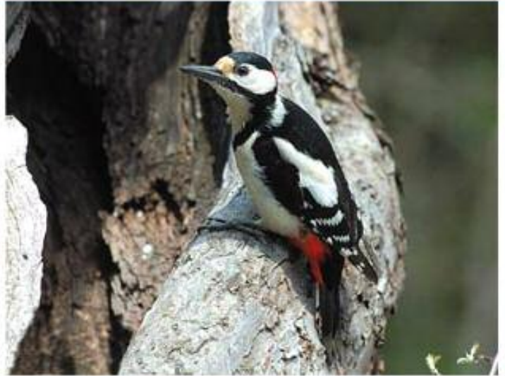
( ۲ ) دارکۆکهیی نافتهنگ پنی پنی (س) دارسمه ی خالخالی نیونجی (ع) نقار الخشب المرقط الوسط Dendrocopos medius (L)

۲۱ سم درێژه. ئەنییا وی گهورقهیه، و کولۆفانکا سهری ل دهق یی نیر و یا می سۆرهکی ناله. نالهک سپینه. گوھک ب سهر خوهلیکییهکی پیتیقهنه. فانهکا سیگۆشهیا رهش ژ بنی نالهکان دهست پی دکت ههتا دگههته گوھکان و ههردوو تهنشتین سنگی. سهری وی ژ دوورقه و بیسچاف سپیقهیه. پشت رهشه و