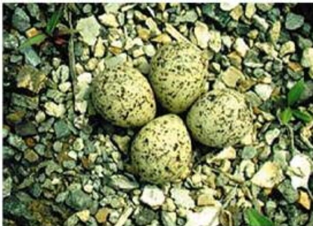
(۵) تړلیکی بچووک (س) زهورهوهی گهردن به خالی بچووک (ع) الزفراق المطوق الصغير Charadrius dubius (L)

۱۷-۱۵ سم درېزه. ودهکی تړلیکی تامخړ و گورؤفېره. تۆکهکا رهشا نهگهلهک پان ل سنگی یی نیر ودرهاتییه، ل دهقا یا می تۆکا ژیگوتی گهوره. نهنی سپییه گیخهکا رهش ژ بنی نکلی دهست پی دکت ههتا ژ چاقان دبورت. کولوئانکا سهری و پشت و چهنگ گهورهکی تارینه. کوری ودهکی پشتییه، سپیاتییهک ل دووماهی و تهنشتا وییه. ژ بنیقه سپییه. زفستانان تۆکا رهشا سنگی یی نیر گهورقه دبت و پاناقا وی تهنکتر لی دنیث. سپیلکا چاقان فههواییهکی تارییه. سهری نکلی وی رهشه پچهک ژ بنی وی زهرقهیه. پی ب سهر زهریقهنه. خهلهکهکا زهرا زراق ل دور چاقان ودرهاتییه. ژ رهفتارانقه تک و پیک ودهکی تړلیکییه. ل دهقا مه ژ نیقا ناداری پیده ههتا نیلونی ب قهتلازی و باراپتر جوتجوتته ل بهر لیقا نافنهیلین فهدهرین ب ناف دنیته دیتن. ل ههمی نهورؤبا و ناسیا، و ل ژورییا رؤژناقایا نهفریقا و مسری و تورکی و ئیرانی و عیراقی ( ل ملی نشیف خوجهه) تیژکان دنیته دهر.