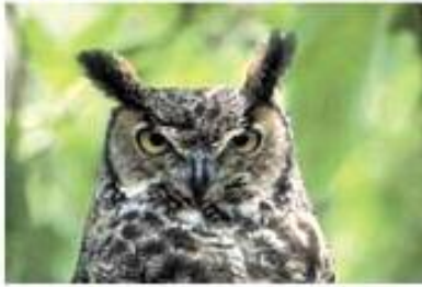
( ٦ ) كوندى شاخكدار (س) كونده پشيله (ع) البومة الأذناء Asio otus (L)