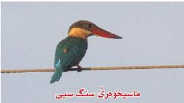
ماسیخوهری سنگ سپی

بالندەیین ژ فی نفسی سەری وان ل بەر کەلواشی وان مەزنە، و نکلی وان مەزن و راست و دریز و سەرتیزە. چەنگین وان کورت و خرن. ژ بەر بی ھیزییا پپیلۆکین خوە نەشین ل سەر ئاخی ب ریشە بچن. پەرین وان رەنگینن. خوارنا باراپتر ژ وان ماسینە (بۆ گرتنا ماسییان خوە دنیخنە ئافی و جارنا خوە بئناف ژی دکن)، و یا ھندەکان میس و مۆرن. دادنە سەر دار و چەقلک و دارتیلین ھندافی ئافان و خوە ل سەر بی دەنگ و نەلف دکن، و چافی وان رک ل ئافییە گاڤا ماسییەک بەرچاڤ بوو خوە تی وەردکن. ھندەجا ھندافی ئافی ل ھەوا چەنگین خوە دژەنن. کونان د کەندالناخین ھندافی ئافانرە دکۆلن و ھیکان تیدە دکن، و ھندەجا د کەلشین دارانرە دکن. ھیکین وان خەر و سپی سپینە. ل کوردستان سۆ جوون ژی ھەنە: ماسیخوهری کوچوچی کەسک، ماسیخوهری بەلەک، ماسیخوهری سنگ سپی.