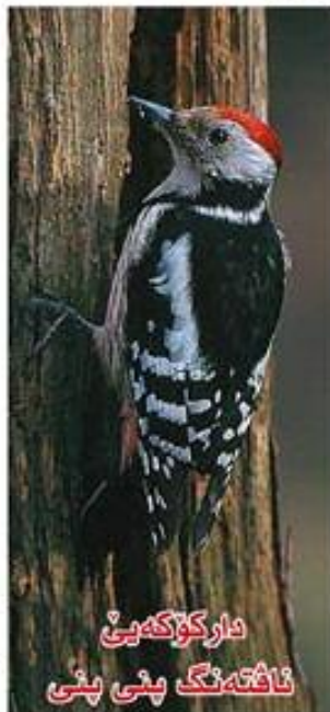
داركۆكەيى ناقتەنگ پنى پنى

ھەمى داركۆكەيان دگرت. كورىيا وان سنگوركىن و پەرب پ ھىزە، سەرى پەران تىژە. دبتە پالېستەك بۇ وان دەمى ب قورمى دارانقە دچن. پەرپەنگىنن. و جودايىيا نىران ژ مىيان ئەوہ قانا سۆرا ل كولۇقانكا سەرى وان مەزنىترە. ھىلىنان د قورمى دارانرە دكۆلن ب رىكا نكلى خوە يى ب ھىز. خوارنا وان مىش و مۆر و كرمك و شىرافا دارانە. خوەجەن. باراپتر ب تنى دژىن.