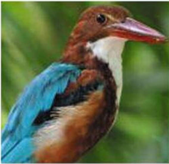
(۲) ماسیخوهری سنگ سپی (س) قوله شینهی سینگ سپی (ع) السماک الأبيض الصدر Halcyon smyrnensis(L)

۲۶ - ۳۰ سم دریژه. ب که لواشی خوڤه بیژه ته مه تی جوونی بۆرییه. پشتا وی که سه که کی ب سهر ته به سیقه هیه نانوکه نه سمانی. و نکل سۆره کی مه زنه. پی سۆرن، قانه کا سپیا مه زن ل نه رزنکی و چه فتکی و بهر چیلکییه. و بنزک قه هواییه. کولوقانکا سه ری و هه ردوو ناله ک و پاتک و پشپاتک و چه نگفه شیړین بچووک قه هواییه. و پست و هه ردوو چه نگ و کوری که سه که کی ب سهر ته به سیقه هیه. و شیناتییا بنپشتی تاریتره. گیخه کا رهش ل سهر ملانه. بنی شاپه ران سپییه و ره خین وان رهشن. سپیلکا چاقان قه هواییه کی فه کرییه. نیړ و می وه کی نیکن. باراپتر ل دۆر ئافان یان د نافه بیستانان یان ل سهر دارتیلان دنیته دیتن. خوارنا وی بهق و مارگویسه و میس و مۆر و کیژکن و هنده جا ماسییان زی دخوت. وه کی ماسیخوهرین دیتر کونان د که ندالناخانره دکۆلت و هیکان تیده دکت و تیژکان دنیته دهر. ژ (۴ - ۵) هیکان دکت. ل وهلاتی مه خووجه و ب قه تلازی دنیته دیتن. ل تورکی و عیراقی و سووریا و فلسطینی و ئوردنی و کویت و ئیرانی و ژۆرییا هندستانی و مسری (ب قه تلازی) خووجه و تیژکان دنیته دهر.