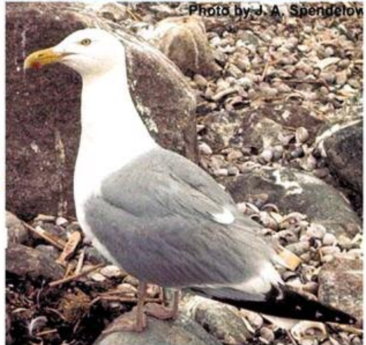
(۲) شه‌هنگی زیفین (س) ماسیگره‌ی زیوین (ع) النورس الفضي Larus argentatus (L)

۵۵ سم دريژه. نير و مي رهنگه‌کن. پشت د گه‌ل چه‌نگان - ژ بلی شاپه‌ران - خوه‌لیکینه ب سهر شینیفه. سهر و ستو و کوری و زک و بنزک هه‌می سپینه. نکل زهر و ستووره و پنییه‌کا سۆر ل سهری وییه. شاپه‌ر ره‌شن. سپیلکا چاقان زهرقه‌یه. پی زهرن. ب تیژکینی قه‌ه‌واییه‌کی پنیپنییه. ل ژییی نیک سالییی ژ نوو پشته وی خوه‌لیکی دبت. زه‌ستانان قه‌ستا وه‌لاتی مه‌ دکت و ل هندافی ئاف و رۆباران نیژیکی باژیر و گوندان، ژ دووماهییا ته‌باخی هه‌تا دووماهییا نیسانی دنیته دیتن. ل ژوری و رۆژئافایا نه‌ورویا و ل ژوری و ژیرییا رووسیا ل په‌راقین ده‌ریایا ره‌ش و ده‌ریایا قه‌زوین هه‌تا ده‌ریایین ترکستانی تیژکان دنیته‌ده‌ر. و زه‌ستانا خوه‌ل ژیری و رۆژه‌لاتی ده‌ریایا سپی و ده‌ریایا قه‌زوین و ده‌ریایا سۆر و که‌ندافی عه‌ده‌ن و که‌ندافی فارسی و عیراقی ده‌ربازدکت.