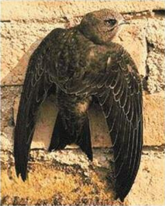
( ۲ ) چه فريك؛ چفرينك؛ نه بابيلك (س) چه ورووكه؛ تهيرهن نه بابيل؛ چه ورووكه (ع) السمامة الاعتيادية Apus apus (L)

۱۷-۱۶ سم دريژره. ب كه لواشئ خودفه ژ جوونئ بؤرى بچووكتره. و بهرئى وى قه هوايييهكى تارييه، ژ ملئ پشتيغه بچهكى دتهيست. نهنى قه كريترة ژ كولؤفانكا سهرى. كورى دوچه قه. حهفتك سپيغه يه، و ژ بنيغه قه هوايييهكى تارييه و زكى و ههر دوو ته نشتان شوونمايييهكا دهفداسكيا سبئ لئ به لاقه. سپيلكا چافان قه هوايييهكى تارييه. نكل و پئ رهشن. ژ سهرئ هه يقا سئ و بيده دئيته وهلاتئ مه و سهرئ تيرمه هئ پشتئ تيژكئن خوه ب فرئ دئيخت دجت. قه ستا كه فر و كه لش و كافل و نافاهييان دكت و هيلينان د كه لشه كون و سفانده يانره چئ دكت. سپيده ييان زوو و بهرى رؤژنافابوونئ خوهش دفرت نافبهين نافبهين ل ههوا سه متا خوه دگوهورت و رادهيسته ميئش و مؤران ل، ههوا دگرت و دخوت. ل وهلاتئ مه باراپتر د بهر سفانده يين خاننيانره و د كونئن ديوارانره وهكى سفيانكان (سيفانديكان) هيلينان چئ دكت و تيژكان دئينته دهر. ده مئ كوركبوونئ ل هندافئ نافاهييان سيرسيرئ دكن و دكه فنه دووف ئيئك. زفستانا خوه ل هندستانئ و نه فريقيا و گزيرته يا عهره بئ دبؤرينت.