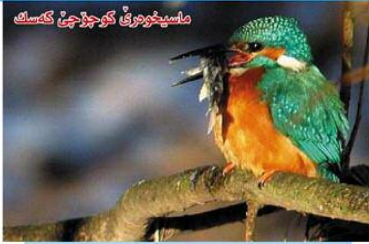
ماسیخوهری کوچوچی کەسک