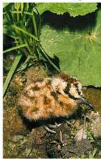
(۱) مریشکا ترشان (س) مره‌لاره (ع) دیک الغاب