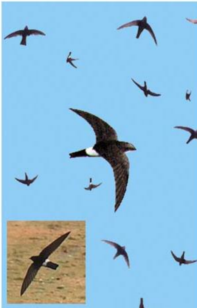
( ۲ ) چه فریکا بچووکا بنپشت سپی (س) چه ورۆکه ی بچووک (ع) السمامة البيضاء العجز؛ سمامة فلسطينية Apus affinis(L)

۱۳ سم دریزه. بچووکتیرین چه فریکه ل وهلاتی مه بیته دیتن. کوری کورته بی دوچه قی. بنپشتا وی سپیه. سهر گهوره کی ب سهر رساسیقه یه، و نه نی سپیه، و پشت ره شقه یه بچه کی دته یست. نه رزنک و هفتک سپینه. و بنزک ره شه. سپیلکا چاقان قه هواییه کی تارییه. نکل و بی ره شن. فرینا وی ژ یا چه فریکین دیتر هی دیتره و ب کیلایییا خوهفه گه له ک نیژیکی حاجیره شکیه هه رچه نده هه ره ک ژ بنه ماله کا جودایه. ل کوردستان ب ریباری بهاران هه یفا چار و بینج و پاییزان نیقارییان ل چولی، ل په ری گوندان خوهش دنیته دیتن. ل مه راکش و جه زائیر و توونس و ژیرییا بیابانا مه زن و سووریا و فلسطینی و حیجازی و ئیرانی و ده فه را ده ریایا قه زوین تیژکان دنیته دهر.