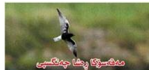
مەقەسۆكا رەشا چەنگسىي

و ھىندى مەقەسۆكىن دەريايىنە ژ شەھىنگان زرافتر و پى كورترن. كورىيا وان وەكى يا حاجىرەشكان دوچەقە. نىكى وان زرافتر و راسترە ژ پى شەھىنگان. ھەردەم ل ھىنداقى ئاق و دەراف و رۇباران، يان ل بەر لىقىن وان ل ھەوا دىچن و دىنن، ل خوارنا ماسى و گىانەومەرىن دىيىن ئاقى دگەرن و ژ سەر ئاقى رادىكن يان ژى ژۇردە خوە تى وەردىكن. كۆمكۆمە ل سەر لىقا گەر و گۆل و رۇباران ھىلىنن چى دىكن. ھىلىنن وان ھىندەك كۆركىن بى سەرۇبەر و قالىكن.