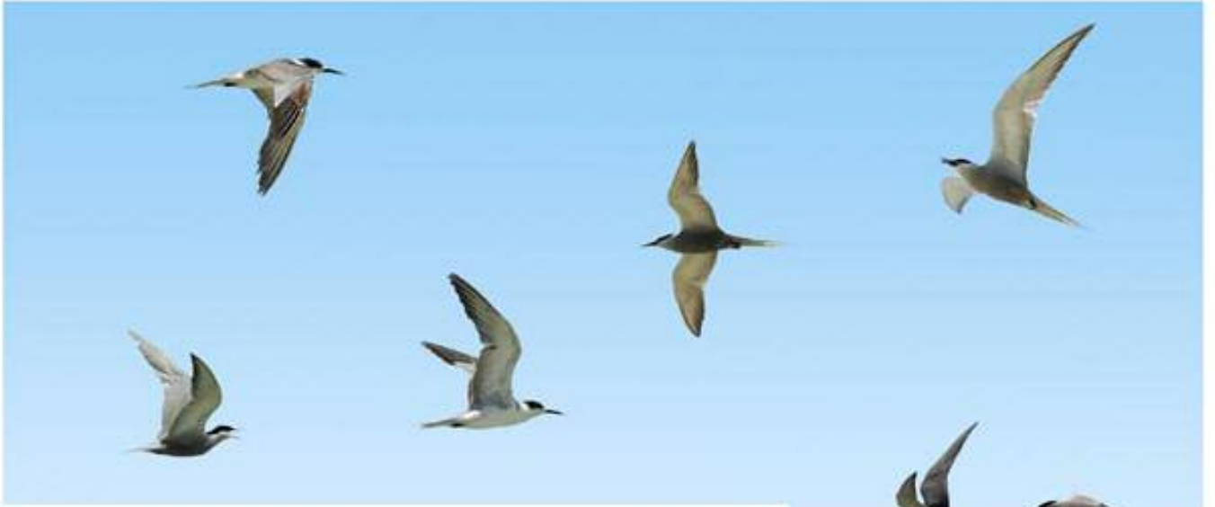
(٦) مهقه سؤكا ئالهك سپى (س) ماسىخؤركه ي بؤر (ع) خطاف البحر ابيض الخدين Sterna repressa (L)