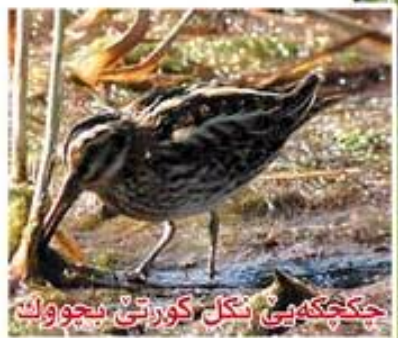
چكچكەبى نكل كورتى بچووك

ھىندەك بالىندەيىن نافىنجى و بچووكن. قارك و لاوازۆك وگەلواش زرافىن. دوبارى سەر بچووك و ستو دريژن. نكل و ان زراف و دريژە ژ سەرى وان باراپتر دريژترە. پى زراف و لوقلۇقەنە. باسكى پىيان رووت و بى پەرە. چەنگ دريژ و تىژن. كوريقوتن باراپتر. ژ دەر و دۇرىن ئاف و دەرافان قارى نابن. ل سەر ناخى ھىلىنان جى دكن. خوارنا وان ئەو ھوورەجانەومرەنە، ئەويىن د ئاف ئاقىن مەياقدە دژين.