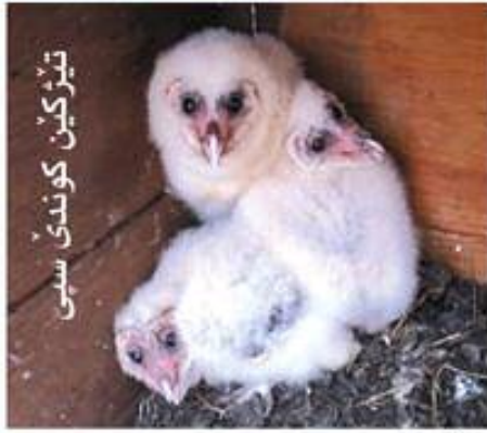
تیزکین کوندی سپی