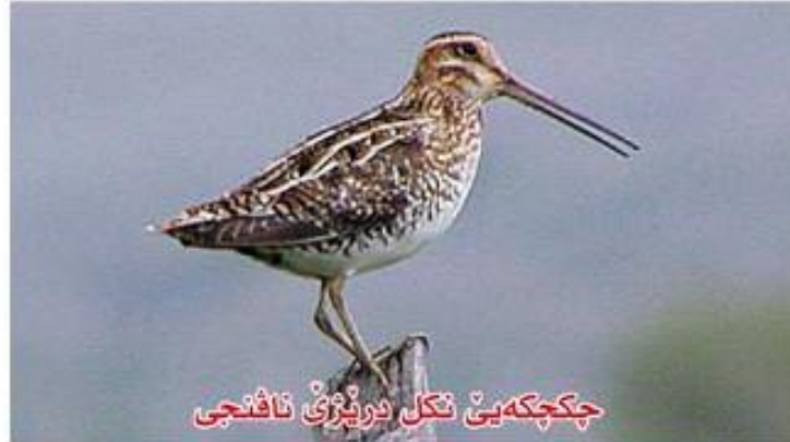
چكچكەبى نكل دريژنى نافىنجى