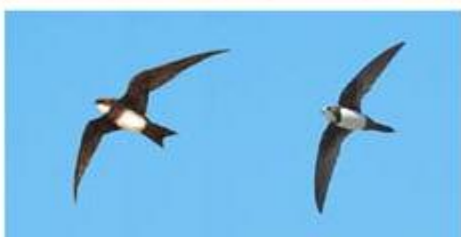
( ۱ ) چه فریکا چیاپی؛ چه فریکا نافچیاپان (س) چه ورۆکه ی نالی (ع) سمامة الصرود؛ سمامة الجبال Apus melba (L)