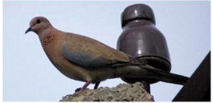
( ۵ ) قومریبا ناڤمالان