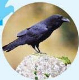
(۱) قرگورگ؛ قرا که له خان (س) قه له گورگه (ع) الغراب الاسود Corvus corax (L)