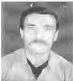
کاک ( به شارات نه مین هه مزه )

ناوی (عیسمهت) خوشکم بینی ، نیتر خهه وپه ژاره دایگرتمی وله داخدا به چاوی پر له فرمیسه که وه چووم بق ناو بازار شاره که ، نوسخه به کم لی کۆپی کرد وچوومه وه مله وه ، جاریکتر زامه کانمان کولایه وه ، به لام هیچیشم پی ناکریت ، بۆیه داوا ده که م له دهسه لاتداری نیکورد وه مووریک خراوه کان هه ولئیک بدهن بق دۆزینه وه یان ۰۰۰). هه ره له م چوا چیوه به دا چووینه لای