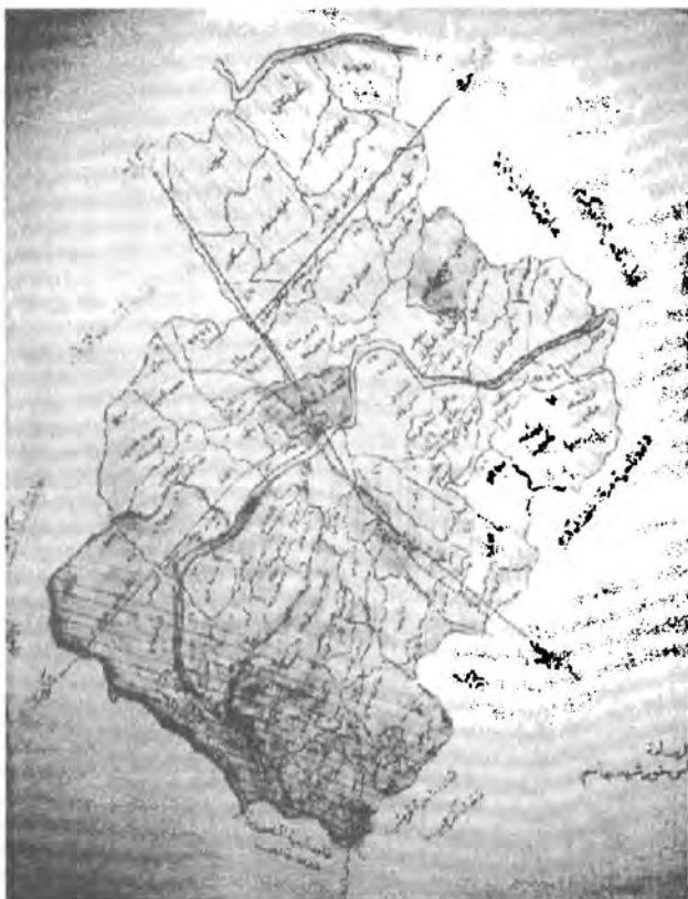
( نقشه و مسوره قاره خویان تا تنگ و جنوب ناحیه نادر که نام )