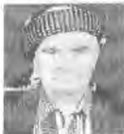
عوسمان په فیک خدر ، گوندی گۆلباخ

زوری داوی ویناری گلپان له وی کۆکردبووه که ژن ومانا بوون . چه ند پوژیک ماینه وه ، پاشان گوازیینه وه بو سجنیکی تر له نزیک تکریت ، ماوهی ۱۳ مانگ ماینه وه ، ههر لیره کچه عازمب وپیاوه کانیان له نئمه جیا کرده وه و به ته واوه تی له به کتر دابراین ، ژیانیکی زۆر ناخۆش وپیر له مردن و برسیتیمان برده سهر ، بهر له وهی پیاوه کانیان لێ جیا بکه نه وه چه ند جاریک به بهر چاومانه وه پیاوه کانیان ده بر بو ته عزیز و نه شکه نجه دان ، که جیاش کرانه وه ئیتر له دلا خۆمانه وه ووتمان پیاوه کانیان بو کوشتن برد ، به ره رحال پوژیک خرمانیان و به سه یاره ی موقه پهت بردمانیان بو نوگره سه لمان ، شوینیکی زور قه بیح و ناخۆش بو ، پوژانه ده یان ژن و پیاو مندال له برسیتی و نه خۆشیدا ده مردن و دواتر ده بوونه خۆراکی سه گه رهش ، کوره نازمان باس چه حاج بکه م یان باس سه گه رهش بکه م ۰۰۰)