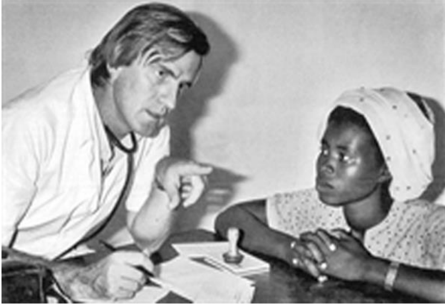
كۆشنىرى پزىشك له ئەفرىقىادا