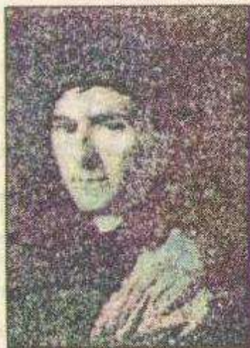
جان جاك رؤسو

فراوان بوونی شاره‌کان و زۆربوونی ژماره‌ی دانیشتوانی ئەم ولاتانه کۆبوونه‌وه‌ی گەل له دانیشتنیکی یه‌ک‌گرتوودا شتیکی ئاسان نه‌بوو بۆیه له قووناغی دووه‌مدا گەل له ریگای پرۆسه‌ی هه‌لبژاردن نوینه‌ری خۆی هه‌لبژاردو له ریگای ئەم نوینه‌رانه‌وه حوکمرانیستی خۆی ده‌کرد که ئەمه‌ش پیتی ده‌ووتری دیموکراسییه‌تی ناراسته‌وخۆ.