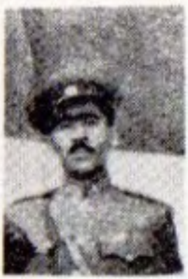
موحه ممد ديا هوو