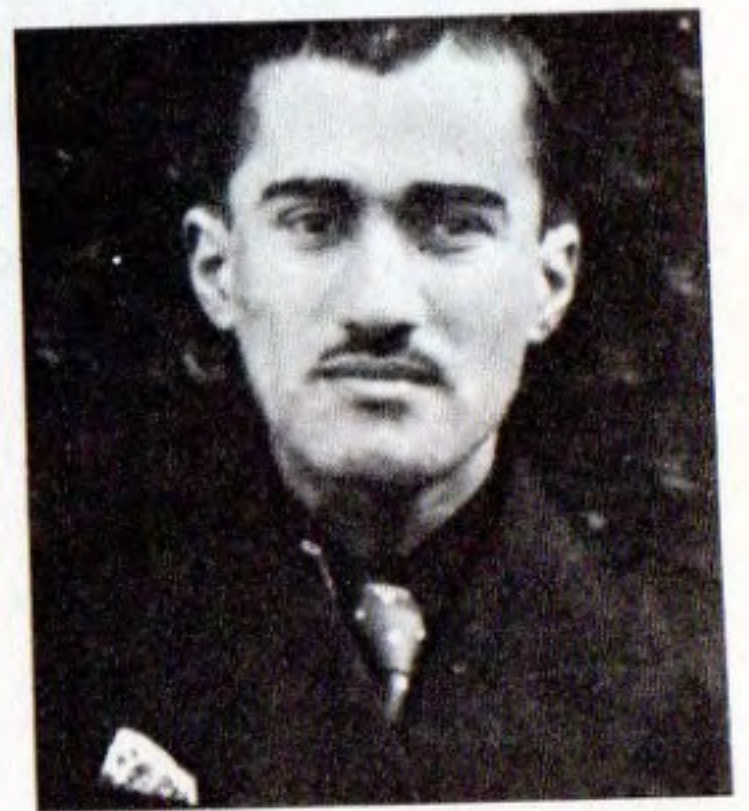
شههيد موحه ممد دنا نه وا زاده