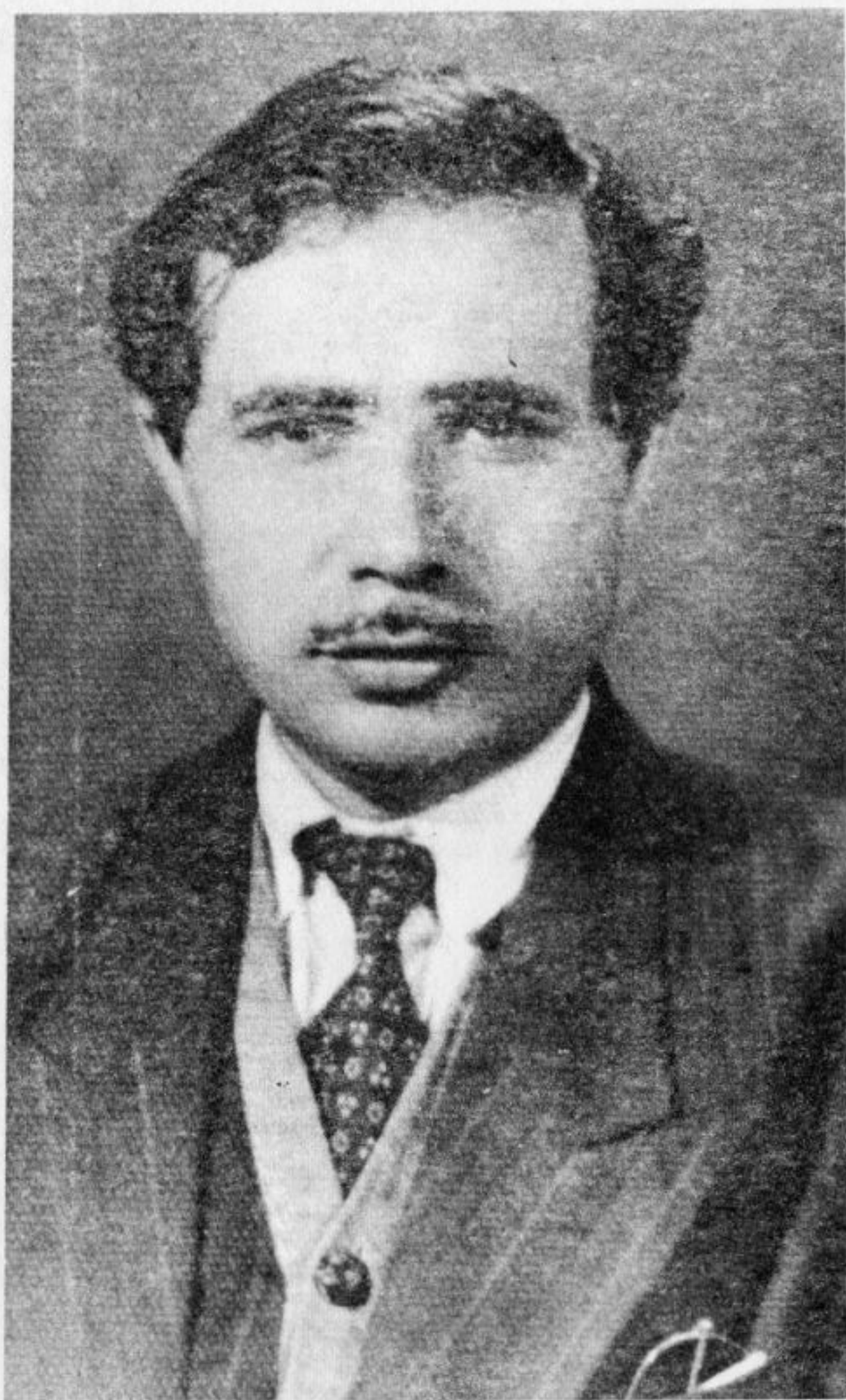
عه بدو لره حماینی زه بیجی

سه ری خوئی بکات • کووتم جه نابیی قایم مه قام ، نه و پیاوه تی و ئینسانییسه ته ی توّم هه رگیزله بیر ناچیت • هه ر ئیستا ده چم وه پئی ی ده لّیم که عیلا جی خوئی بکات • نه وه م کووت وه هه ستام ، خودا حافیزی و مالّ ئاوا ییم له قایم مه قام کرد ، وه هه ر ئه و شه وی سوله یمانیم به جی هیشت •