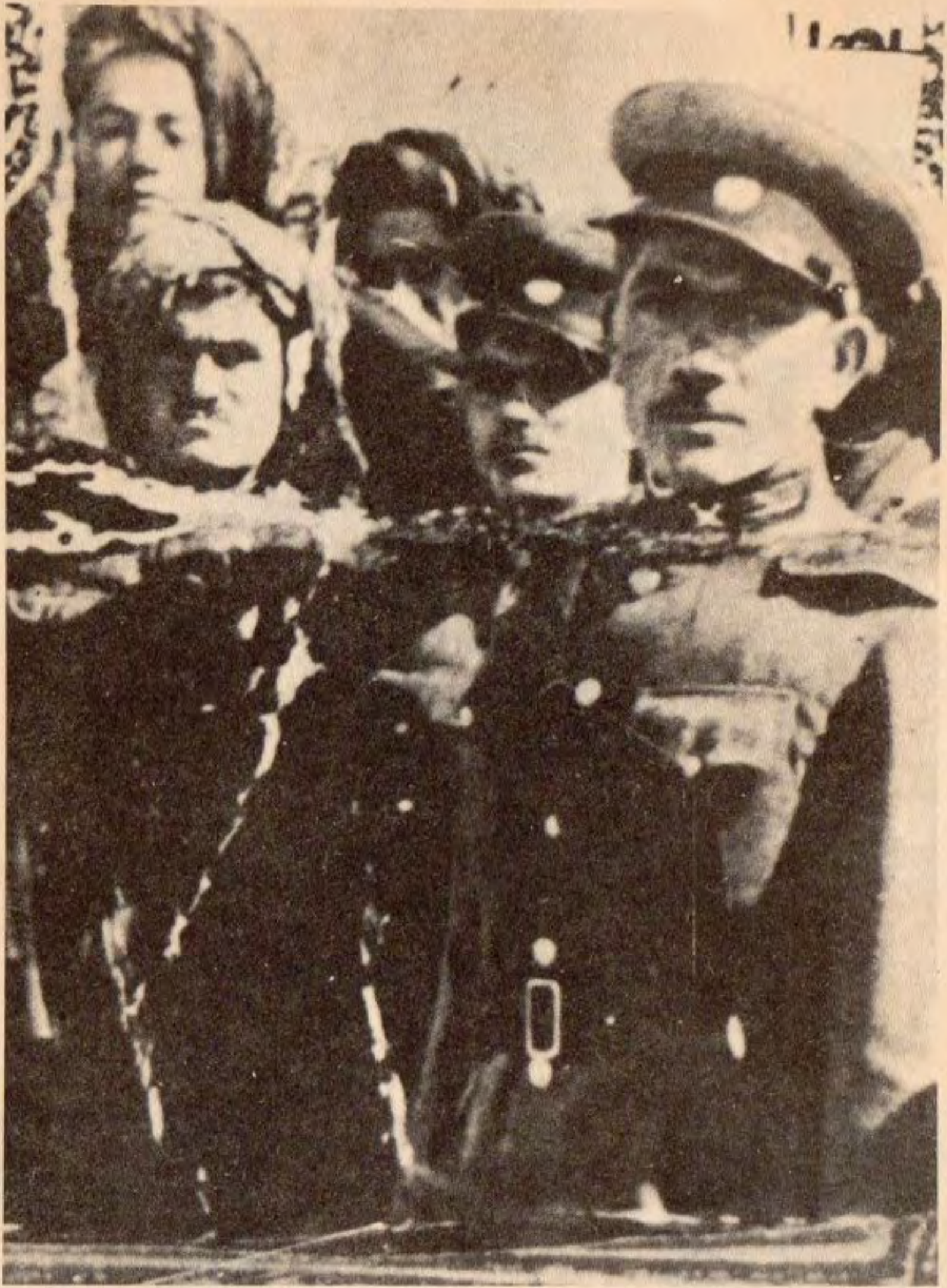
خودالی خوشبویو موحه ممه دنانه وازاده