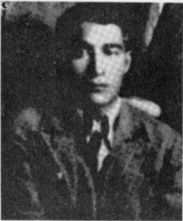
خودا لیخوشبوو عبدولرحمان ئیما می