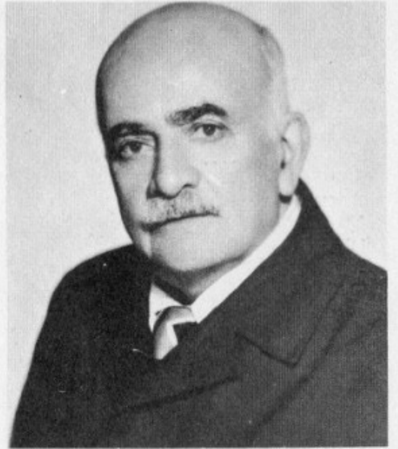
کاکسه ددیق جهیده ری