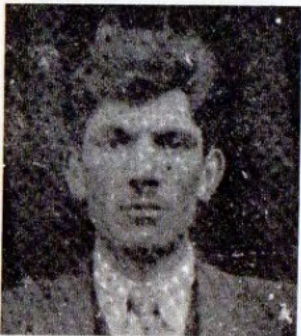
خودا ليخوشبوو رحمان كه يانئى