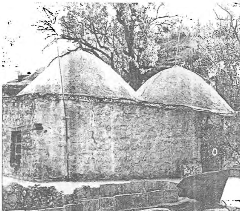
زیاره‌تگای سولتان نیسحاق له‌گوندی شیخان که‌کاتی خوی مینۆرسکی سەردانی کردووہ