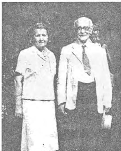
مینورسکی و هاوسه رده کی تاتانیا نه لکسیونه مینورسکایا