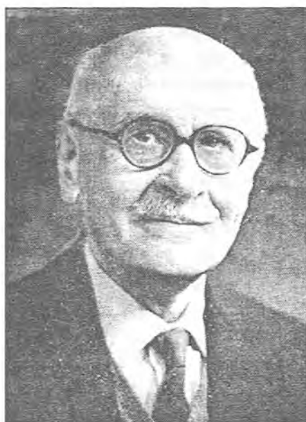
میںورسکی رۆژھه لاتناس ۱۹۶۲