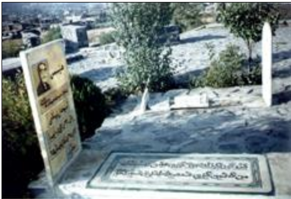
گلکو و نارامگه‌ی هیمن نه گورستانی بداغ سوئتان - مهاباد