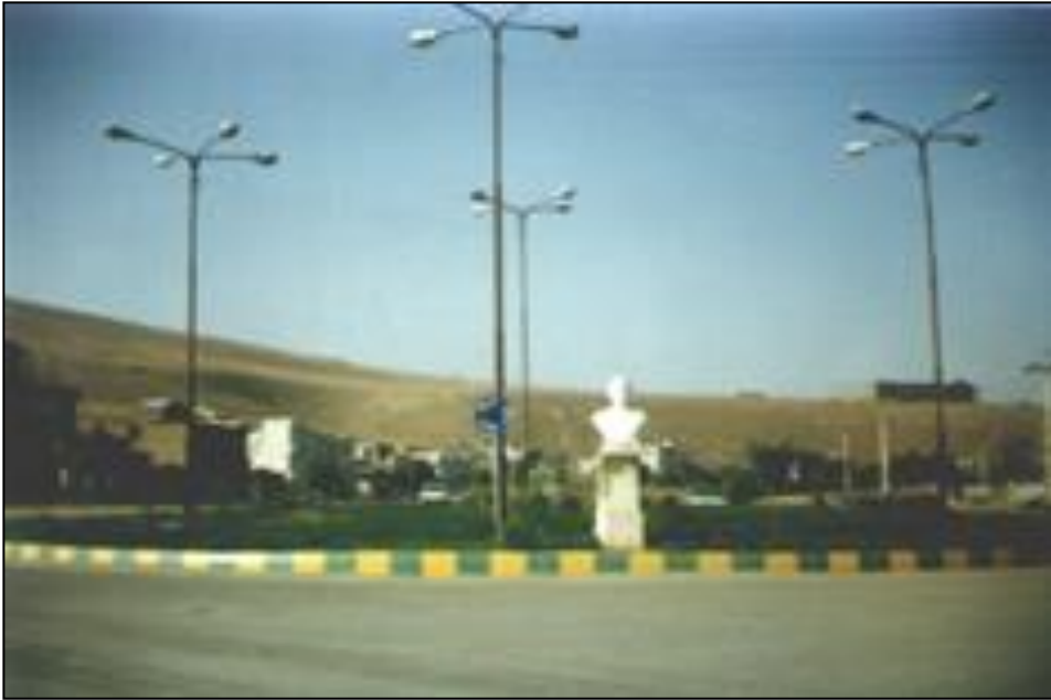
فەتەكە و مەیدانی هێمن ئە مەباد كۆتە ئی هێمن تیادا بە دیار دەكە ویت