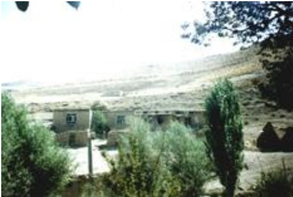
دیمەنی گوندی شیلانای