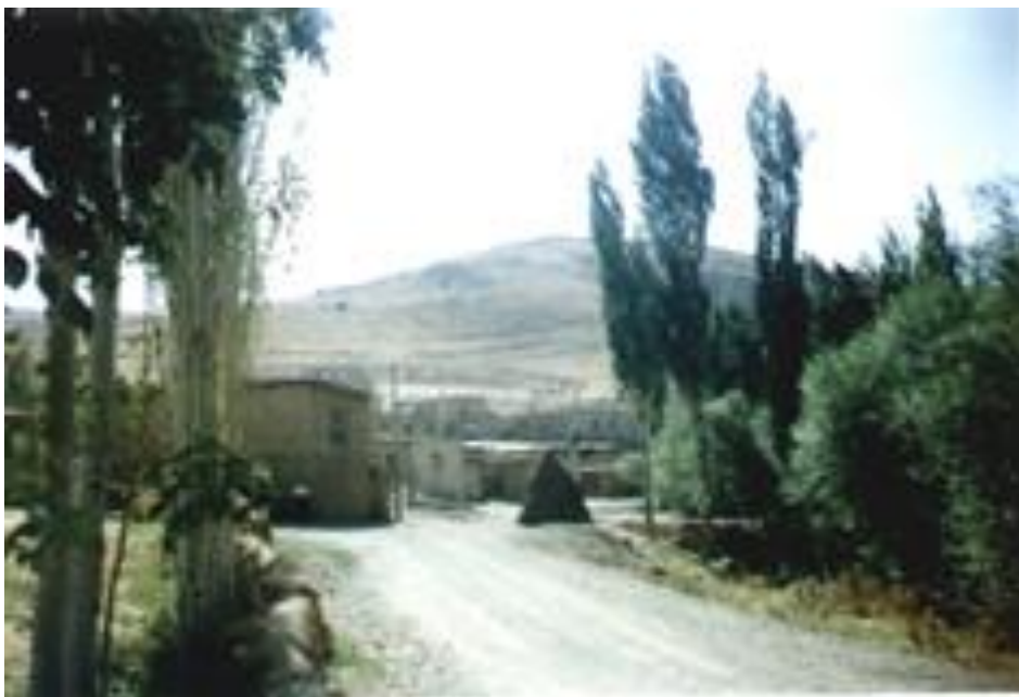
خانو و مائه‌کهی ماموستا هیمن / له شیلانوی