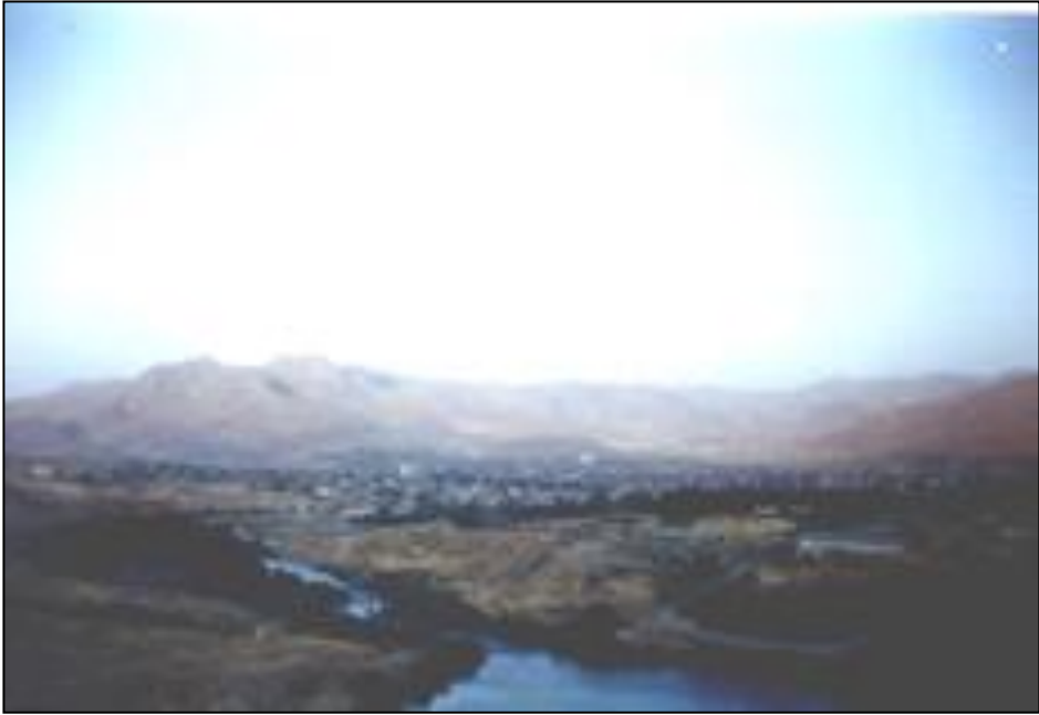
دیمه نیکی شاری مه‌آباد