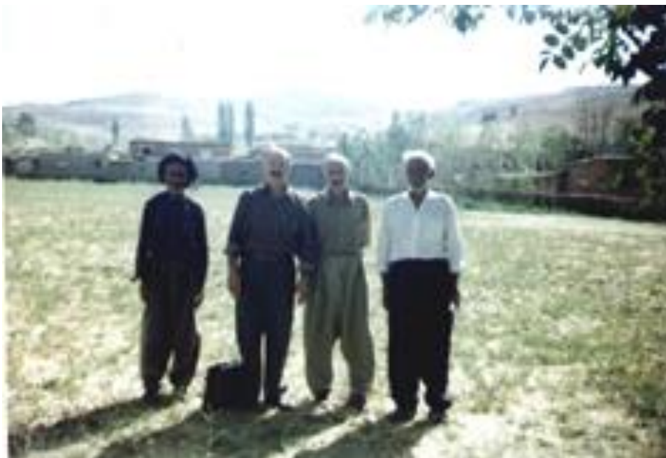
شیلانوی / ته‌های شیخه نییسلامی , سه‌لاحی شیخه نییسلامی (کورپی هیمن) , نوسه‌ری نهم باسه , باغه‌وانه‌کهی ماموستا هیمن .