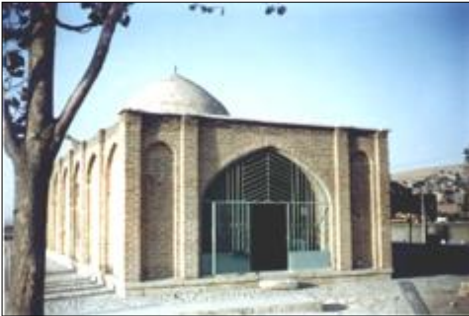
نارامگا و مهزاري بداغ سوئتان نه مهاباد