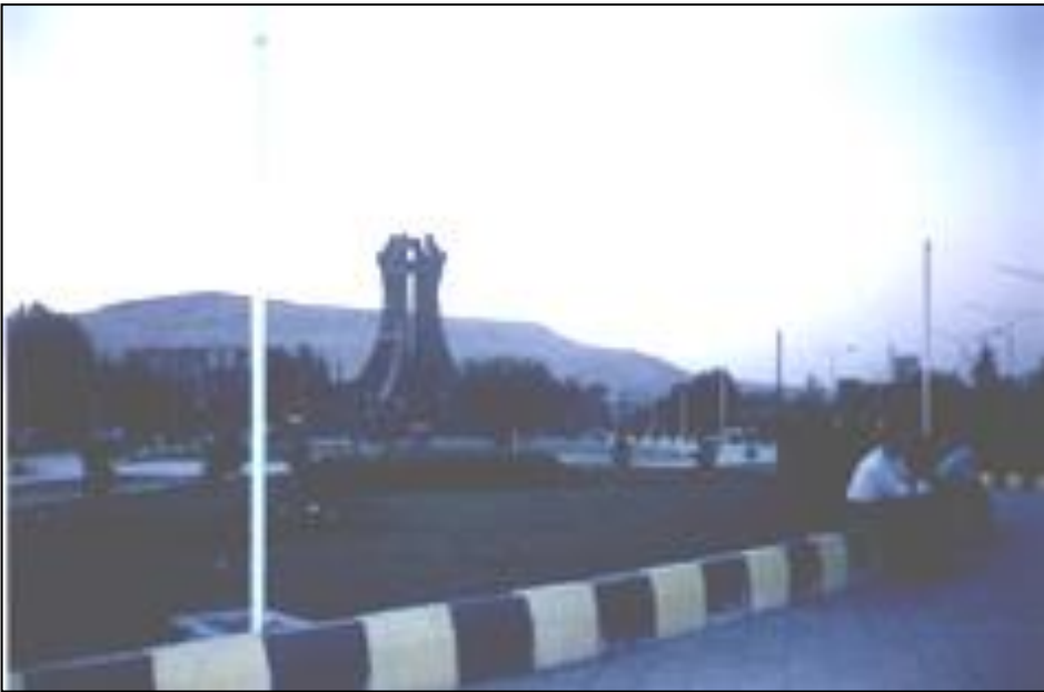
مه‌یدانی مه‌لا جامی - مه‌آباد