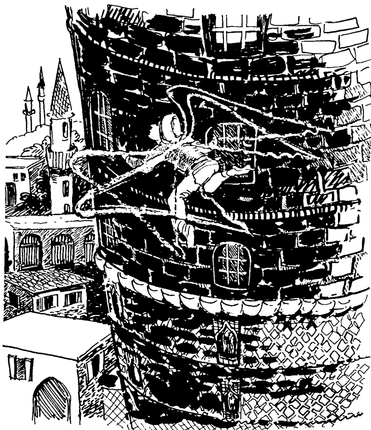
(Wêne : Ingela Jandell "Epikên Kurdi, H.Cindi, Stockholm, 1985, Invandrarförlaget" )