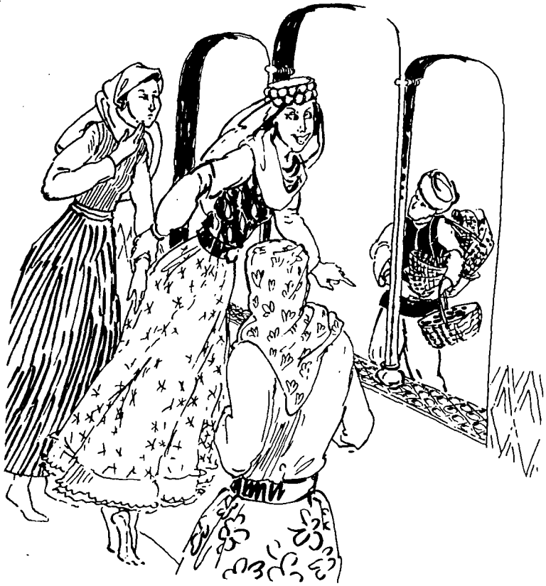
(Wêne : Ingela Jandell "Epikên Kurdi, H.Cindi, Stockholm, 1985, Invandrarförlaget" )