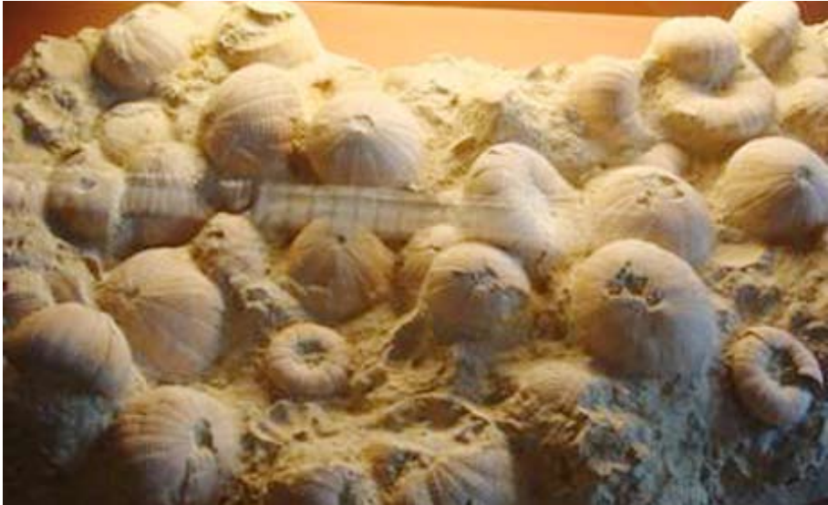
۱۳) قەندىلى دەريا، تەمەنى گۇرپانچان بە بەرد دەگەرپتتەۋە بۇ پىنچ مىليۇن سال. ئەم بەردە لە دەرياي سىپى ناۋەپاست دۆزراۋەتەۋە .