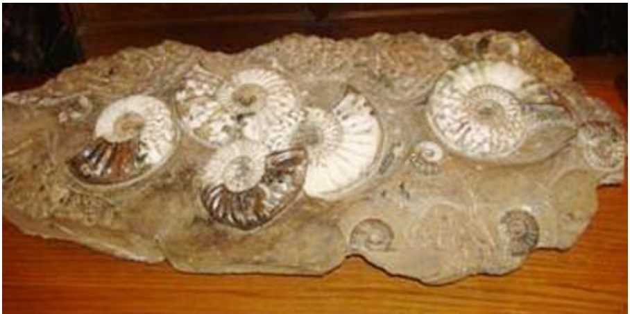
۱۴) چەند كرمىكى مىلكە شەيتانكە، تەمەنى بە بەرد بوونچان دەگەرپتتەۋە بۇ ۲۰۰ مىليۇن سال. ئەم بەردە لە برىتانچا دۆزراۋەتەۋە .