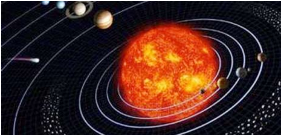
وینه ی (۱)، کۆمه له ی خۆر.

کۆمه له ی خۆر: له خۆر خۆی و نۆ هه ساره ی دیکه و چه ندین مانگو نزیکه ی ۱۵۰۰ ئه ستیره ی بچوکو ئه ستیره ی کلکار پیکهاتووه . زه وى یه کیکه له و نۆ هه ساره یه، که بریتین له: زه وى، عه تارد، زوهره، مه ریخ، مشتیره، زوهره، ئورانۆن، نیپتۆن و پلۆتۆن . وه ک له م وینه یه ی خواره ودا دیاره: