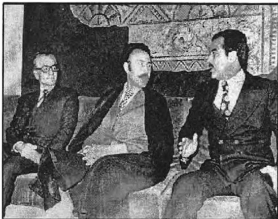
سەھام ھوسەين ——— شەھزادە ئۆمىيەت ——— شا