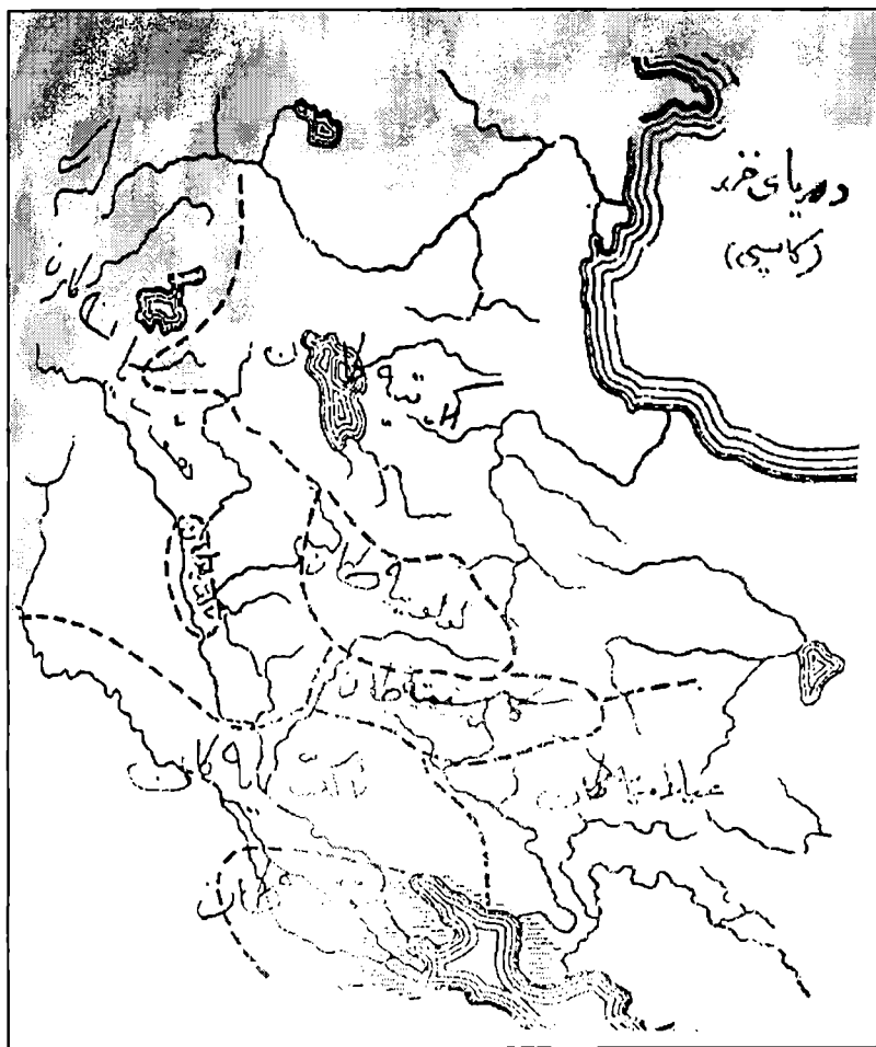
شویئی نیشته جیی کز مه له نه ژاده کانی سهرزه مینی ماد له هزاره ی سییه می پیش زابین