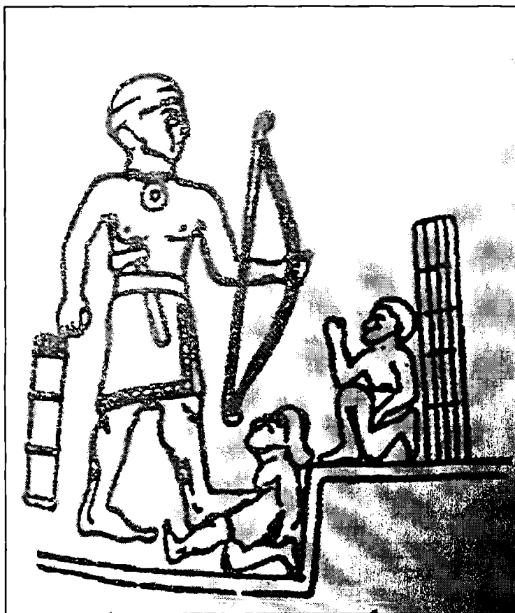
پەيكەرئىك لە ھۆزىن و شىنخان