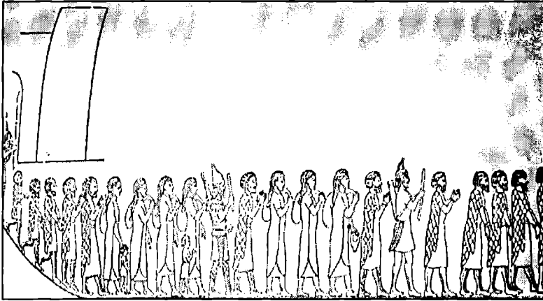
به ززر کوچاندنی ماده کان، له پرووی به ردیکی تاشوریه کان له نهینه واکیشراوه، سه دهی حوته می پیش زاین