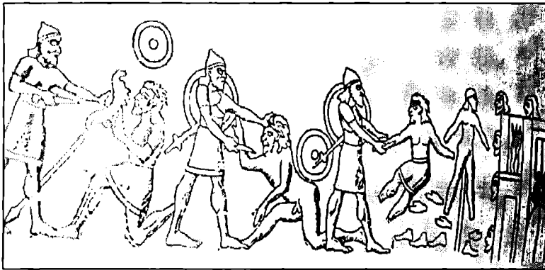
تاشوریه کان دیله کان ده کوژن- له پرووی نه خشی ده رازدی (بالارات) ی شه لمانشاری سینه م وهر گپراوه.. له سه دهی نۆیه می پیش زایندا