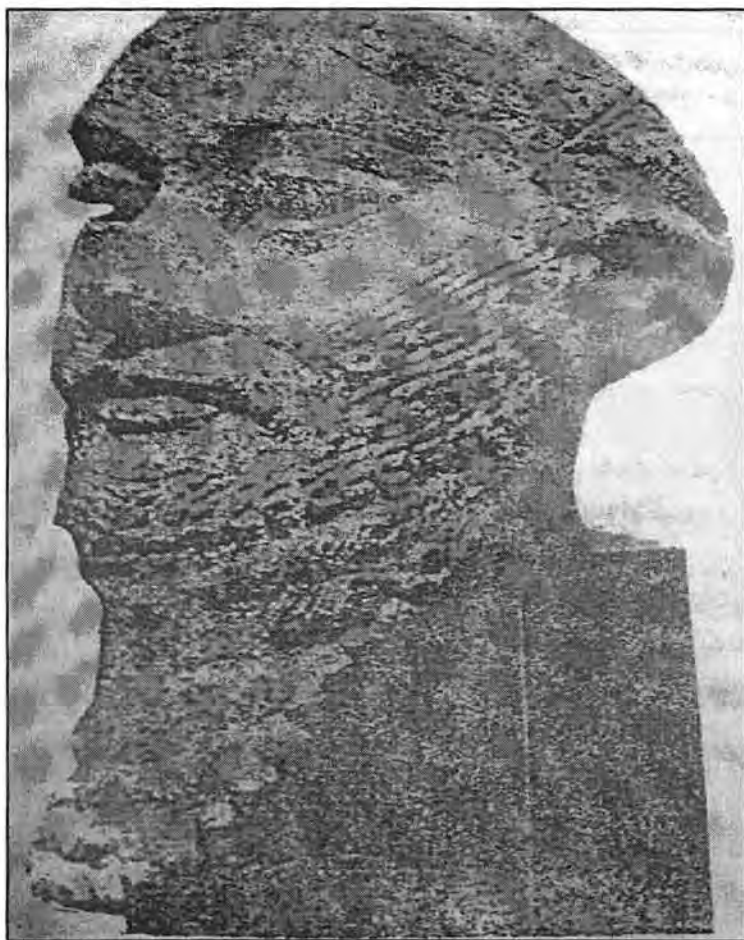
په یکه‌ری سدریک- وینه‌ی پاشای گوتیبیه‌کان، له هه‌وجۆش دروست‌کراوه