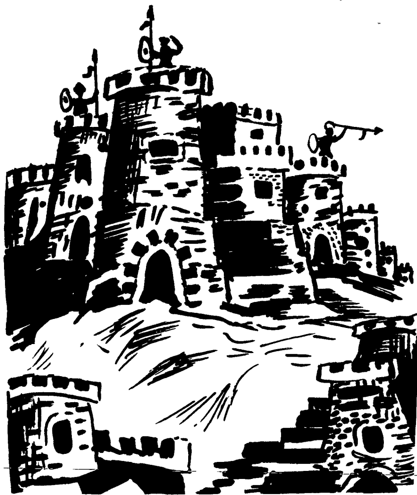
Kele a DIMDIM

Divê gelê kurd wê rojê Qet birneke tol û dozê.