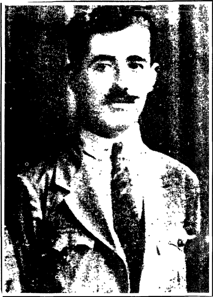
İhsan Nûri Paşa