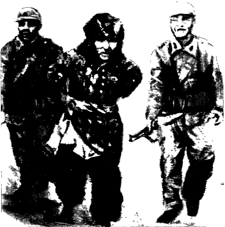
Niřana zordestiya dewleta Tirk