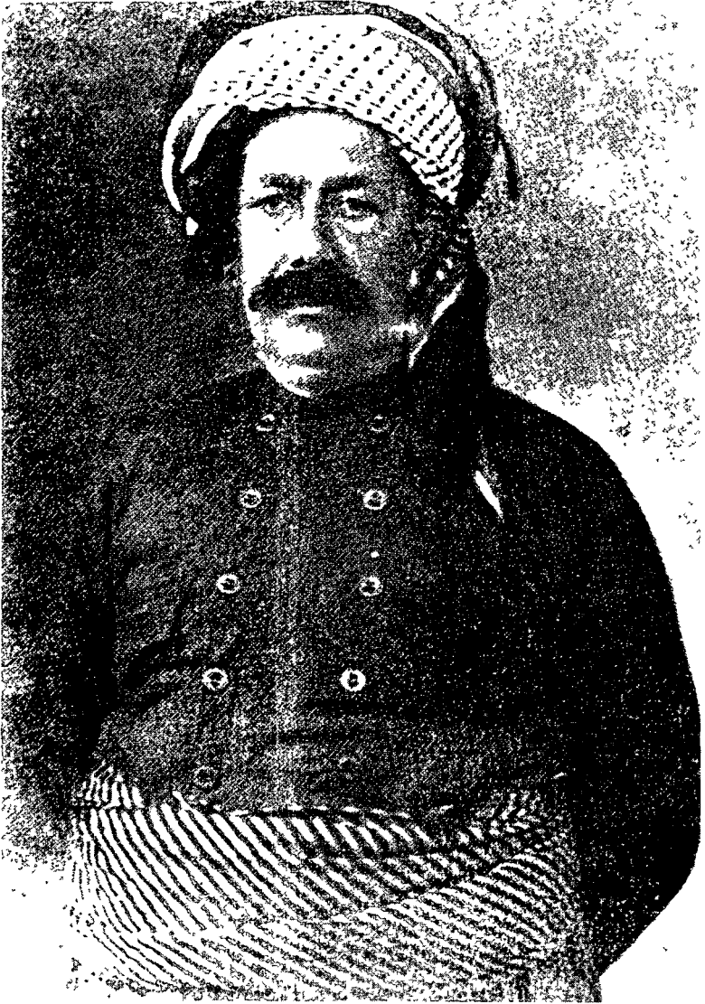
Şêx Mahmût Berzenci