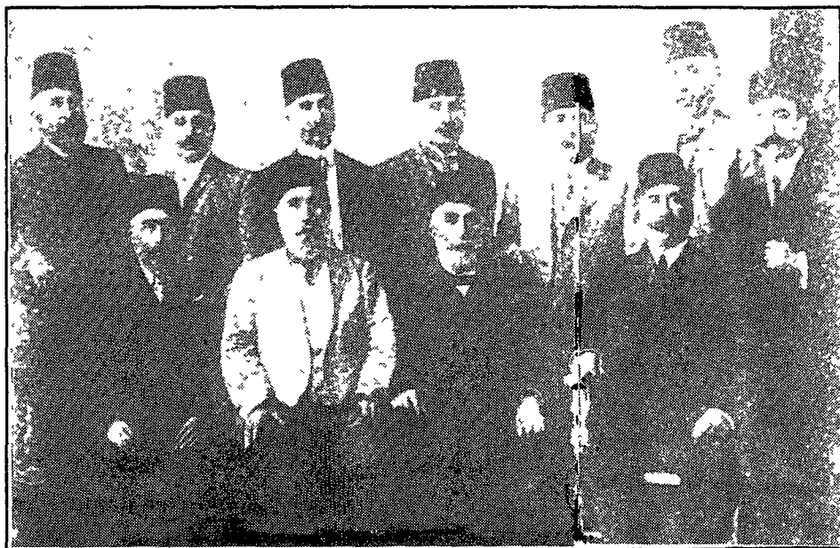
Gûrûbek kesên malbata Bedirxan'an

Gelê Kurd qet wan birnake Xwedê rama xwe li wanke.