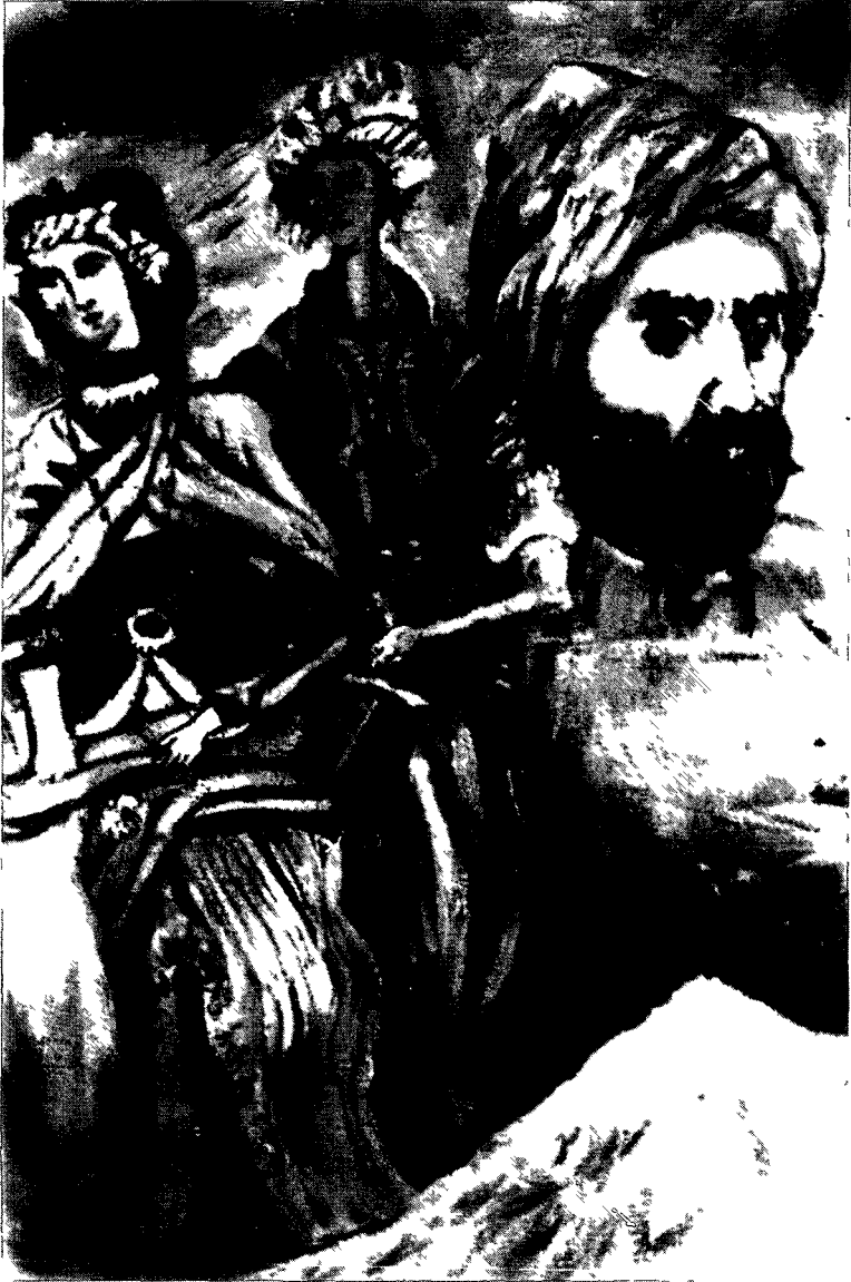
Mem û Zin û Ahmedê Xani