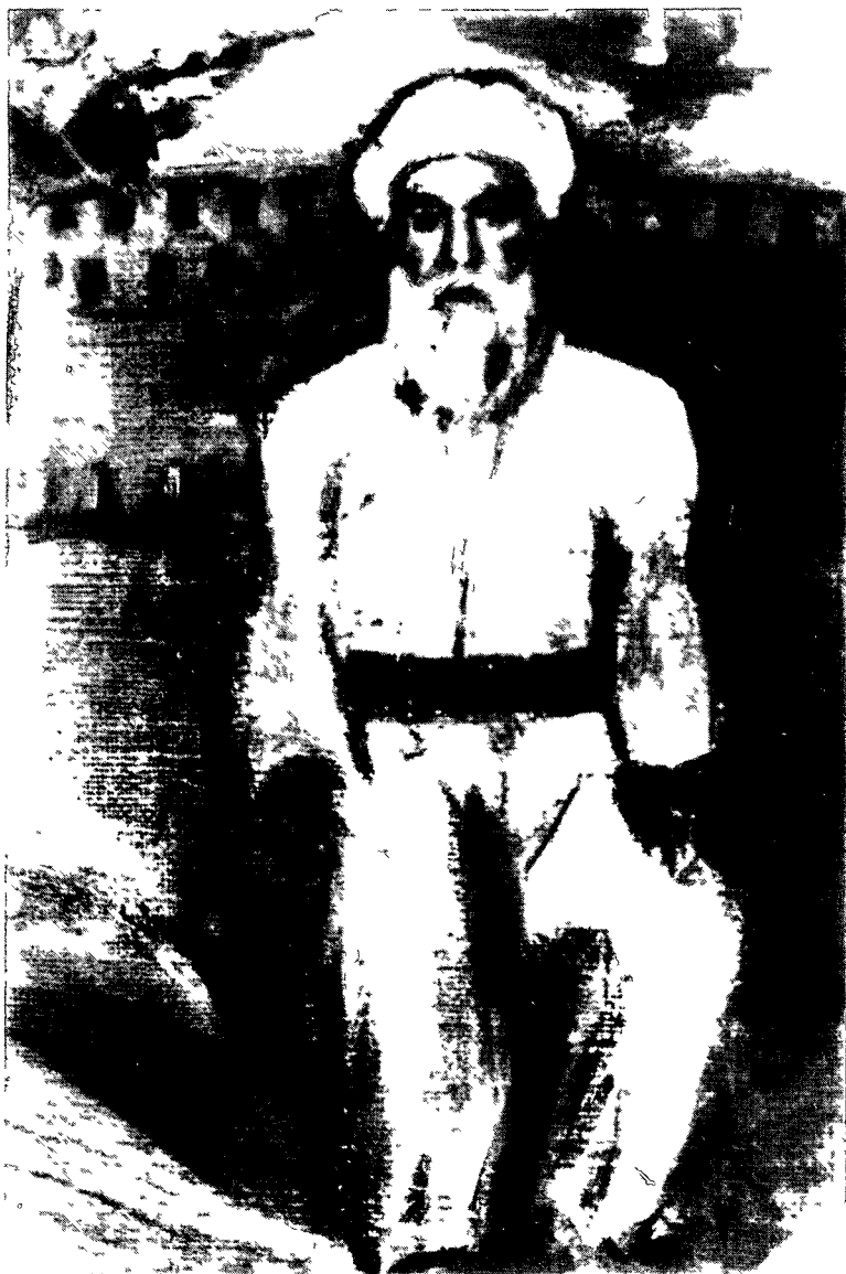
Şêx Said'ê Piran