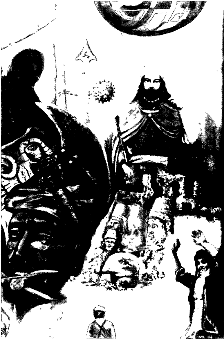
Pêxamberê Kurd Zerdešt