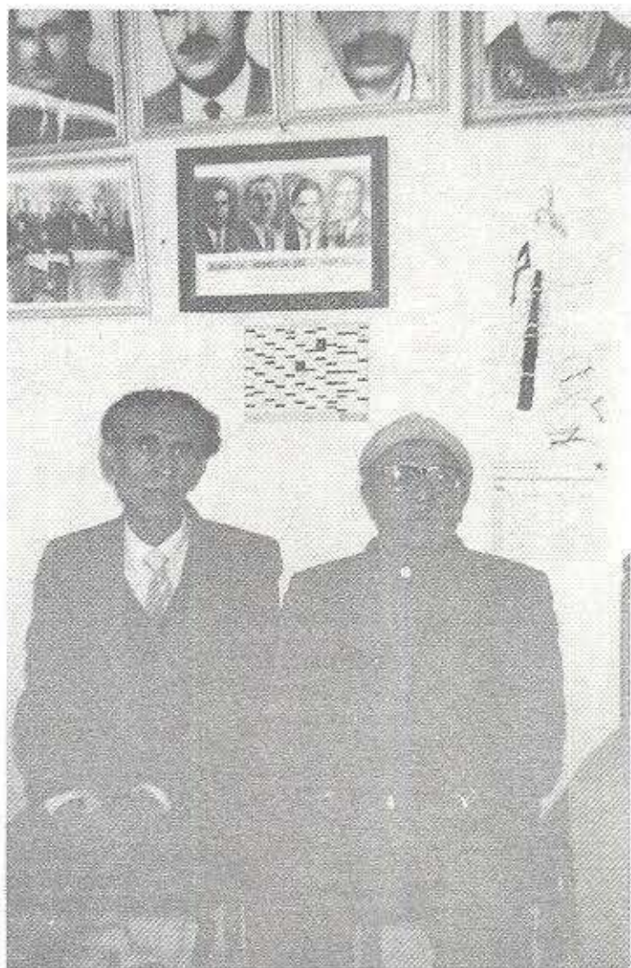
دلزار و سه یدا نوسمان سه بری له مالی سه یدا له شام - 1989