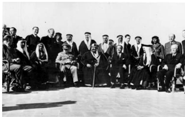
بریتانیا ده‌وله‌تا سه‌وديه يا موديرن دامه‌زراندن

هاتنا ده‌سه‌لاتارين نه هه‌ژى ده‌سه‌لاتى بوويه نه‌گه‌رى هندى خه‌لك بى ده‌نگ ببن به‌رامبه‌ر هه‌ر كرىاره‌كا به‌يته كرن، لگهل هاتنا ده‌وله‌تا عوسمانى بو روژه‌ه‌لاتا ناڤين و خو پينا‌سه كرن ب خه‌ليفاتيا ئيسلامى ئيدى هه‌رده‌م شه‌ر د ناڤ مله‌تتين ئيسلامى دا دهاتنه كرن ، هه‌تا سه‌ده‌سالا ۱۸ى كه‌سه‌ك ل سه‌وديا عه‌ره‌بى رابوو و خو ديار دكر ب مجدد د ناڤ جيهانا ئيسلامى دا و شيا ده‌سه‌لاتا عوسمانيا ل سه‌وديه لاواز بكه‌ت و ب پشته‌قانيا سياسى يا بنه‌مالا سه‌ود ببته مه‌رجه‌عنى دىنى بى ده‌قه‌رى و ديسان بنه‌مالا سه‌ود ژى ب پشته‌قانيا ئنگليزان شيان ده‌وله‌تا سه‌وديه دامه‌زرينن ب ناڤى ميرنشينا عه‌ره‌بيا سه‌ودى.