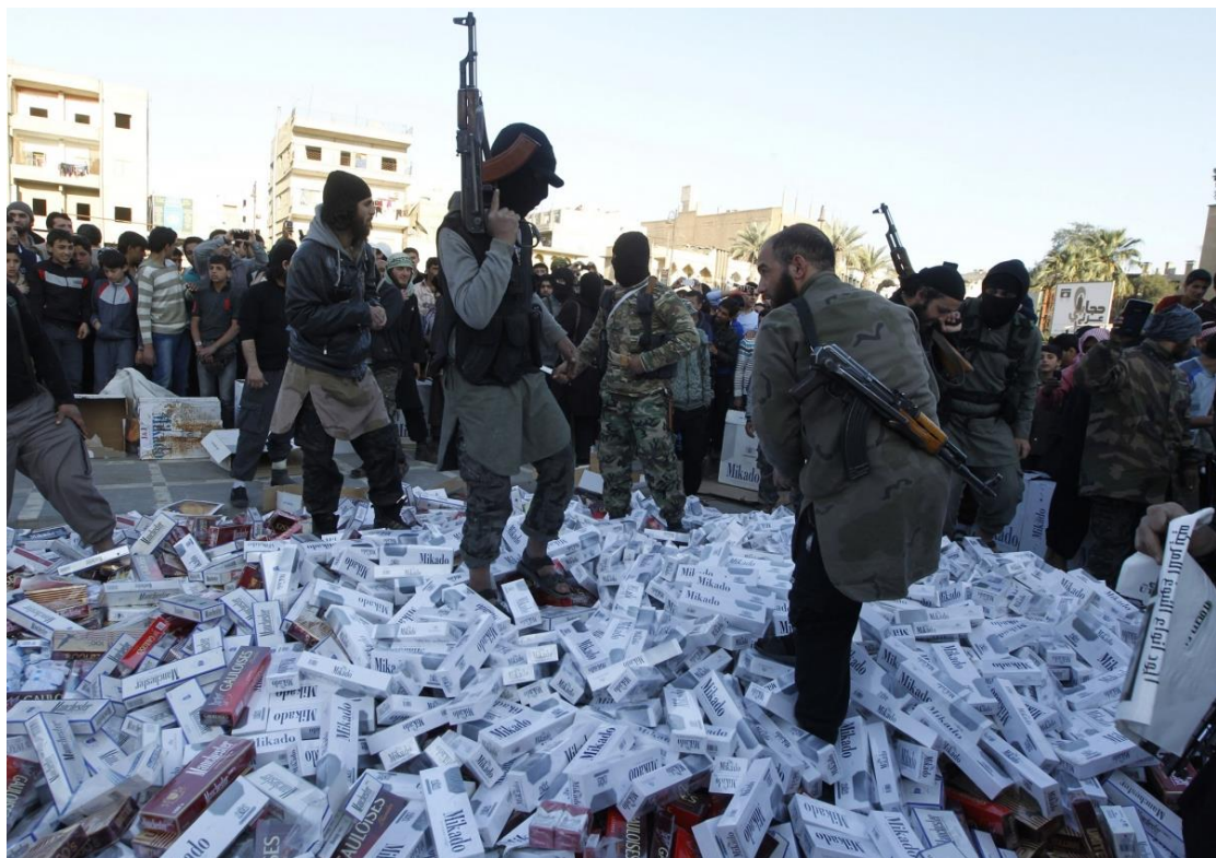
نەبوونا مارکین نەمریکی جەئ سەرنج راکیشانی یە ، سوریا - رەققا

پتیرا ئەندامین ریکخراوی د ناقبەرا ژیی ۱۸-۳۰ سالیی دانن و ئەو کەسەنە یین ژ نو ی بووین موسلمان.