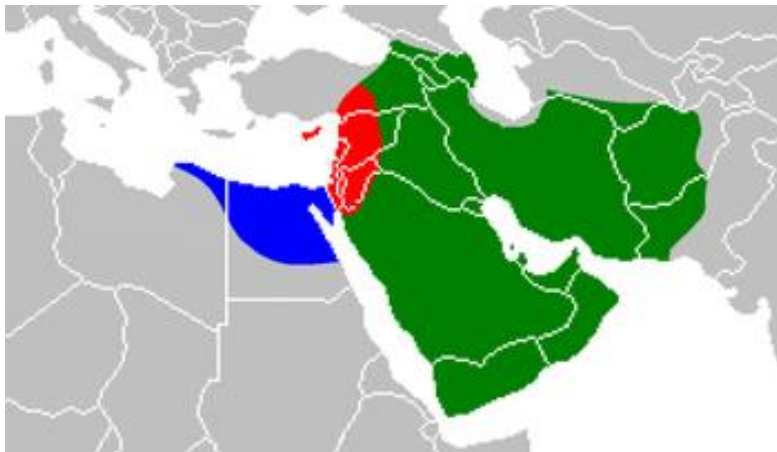
دهولته ئىسلامى د سهردهمى رويدانين نافخويى دا

لگهل پهيدا بوونا كيشتين سياسى د ناف موسلمانان دا دهولته ئىسلامى ب شهيد كرنا على خهتاب ب دويمه ي هات و ل جهى خهليفه ي نهوى ب نهجومهنى راويژكاريى (شورى) دهاتى دهست نيشانكرن سيستهمى سلطانيى هاته پهيره و كرن و دهسلات ژ بابى بو كورى دما و خودان دهسلاتهكا بي سنور بوو.