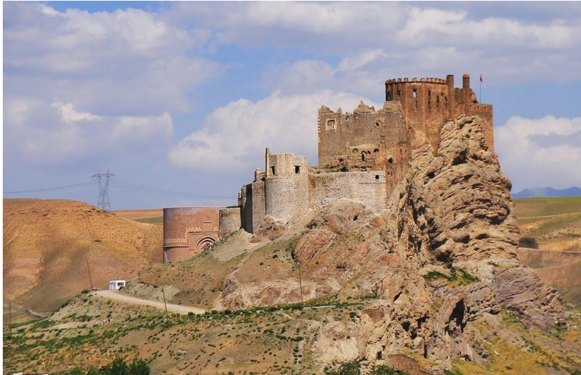
صهباحی ل قلعا مرنی گهنج کوم دکرن

ههبوونا نایدولوژیین دژی نیسلامی ل ژیر نافئ نیسلامی بتنی نه ل روژهلاتا نافین بوو ل هندستانی ژی اکبر شاه نیمپاراتوری نیمپاراتوریا بابوریا دینهک تاییهت راگه هاند ب نافئ دینی نیلاهی و ل سهر خهلکی فهرز کر ل دهمن سلاقی نیک بکهن بیژن "الله اکبر" بهلی نهف سلاقه ب رامانا هندئ نینه کو خودئ مهزنه اکبر شاهی نیدیعا کر نهو پیشهوایین جیهانی یه و خوه دکر خوداوهند و نیسلام قهدهغه ک ، ب ههولین نیمام رهیبانی و ب جددی نه وهگرتنا خهلکی نهف دینه هاته ههلوهشاندن.