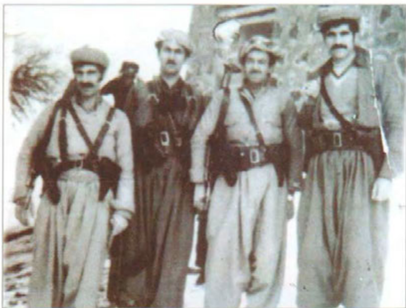
دتی بلہ سہن، نزیک بانہ سالی ۱۹۷۹. لہ راستہ وہ: مستہ فا چاورہش، حمہ نہ مین ناغای بارئ، محہ مہ جی حاجی رہ شیدی بلہ سہن، فہ تاح خان سالوک.