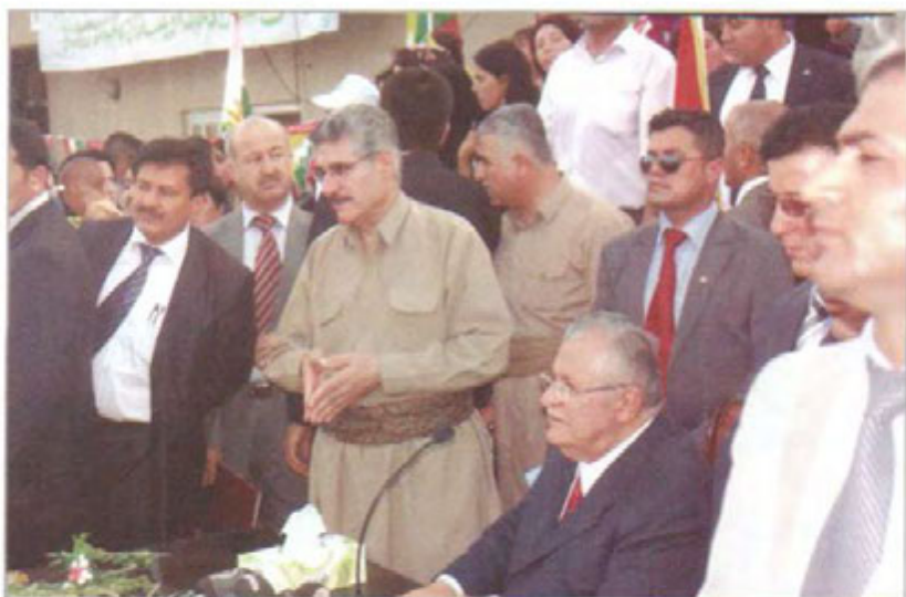
پانیپہ، لہگل بہریز مام جہلال. ھلبژار دینہ کانہ سالی ۲۰۰۹