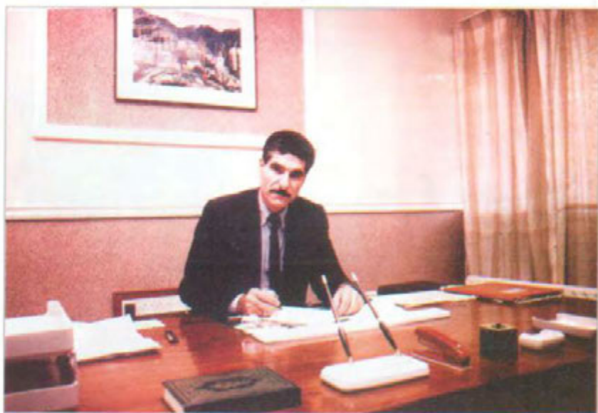
پاریزگاری که رکوک. سالانی (۱۹۹۲ / ۱۹۹۳ / ۱۹۹۴)