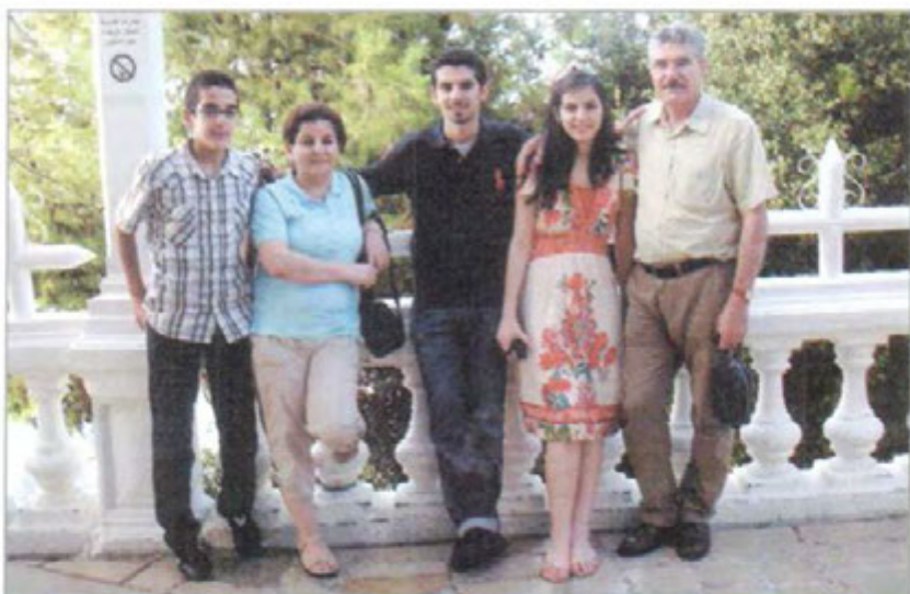
مستهفا چاورهش، زهینۆی کچی، زریانی کۆری، نه‌هاوندی هاوسه‌ری، دابانی کۆری