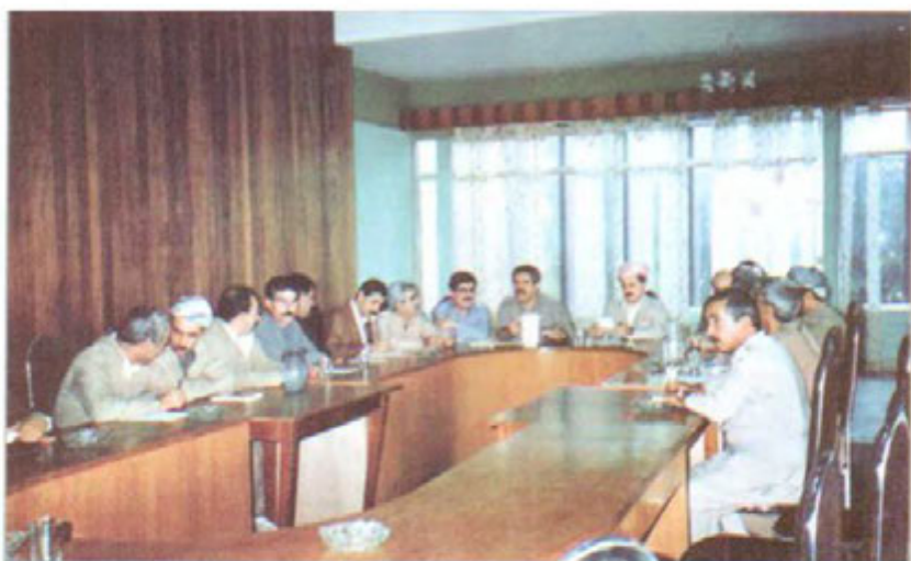
شه قلاوه - کۆبوونهوه به سه ریه رشتی مسعود بارزانی پیش شهری (په ککه) سالی (۱۹۹۲)