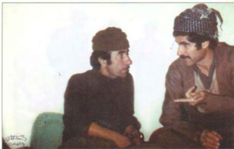
شہید جہ مالی علی باپیر و مستہ فا چاورہش. ۱۹۷۹