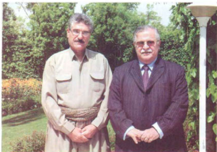
لهگل مام جه لال، قه لاجوالان. ۲۰۰۲