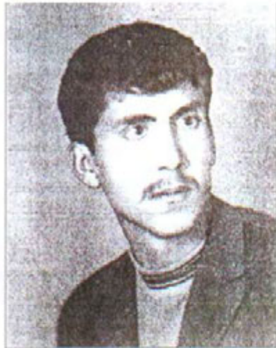
شهید بیستون مه‌لا عومهر سالی (۱۹۸۷) له‌سیروان شهید بوو.