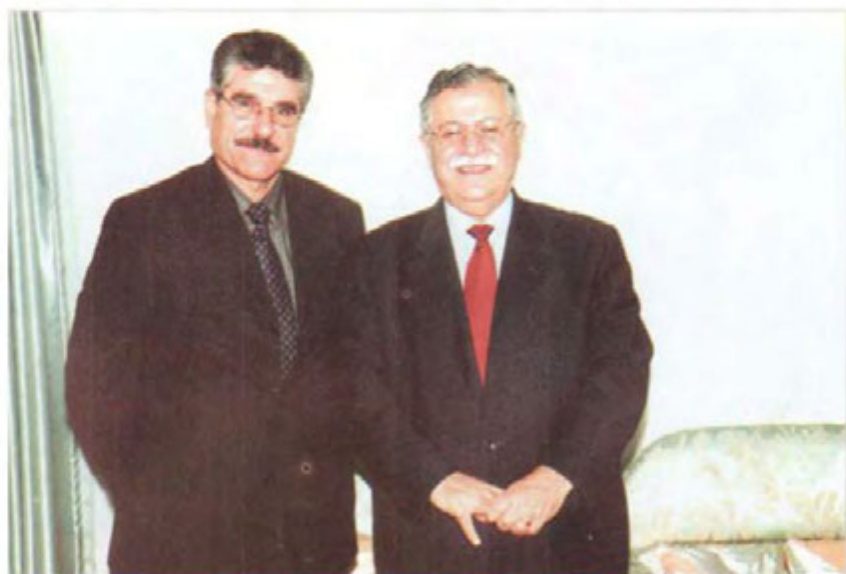
لهگل مام جه لال ۲۰۰۹/۵/۱۳