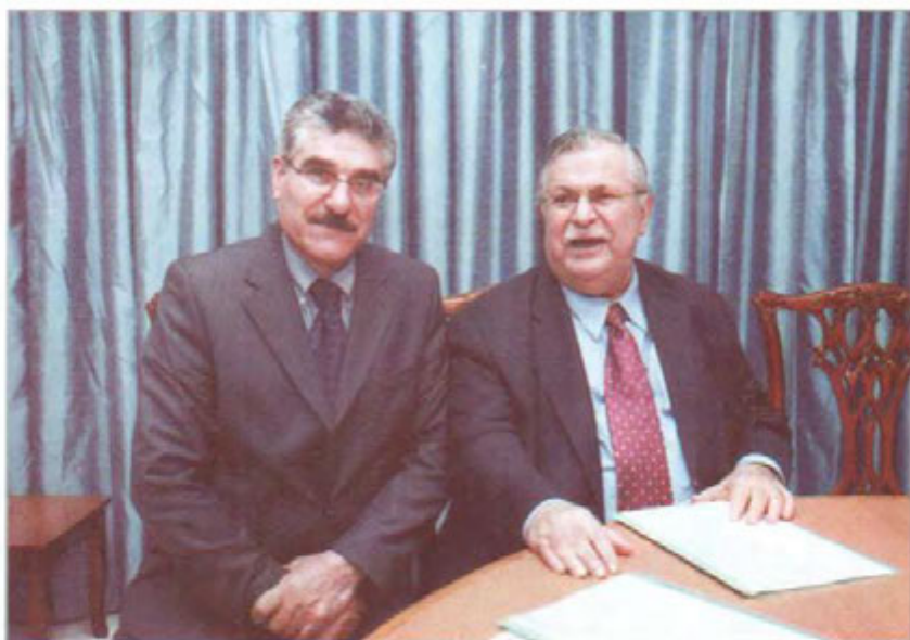
له گال به ریز مام جه لال ۲۰۰۸/۱۱/۳۰