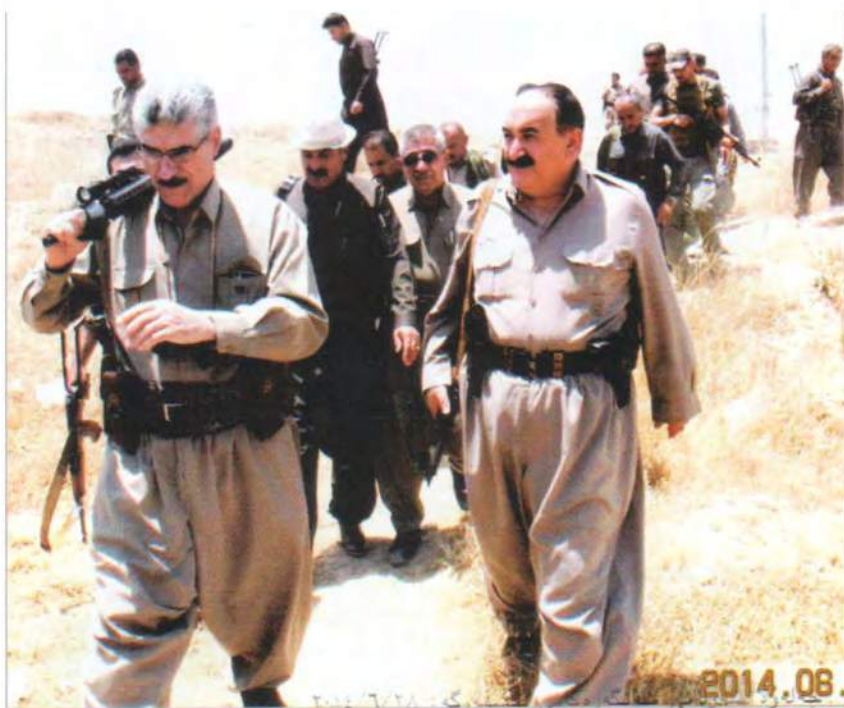
جہلولا سردانی سنگہ رھکانی پٹشمہرگہ . ۲۰۱۴/۶/۲۸