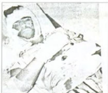
محمود رشید (نہیہن) زاہیر مہمودی برای مستہفا چاورہ ش برینداریون بہ بومی فسفور سالی ۱۹۷۴ لہ گہروی مؤمر ناغا