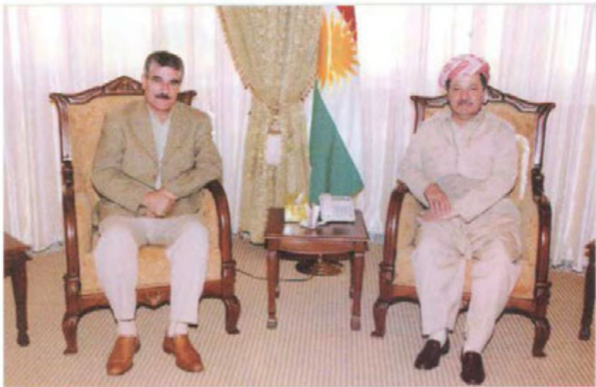
لهگل کاک مسعود بارزانی