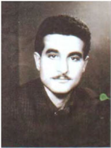
شهید شکریمی وهستا همه‌تیمین په‌نا ناسراو به شکریمی خه‌پسه، سالی (۱۹۸۰) له موسل له سیداره درا