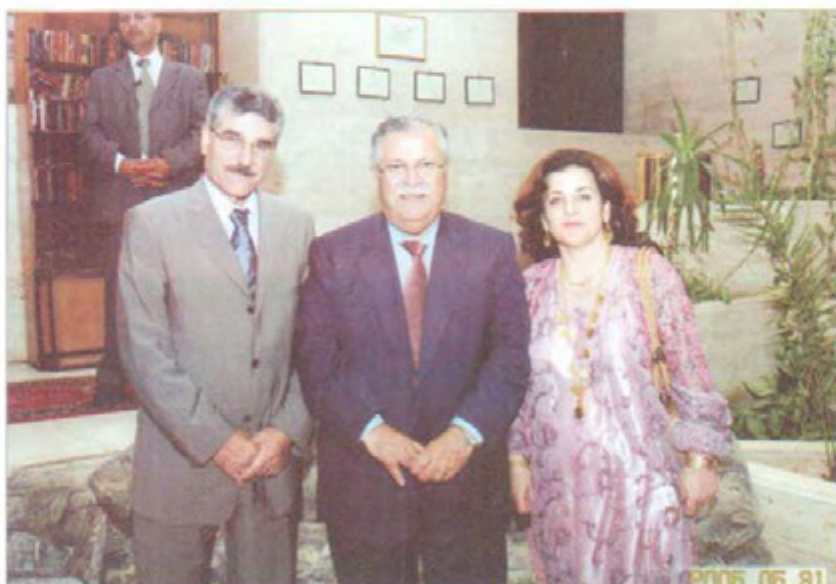
ساليادي دامه زړاندني په کيټي نيشتماني له دوکان. له گڼ مه فال مام جه لال. مستهفا چاوپره ش و نه هاوون حسين حسيني هاوسه ري