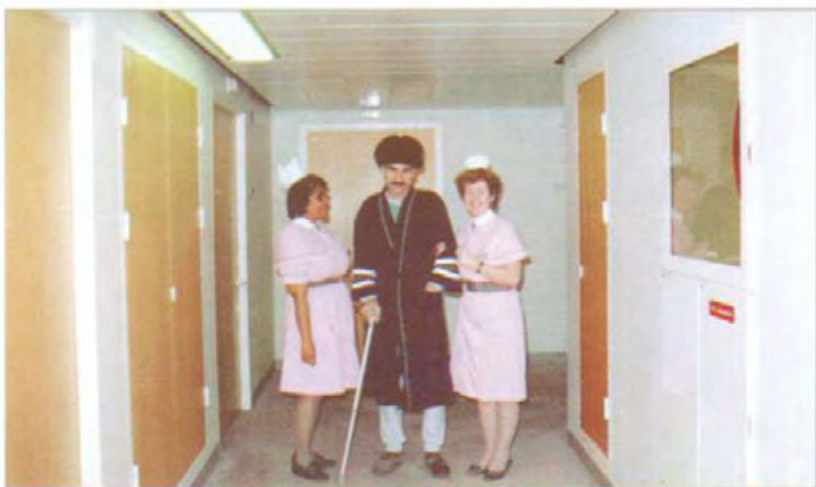
له نه‌خوشخانه‌ی (له‌ندهن بریج) له له‌ندهن. سالی ۱۹۸۷