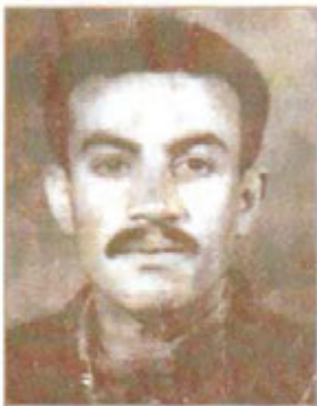
له‌تیف چه‌مه‌مراد. سالی ۱۹۶۹ له به‌ع‌داد ئیعه‌لامکرا