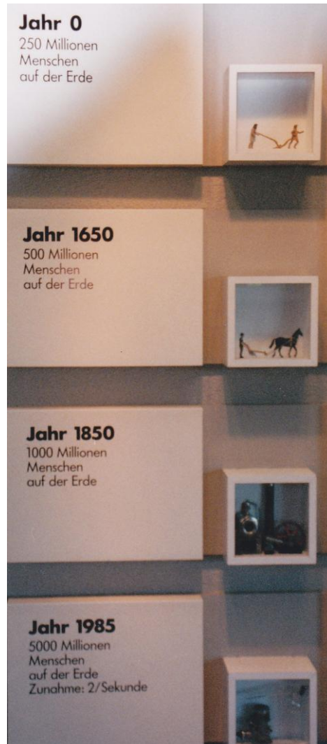
وینەى ژمارە 1

پسپۆرانی ئەم بوارە نزیکەى 250 ملیۆن کەس بوە. لەسالى 1650 گەشەى کردوہ بو 500 ملیۆن مرۆڤ. 200 سال دواتر بەواتا لەسالى 1850 بوته يەك ملیارد. لە سالى 1985 برییتی بوہ لە 5 (پینچ) ملیارد کەس 3 .