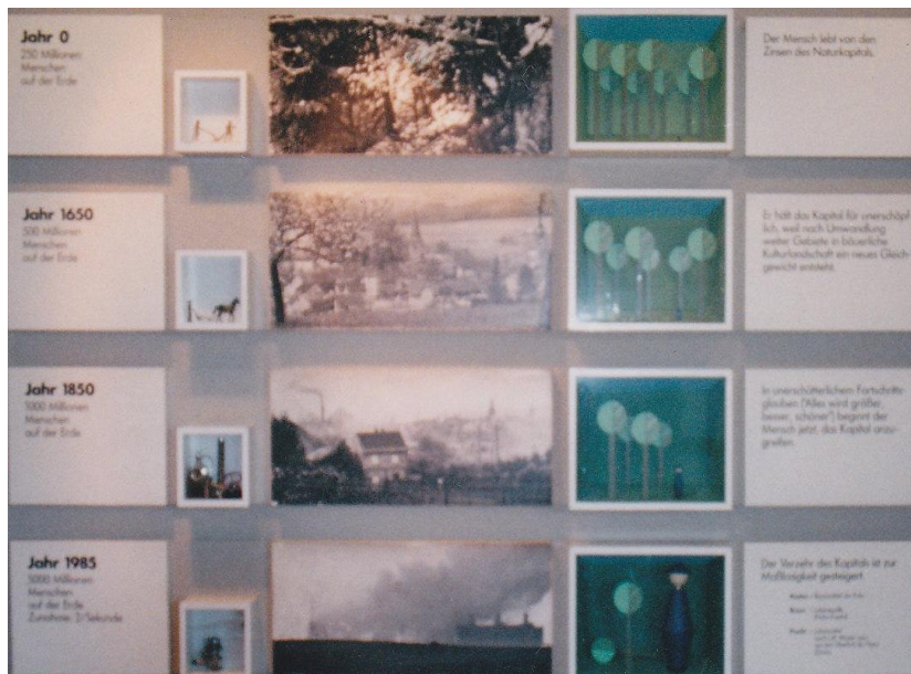
وینهی ژماره 2*

له وینهی ژماره 2 له پال ژماره‌ی ساله‌کانی گه‌شه‌کردنی دانیشتون که‌ئاماژهم پیداوه به‌پیی ئه‌و ژماره‌یه له‌همان کاتدا باری گه‌شه‌کردنی ژینگه‌ش نیشان ئه‌دات. له‌و 1985 ساله‌دا ژماره‌ی دانیشتوانی گۆی زه‌وی که‌ نزیکه‌ی 5 (پینچ) ملیارد زیادی کردوه له‌وینه‌که‌دا ده‌بیین که‌ شیوازی گه‌شه‌کردنی ئامرازی به‌ره‌مه‌ینان و ته‌کنه‌لوژیاش گه‌شه‌ی کردوه گۆراوه. له‌سالی سفر له‌کیلانی زه‌وی به‌ئامرازی سه‌ره‌تایی دواتر گه‌شتۆته دۆزینه‌وه‌ی کاره‌با، به‌واتا وزه. هه‌ر له‌وینه‌ی (2) دا گۆران له‌ سه‌روشتیشدا به‌دی ده‌کریت له‌ که‌مبونه‌وه‌ی سه‌وزایی و دارودره‌خت و پیس بوونی ژینگه‌ش له‌گه‌لیدا. ته‌قینه‌وه‌ی ژماره‌ی دانیشتون ولاتانی "جیهانی سی" ی گرتۆته‌وه‌و بیه‌ۆ نیه. جگه‌ له‌ فاکته‌ری ئاین که‌ منداڵ دیاری خودایه و ئاین ریگا له‌مه‌نعی منداڵ نه‌بوون ده‌گریت، به‌لام هۆ سه‌ره‌کیه‌کان هۆی ئابورین به‌وه‌ی که‌ خه‌لکی، که‌خیزان زه‌مانی کۆمه‌لایه‌تی دوارۆژیان نیه، به‌م هۆیه‌وه‌ منداڵ زۆربوون سه‌رچاوه‌ی کاروکاسپییه، به‌تایبه‌ت کوپ که‌ به‌زه‌مانی دوارۆژی خیزان ده‌بینریت و سه‌رۆکایه‌تی مالیش بگریته ئه‌ستۆ. لیره‌دا ئاسایشی دانیشتون و ئاسایشی خۆراک و ژینگه‌ش ده‌بنه به‌شیک له‌ئاسایشی نه‌ته‌وه‌یی.