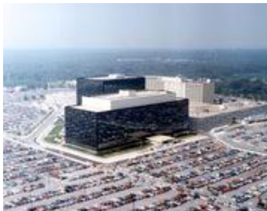
مقهری سه ره کی وه کاله ی ئاسایشی نه ته وهیی ویلایه ته یه کگرتوه کانی ئه مریکا (قه واره ی بیناکه و ده وره به ر گرنگی پرۆژه که نیشان ئه دات)

یه کهم ئه نجومه نی ئاسایشی نه ته وهیی ویلایه ته یه کگرتوه کانی ئه مریکا له مانگی 1947/7 له ژیر دهسه لاتی سه رۆکی ئه وکاته (هاری ترومان) دروست بوو، به لام جیگره که ی که بریتی بوو له (ئالبن بارکلی) سه رۆکایه تی ئه نجومه نه که ی ده کرد. ماوه یه کی که م دوا ی ئه وه یه کیک له یه که م لیکۆلینه وه کانی بارودۆخی جیهان کاریگره یه کی کاریگره رانه ی هه بوو. موزه که ره ی (میمۆره ندوم) ی ژماره 68 ی ئاسایشی نه ته وهیی ئه مریکا له 1950/4/14 ته وسیه ی سه رۆکی ئه مریکای کرد خه رجی سوپا به توندی زیاد بکات بۆ ئه وه ی کاریگره ی کۆمۆنیزم له سه ر ئاستی جیهان ته سک بکاته وه. دوا ی دواخستنیکی زۆر سه رۆکی ئه مریکا هاری ترومان ره زامه ندی له سه ر ته وسیه کان دوا ی ده ستپیکردنی جهنگی کۆریا ده ربیری. ئه م بریاره یه کیک بوو له ئیرشاداته که مه کانی ئه نجومه نی ئاسایشی نه ته وهیی که هه تا ئیسته له ناو رای گشتیدا ناسرابییت. لیره دا ده بینین که ئه نجومه نی ئاسایشی زۆریه ی کات له باکگراوندا کاریگره یی خۆی هه یه 7 .