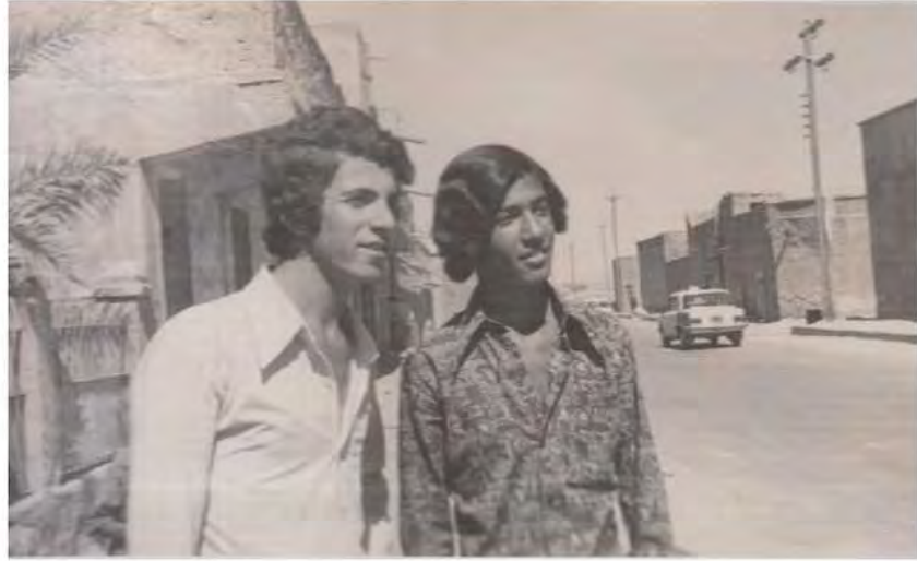
نآزاد نه حمهد- كه ريم پهرهنگ 1977/9/30