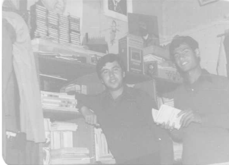
نازاد نه‌حمده و مستهفا گهرمیانی له مالی نازاد 1980