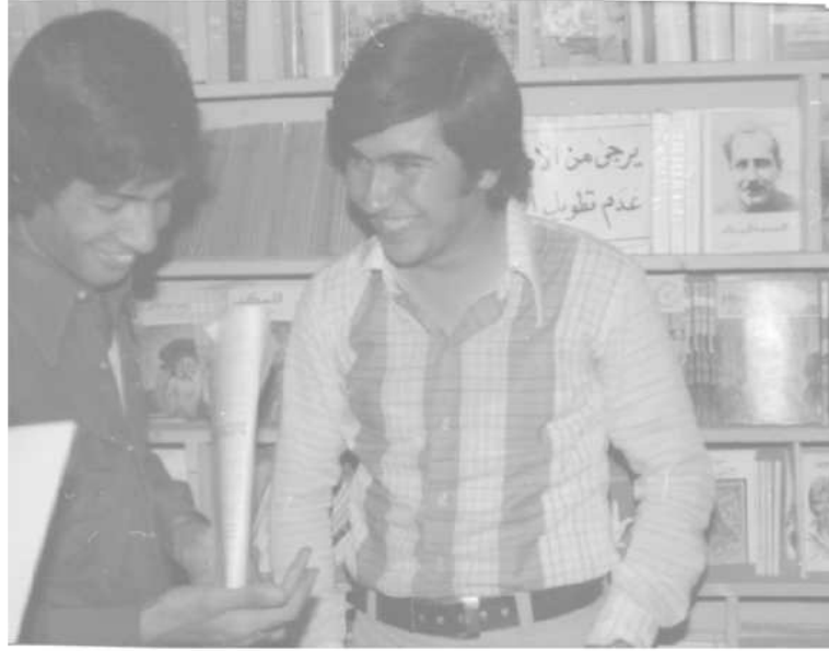
مستهفا گهرمیانی و نازاد نه‌حمده له کتیبخانه‌ی ناسۆ 1980