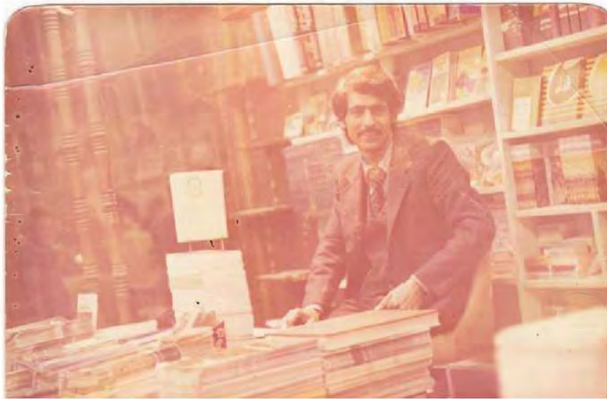
جہبار ناسو له کتیبخانهی ناسو- سالانی سهرمتای ههشتاکان