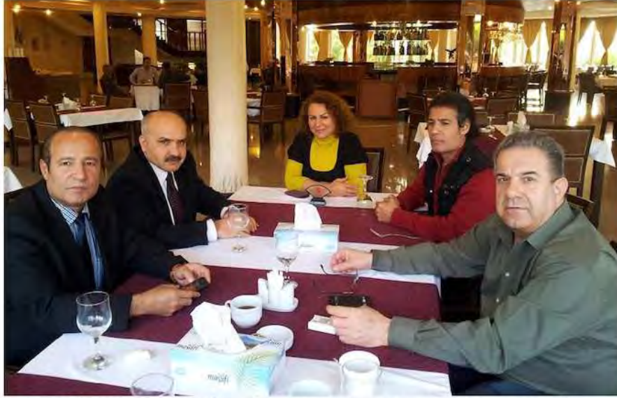
یہ گگرتنہ و دی بہ شیک نہ ہاوریانی شقامی جمہوری پاش 35 سال: نہ راستہ وہ: کہ ریم پہرہ نگ، نازاد نہ حمہد، دلپاک تہیر، مارف عومہر گول، نہوزاد نہ حمہد، نوؤہ مہری 2013 سلیمانی