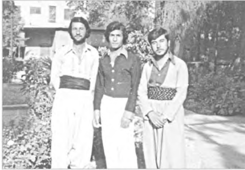
مستهفا گهرمیانی- نازاد نه‌حمده- نه‌وزاد نه‌حمده 1980