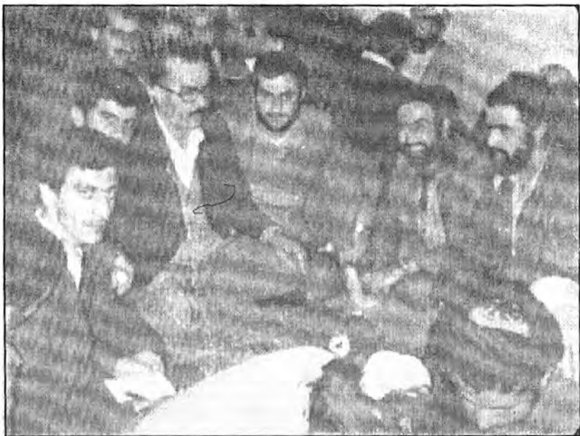
ویننیهک له کونگره‌ی شورای شمس له تاران ( ۱۹۸۱ )