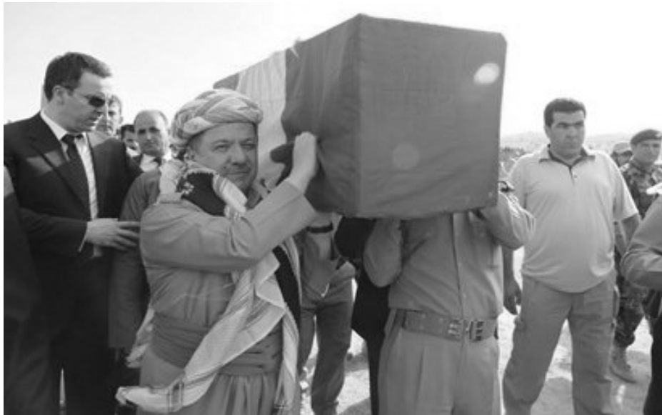
سه‌رۆک مه‌سعود بارزانی کاتی گواستنه‌وه‌ی روفاتی ئه‌نفالکراوه‌کانی رژیمی به‌عس