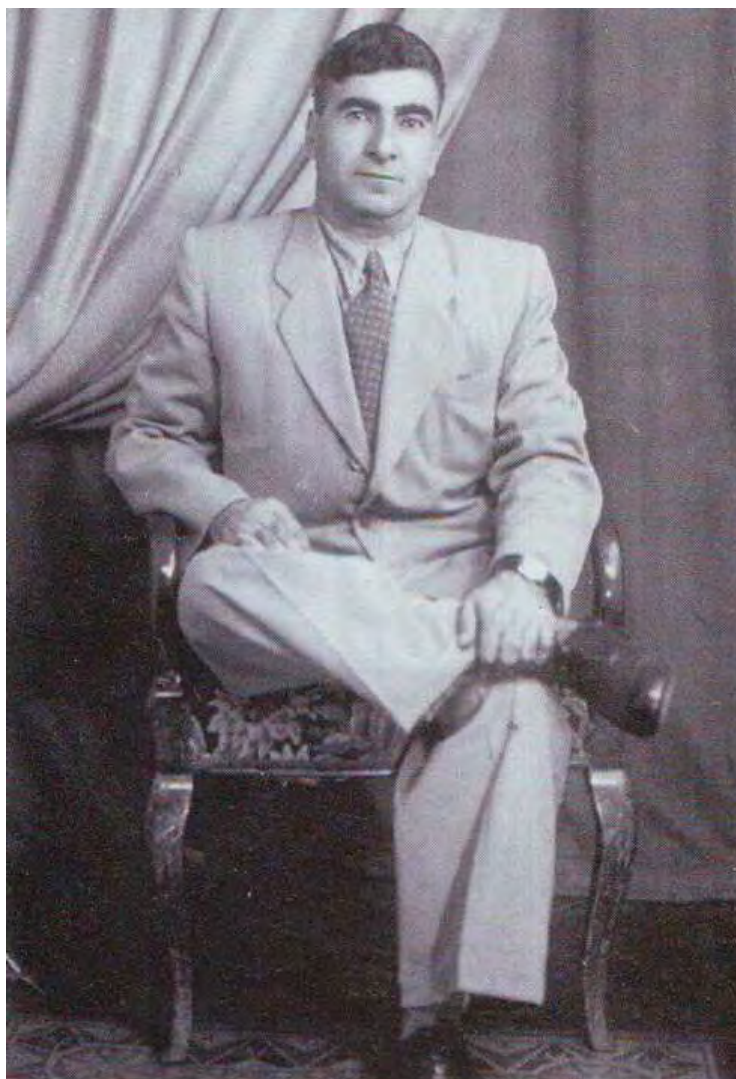
بارزانی لە سەردەمی خویندنییدا لە ئەکادیمیای بالای حیزبی کۆمونیستی یەکیەتی سۆفیەت لە مۆسکۆ ١٩٥٧