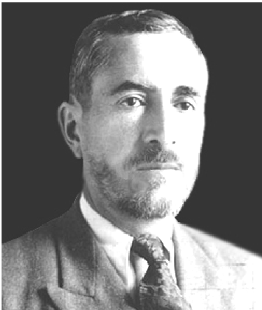
پیشہ‌وا قازی محمہد ۱۹۴۶