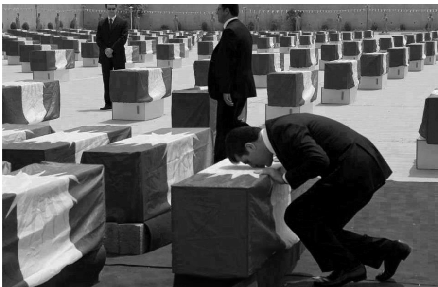
نیچیرقان بارزانی سه‌رۆکی حکومه‌تی هه‌ریمی کوردستان کاتی به‌پیکردنی پوفاتی ئه‌نفالکراوه‌کانی پژییمی به‌عس