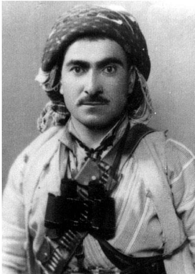
مستهفا بارزانی ۱۹۴۴