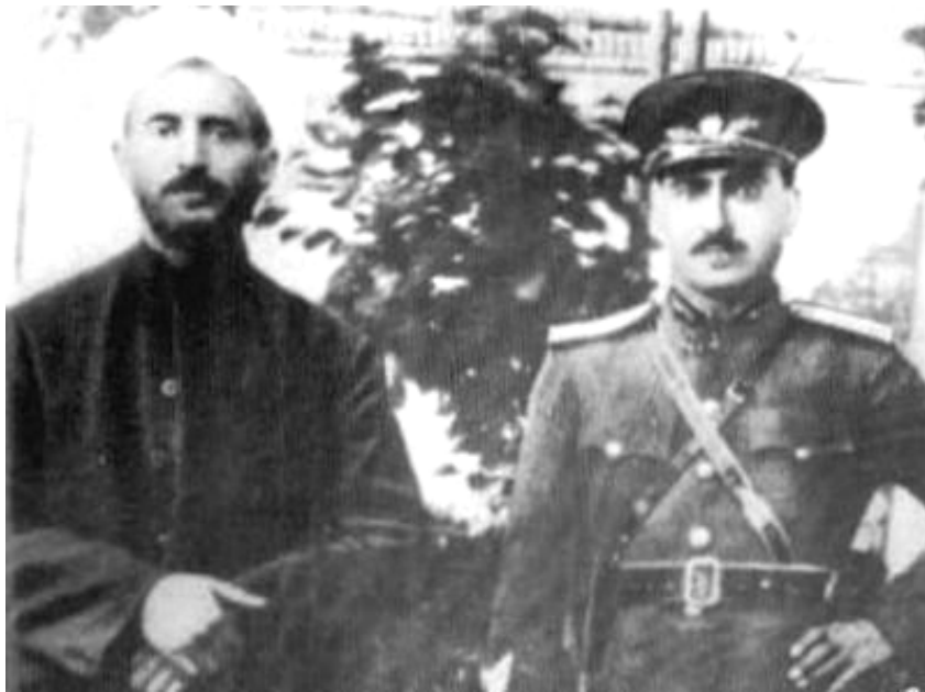
پیشه‌وا قازی محهمه‌د و ژهنه‌پال مسته‌فا بارزانی له کۆماری کوردستان دا ۱۹۴۶