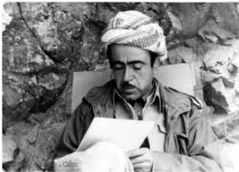
سەرکرده‌ی نهمر و لیپهاتووی کورد ئیدریس بارزانیی له سه‌رده‌می پیشمه‌رگایه‌تی له شاخ ۱۹۷۴