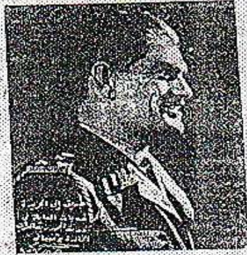
تخیر خہ بات الی زعمیم المردی