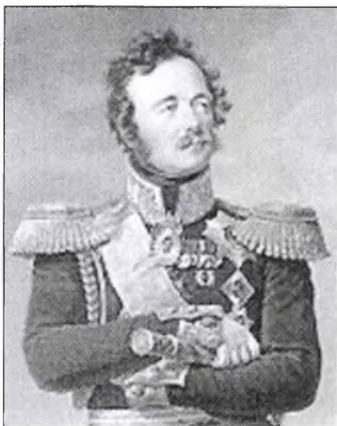
Gênêral Î.F. Paskêvîç