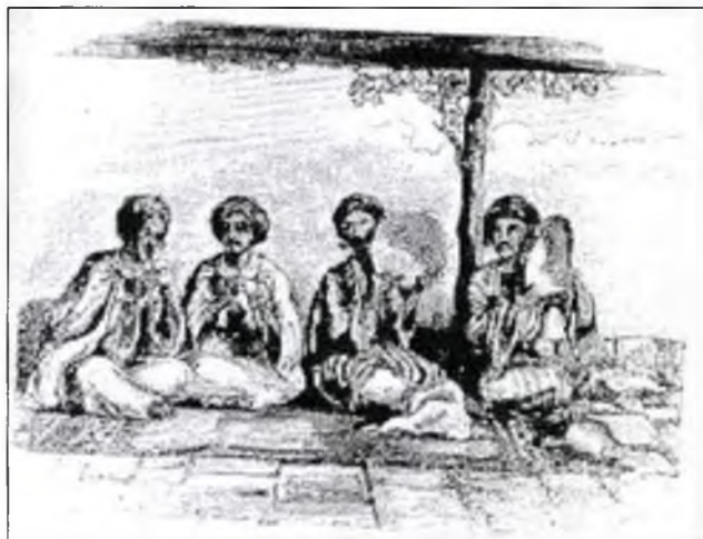
Qewalên Êzdyâ despêka sedsala 19 an

yên mezin, we xizna edebyeta cihanê bixemilinin. Yê ku ew berhem efrandine şayîr, filosof û zanyarê dema xweye mezin bûne. Wana nikaribû çiyê vala ew tişt biefirandana û tu tiştên nivîskî jî ji pey xwe nehîştana.