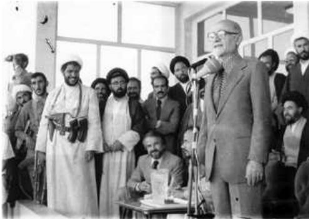
حاجی هسهنی و قاتلانی تری خهلكی بیذیفاعی قارنج

مهلا مهحمودی مهستورزاده كه به قورئانهوه بهرهو پیری خهلك پویشتبوو، بهکریگراوانی "معبودی" و "سرگرد نجفی" و "عزیز قادری" و مهلا "حسنی" ئهوانیان كوشت و ٦٥ كهسیان به شیوهیهکی قیزهوهن. گهر "امام خمینی" به دواوا چوونهوهی ئهم کردهوه دلتهزینه نهکات، ئهی کام بهرپرس به دواي دا بچی. به ریزهوه: "صادق خلخالی".