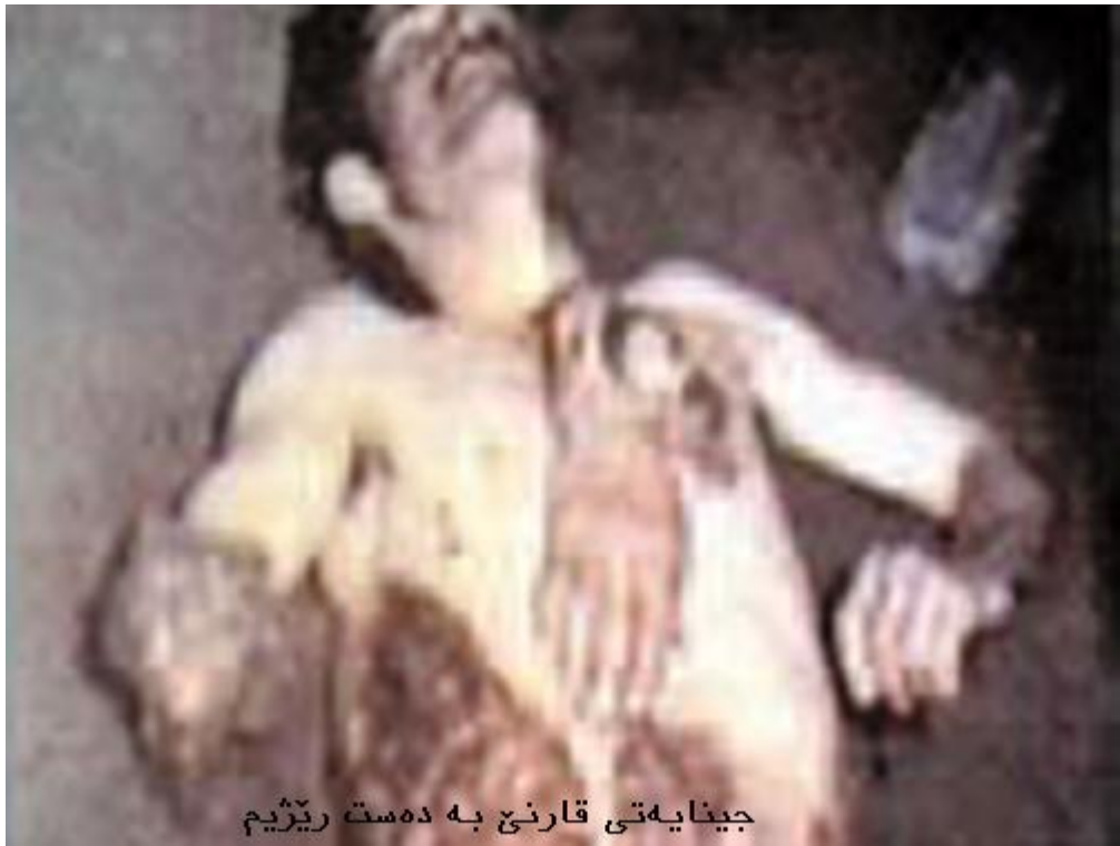
جینایه تی قارنئ به ده ست رژی می

گوندی قارنئ یه کیک له دیهاته کانی خاکی کوردستانه که به پیی دابه شکردنی ولات له ئیران دا، ئەم گونده له باری ئیدارییه وه سەر به شاری نهغه ده و پارێزگای ئازهر بایجانی رۆژئاوا ده ژمیردرییت. ریکه وتی ۲ سیپتامبری ۱۹۷۹ی زایینی (۱۱ شهریور ۱۳۵۸ی ههتاوی)، ئەم گونده کهوته له لایهن کاربه دهستانی رژی می کۆماری ئیسلامی ئیرانه وه گه مارۆ درا و خه لکی سیویل و بی تاوانی دانیشتووی ئەم گونده به دهستی ناردراوانی حکومه تی ئیران کوزران. کاره ساتی دلته زینی تونا کردنی کورد له قارنئ ته نیا به کوشتنی ئەوان کۆتایی پی نه هات، به لکوو کاربه دهستانی حکومه تی پاش کردنی جه نایه ته که، ته نانه ت به زه بیان به تهرمی قوربانیه کانی دا نه هات و به چه قۆ و کێرد، سهری گیانه ختکراوه کانیان له له شیان جیا کردنه وه. جیا له م کرده وه وه حشیا نه یه، بکوژانی ناسراوی ئەم کاره ساته له ماوه ی ۳۲ سالی رابردوو دا له لایهن حکومه تی ناوه ندی ئیرانه وه پالپشتی کراون و هه چکات بو دادگاییک بانگه یشت نه کراون تا لیپرسینه وه یان ته نیا به شیک له دلئ پر له خه می خزم و که سی گیانه ختکراوه کان هیم بکاته وه.