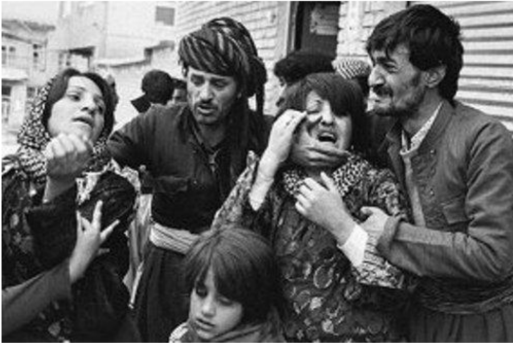
ئاواره بوونی خه‌لکی بی‌دیفاعی قارنج، دوائ قه‌نل و عام کردنه‌که به ده‌ستی رژیمی کۆنه‌په‌ره‌ستی کۆماری ئیسلامی ئیران

ناردراوه‌کانی ولاتی ئیران بهو هه‌موو بواری چهک و شه‌پوه هیرشیان برده سه‌ر ئه‌م گونده، مه‌لا "محمد" کتیبی پیروزی قورئانی که بایه‌خدارترین په‌رتوکی موسولمانانه، به ده‌سته‌وه گرت، به‌ره‌و پیری به‌رپرسیانی ئه‌رته‌ش روپی و ئه‌وانی به "کلام الله" سویند دادا تا به‌رگری له کوشتاری خه‌لکی بی تاوانی قارنئ بکا. "جلادان"ی رژیم گولله‌یه‌کیان به سینگى ئه‌م پیره پیاوه ئیمانداره‌وه نا و پاش کوشتنی، سه‌ریان له له‌شی جیا کرده‌وه. ئه‌م کرده‌وه دلته‌زینه له روژنامه‌ی "اطلاعات"ی چاپی تاران (طهران) له روژی ۷ی ۱۲ی ۱۹۷۹ی زایینی دا بلاو بووه.