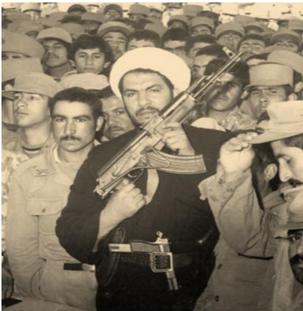
حاجی حهسهنی و قاتلانی تری خه لکی بی‌دیفاعی قارنئی

ئیسنا له ره‌گه‌زکوژی کورده‌کان له گوندی قارنئی ۳۲ سال تیپه‌پریوه. حاکمانی شوڤشی تا ئیسناش بایه‌خیان به راپورته‌کانی خویمان و چاپ کراو له رۆژنامه‌کانی سهر به خویشیان نه‌داوه. بکه‌ران و بکوژانی قارنئی زۆرینه‌یان زیندوون و خاوه‌ن پله و پۆستی به‌رزن له ئیرانی ئیسنا دا. هه‌موو به‌لگه‌کانی به‌ر ده‌ستیش و گێرانه‌وه‌ی دیتنی باقی قارنئی‌بییه‌کان به‌لگه‌ن بو ئه‌وه که ئه‌م کوشتاره سیاسییه له لایان خودی حکومه‌ته‌وه ئه‌نجام دراوه. به‌رنامه‌یه‌ک که بو مه‌به‌ستی تونا کردنی گروپیکی ئه‌تنیکی دیاریکراو دارپێژرابوو، ئه‌نجام درا و به‌رپوه چوو. پیلانیک که به پالپشتی زۆرینه‌ی که‌سانی ناسراوی حکومه‌تی چئ کرا و به‌رپوه چوو. رووداوێکی که ئیمه ئه‌م‌رۆکه به ناوی ژینۆساید ده‌یناسین. پرسیار لیڤه دا ئه‌مه‌یه که له جیهانی به ناو شارستانی ئه‌م‌رۆ دا، چلۆن ده‌کرئ له‌وه تیگه‌هین که نه‌ته‌وه‌یه‌ک له لایان به‌رپرسیانی حکومه‌ته‌وه گیانیان له مه‌ترسی کوشتاری له پیش دارپێژراو ده‌که‌وئ، کوشتاریان ئه‌نجام بدرئ، به‌لام نه‌ته‌نیا تا ئیسنا ئه‌م ژینۆساید که هیچ ولانیک دا به‌فه‌رمی نه‌ناسراوه، به‌لکوو هیچ راگه‌یاندنیک جیهانیش هیچ باسیکیان له سهر ناکا.