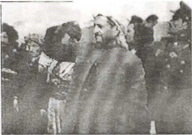
پنڤهوا له حالته سلاوی کۆماری بۆ پینمهه رکه کان