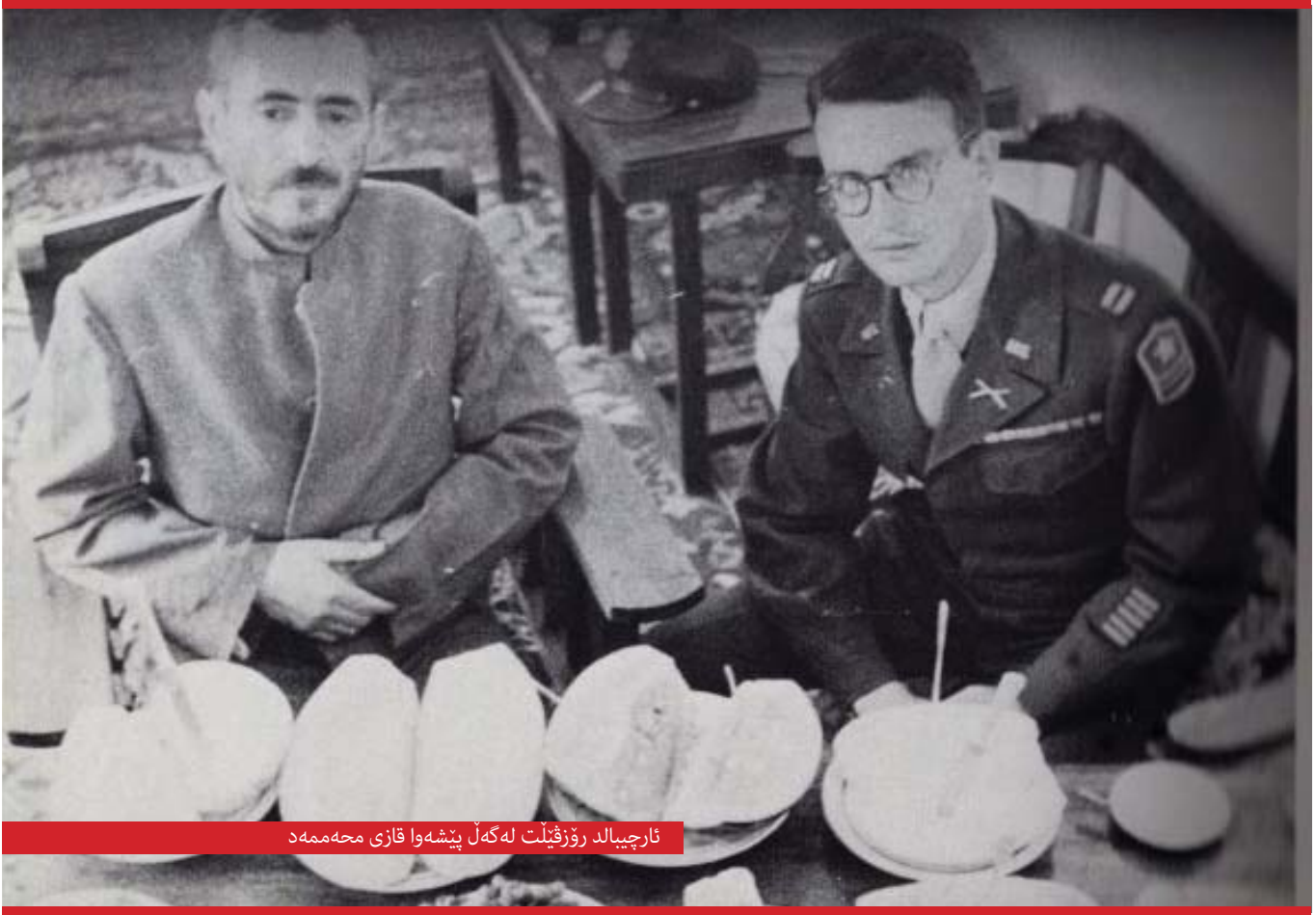
ئارچيبالد رۆزفيلت له‌گه‌ل پيشه‌وا قازی محهممه‌د

به‌مه‌به‌ستی ئاشنایی هۆگرانی ريگا و ريبازی قازی محهممه‌د له‌گه‌ل بۆچوونه‌کانی رۆزفيلت له‌سهر کۆماری کوردستان، هيندیک به‌شی کتیبه‌که که‌ وه‌رگير سالی ۱۳۷۲ کردوو به‌ کوردی [۱] ئيره‌دا به‌بۆنه‌ی يادی له دایکيوونی پيشه‌وا ده‌خه‌ينه‌وه به‌رچاوی هۆگران.