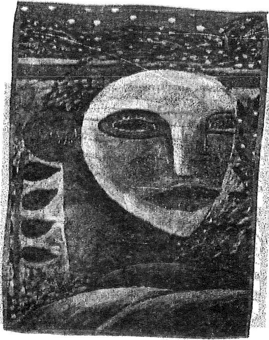
بەرگی کتیپیکه به ناوی (ژنی ئوسترالیاایی) که نووسینگهی کاروباری ژناتی ئوسترالیا بلاوی کردۆتتهوه