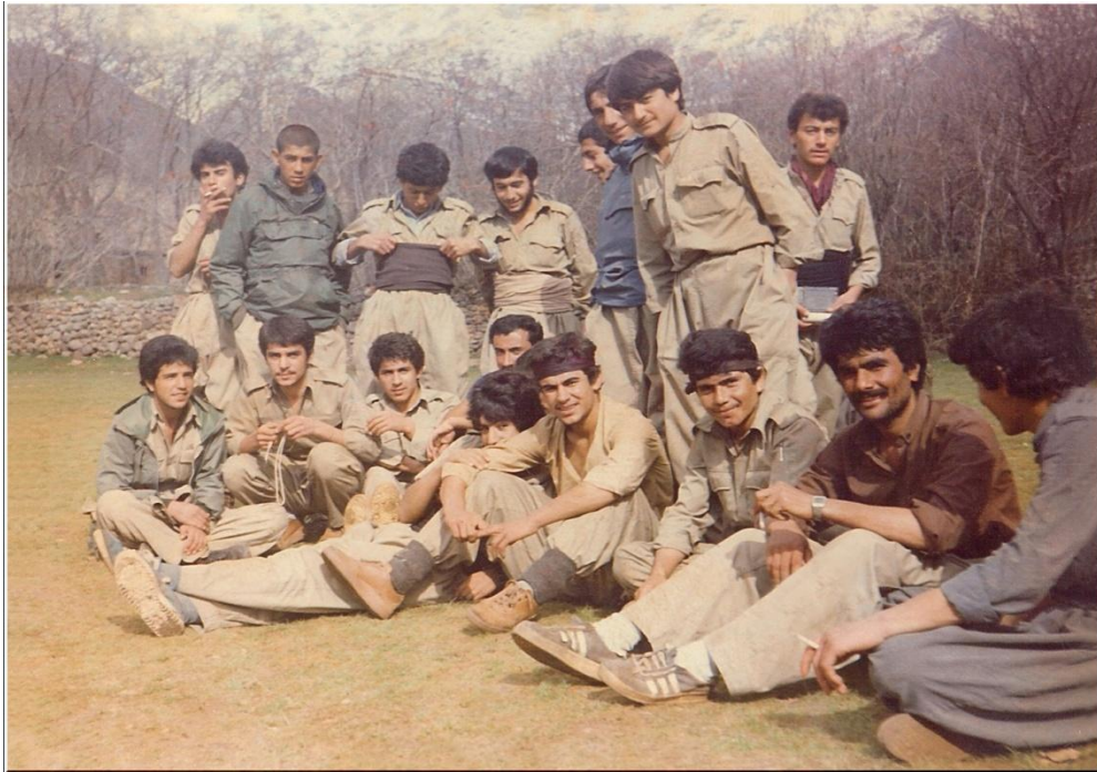
هانی گهرمه له 1366 (۱۹۸۸زایینی)