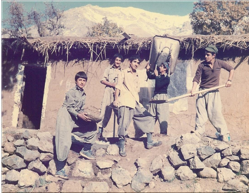
قه ندیل 1365 (۱۹۸۶زایینی) بنکھی یه کیه تیی لاوانی دیموکرات