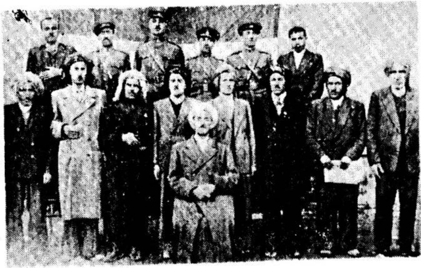
پیشه وا قازی محه معه دو هیندی له وه زیرانسی کوماری کوردستان