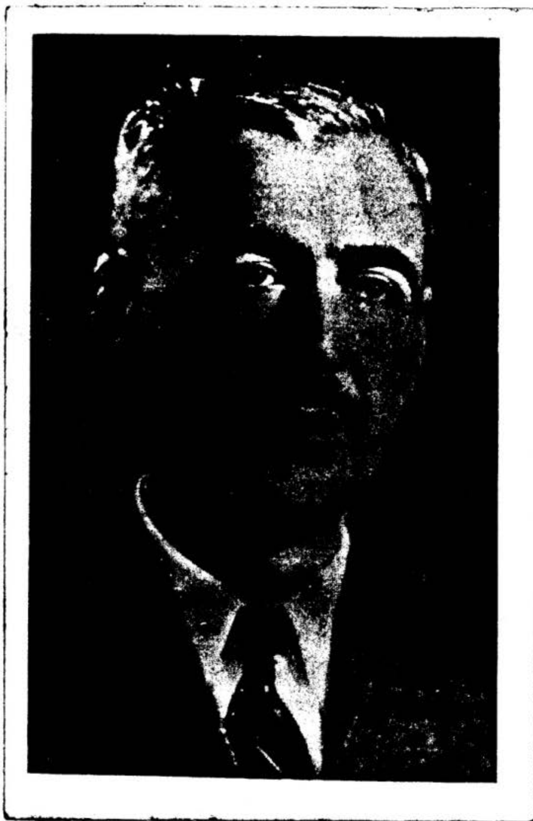
شه هيد سه دري قازي نوسنه ري مه هابار له پارلمان