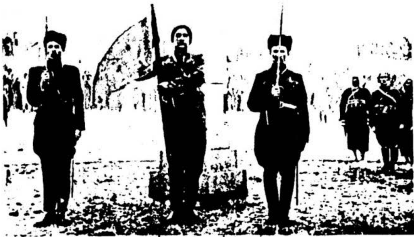
روزی سه لکردنی تالاله مه ها باد دپسامبری ۱۹۴۵