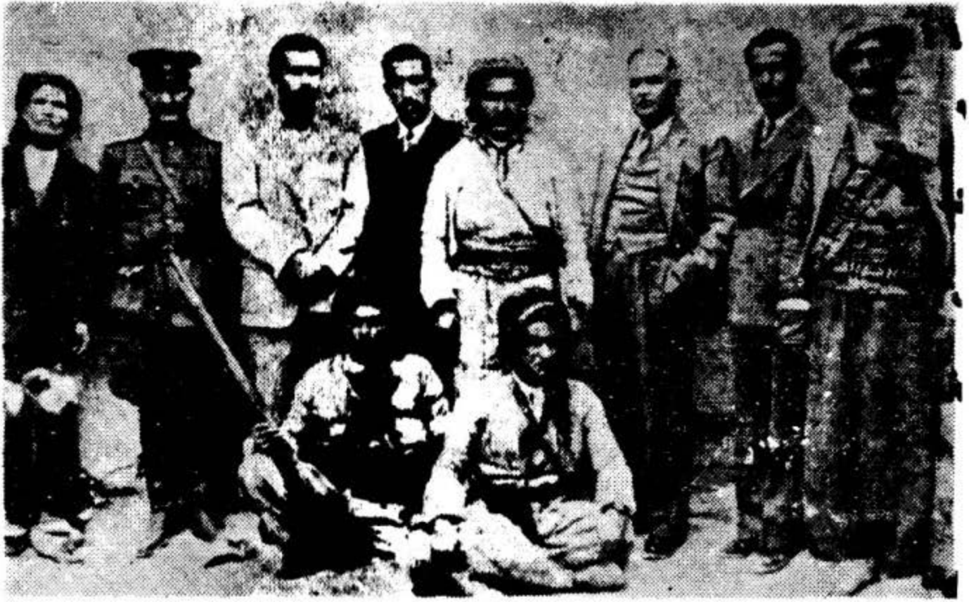
مه لا مسته فا و قه دری جه میل پاشا و قه فسه ره کوردده کانسی کوردستانی گه رمین له مه هاباد ۱۹۴۶