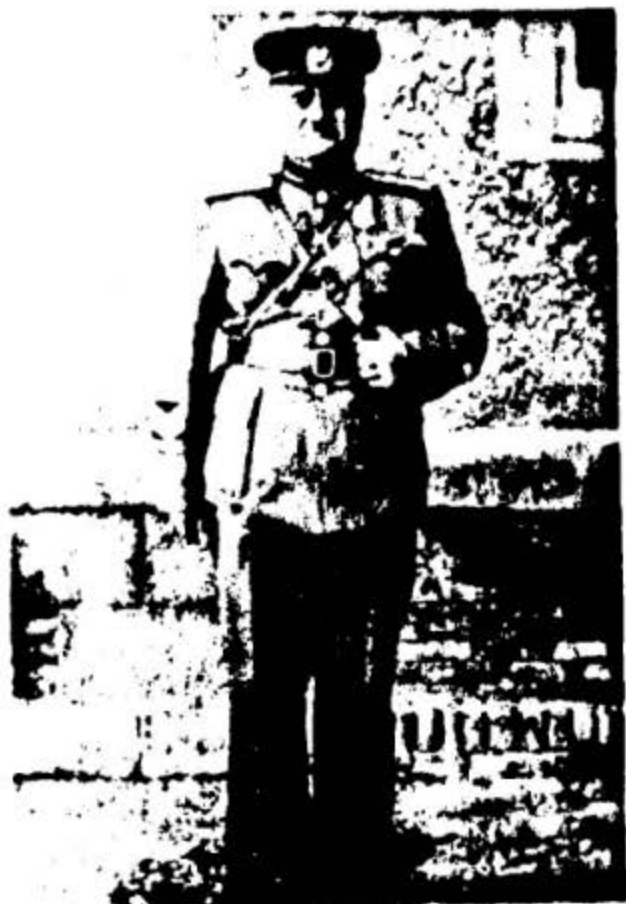
حہ مہ وسین خانسی سے یفسی قازی وہ زہری بہ رگری کوماری کوردستان ۱۹۴۶