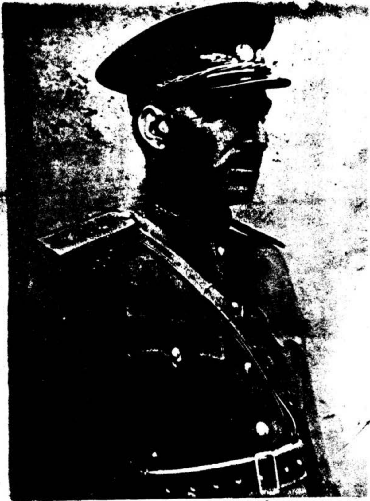
ژنرال مصطفی باورزانی