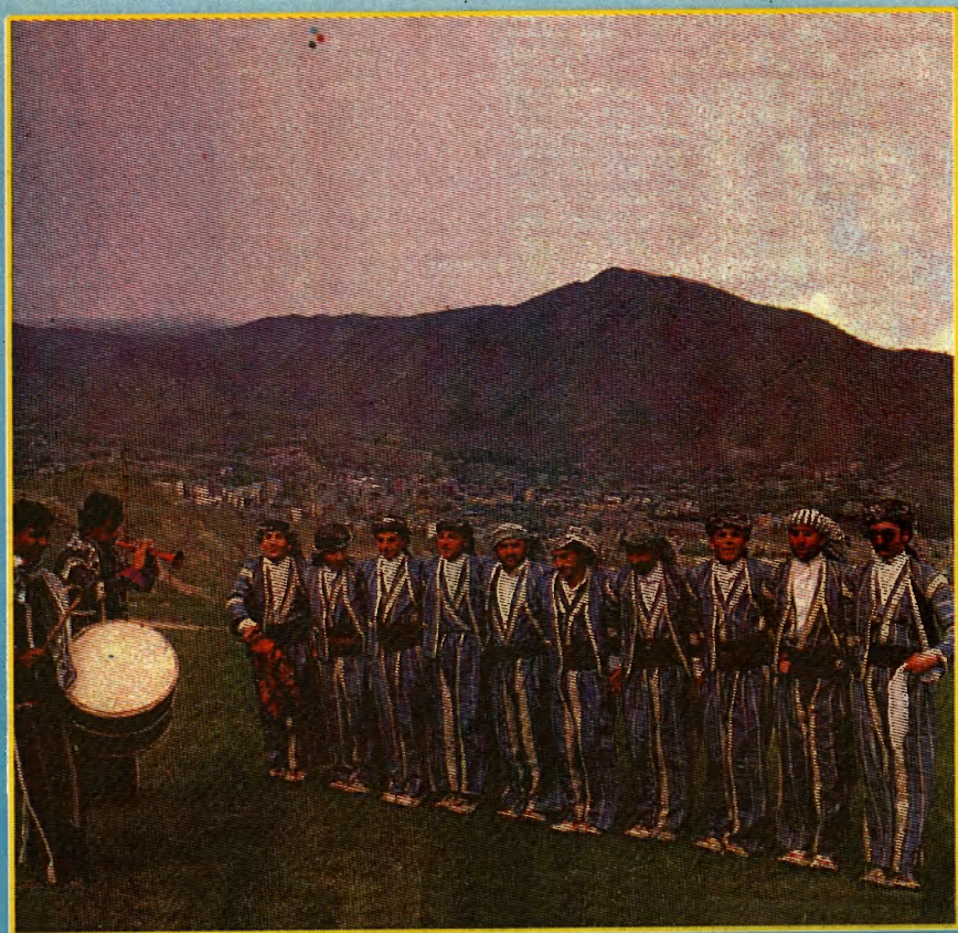
Çapxana Xebat - Duhok